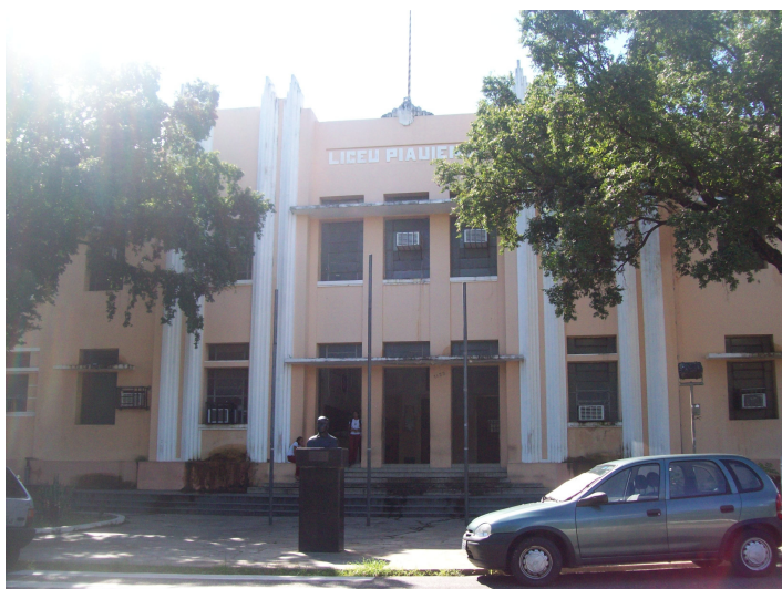
Figura 02- Fachada do C. E. Zacarias de Góis

Durante o período de 1861 a 1867 permaneceu fechado, pelas dificuldades decorrentes da estruturação da nova capital. Desde a sua fundação até o ano de 1936, a escola se localizou em diferentes pontos da cidade, pois foi somente nesse ano que foi construída na Praça Landri Sales a atual sede do Liceu Piauiense.