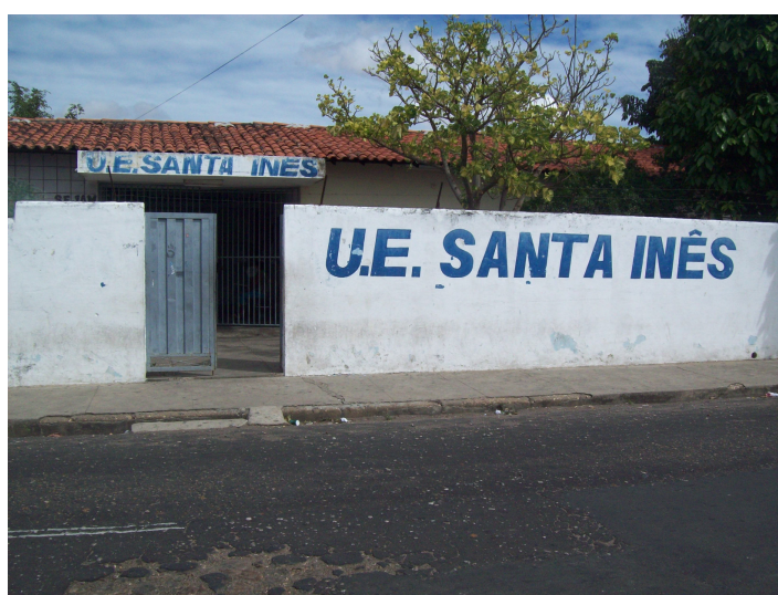
Figura 09 – Fachada da Unidade Escolar Santa Inês