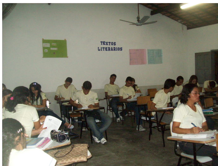
Figura 08- Sala de aula da Unidade Escolar Santa Inês