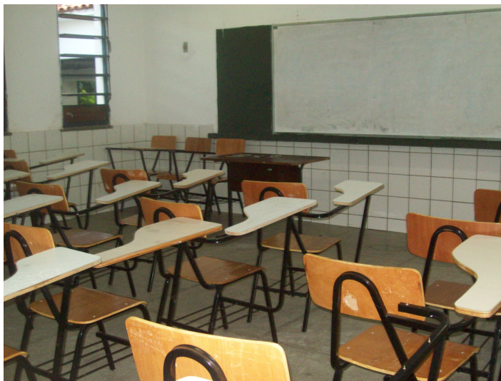
Figura 07- Sala de aula da Unidade Escolar Maria de Lourdes Rebelo