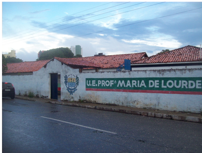
Figura 05- Fachada da Unidade Escolar Maria de Lourdes Rebelo

Atualmente a escola atende a 915 alunos distribuídos nos três turnos. Esse público é proveniente, sobretudo, de bairros vizinhos ao bairro de Fátima, como Satélite, Vila Maria, Piçarreira, Planalto Uruguai.