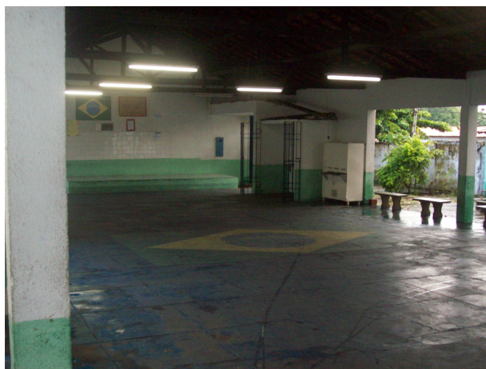
Figura 06- Pátio da Unidade Escolar Maria de Lourdes Rebelo

Atualmente a escola atende a 915 alunos distribuídos nos três turnos. Esse público é proveniente, sobretudo, de bairros vizinhos ao bairro de Fátima, como Satélite, Vila Maria, Piçarreira, Planalto Uruguai.