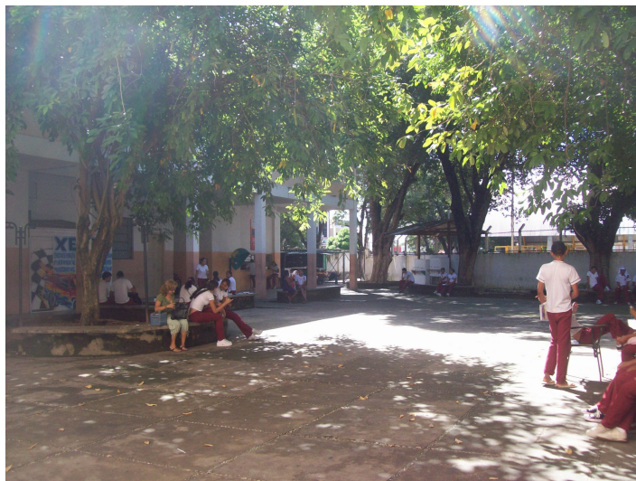
Figura 04- Pátio da Escola

Por ter muitos anos de existência e por durante muito tempo ter figurado como principal fonte e educação secundária da cidade, trata-se de uma escola bastante conhecida e procurada na cidade de Teresina. A escola atende praticamente alunos oriundos de toda a cidade, portanto, podemos afirmar que podemos encontrar grande diversidade no alunado dessa escola.