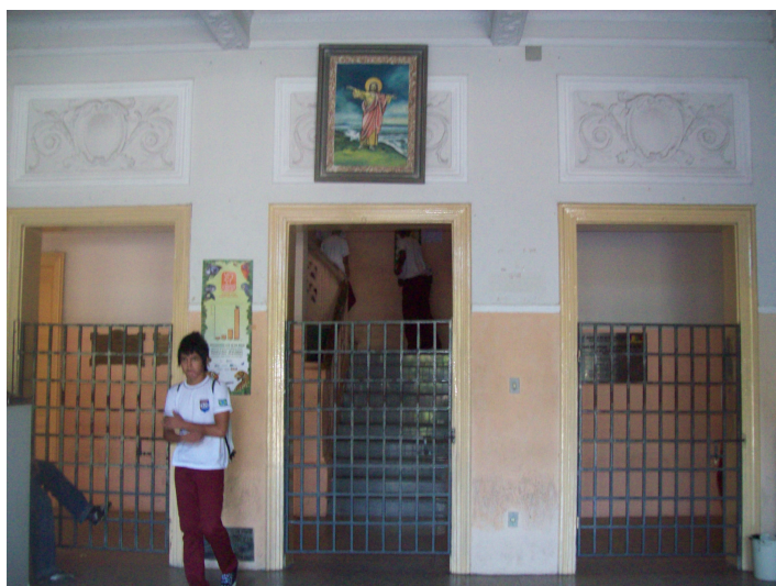
Figura 03- Entrada dos alunos

Atualmente o Colégio, com quase 164 anos de existência, assume a missão de oferecer o Ensino Médio. São 2.173 alunos matriculados, no ano letivo de 2009, nas 1ª, 2ª e 3ª séries nos turnos manhã, tarde e noite.