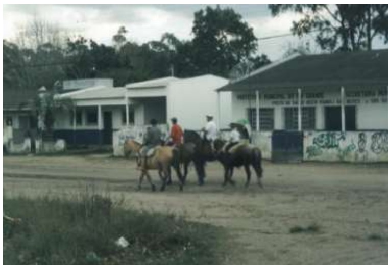
Figura 2 - Campeiro X Urbano . Fotografia. 2006. Por Michelle Salort

Com a finalização da graduação, ingressei no curso de Especialização, “Rio Grande do Sul: Sociedade, Política & Cultura”, igualmente oferecido pela Universidade Federal do Rio Grande, e a pesquisa enfatizou as transformações na cultura popular gaúcha. Intitulada “A Cultura Nossa de Todo Dia: Tradicionalismo, História e Fotografia na construção da identidade social da Vila da Quinta”, a investigação privilegiou a associação metodológica entre a história oral, como forma de averiguar os fatos que não procedem de nenhuma bibliografia, mas sim das vivências individuais dos sujeitos; e a fotografia, como instrumento investigativo e de criação artística (Figuras 2 e 3).