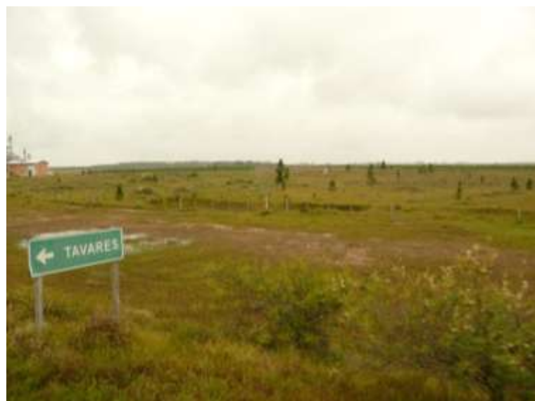
Figura 5 - A bela Tavares . Fotografia. 2008.