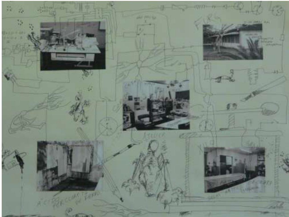
Figura 10 – Ensaio visual 4 , Fotografia, 2009 Por Michelle Salort