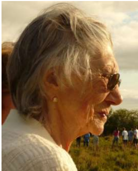
Figura 4 - Minha avó . Fotografia. 2008. Por Michelle Salort.

Nesse instante, entendi como o sentimento de pertencimento pode ser significativo para o meio: minha avó, ao perceber que a sua Tavares não existia mais e que o que existe hoje é uma nova Tavares, com a qual ela não tinha ligação e não se sentia pertencente, fez-me ver que a cidade era apenas um lugar que ela nem podia mais chamar de seu , porque sua era a que estava guardada na memória.