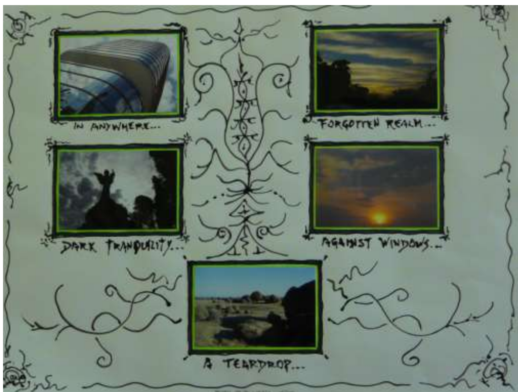
Figura 11 – Ensaio visual 5 , Fotografia, 2009. Por Michelle Salort