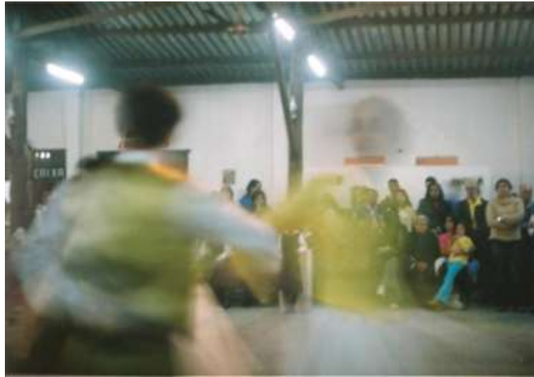
Figura 3 - A imagem . Fotografia. 2006. Por Michelle Salort.

Nessa trajetória fui buscando compreender a formação identitária dos sujeitos, a memória individual e coletiva, que permeiam os sistemas de convivência. Ao ingressar no mestrado do Programa de Pós Graduação em Educação Ambiental, optei por dar continuidade à pesquisa sobre os conceitos que já haviam sido trabalhados, para tentar entender o pertencimento e sua relação com o meio ambiente.