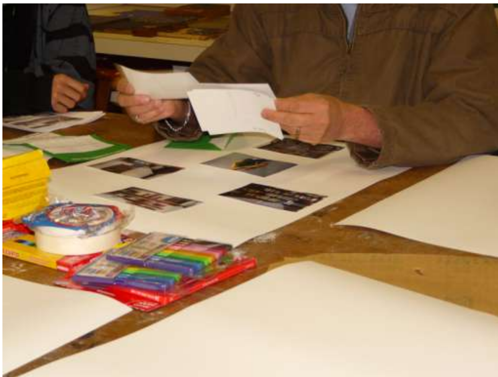
Figura 8 – Ensaio visual 2 , Fotografia, 2009. Por Michelle Salort