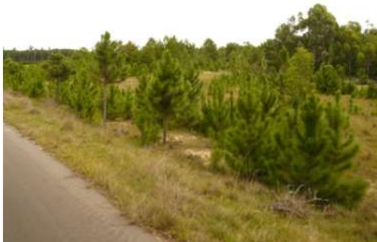
Figura 6 - O caminho . Fotografia. 2008. Por Michelle Salort.

Acreditamos que o sentimento de pertencimento é um fator relevante para que o sujeito sinta-se parte do meio e não fora dele. Pensamos que se sentir parte de um todo maior, que o sujeito constitui e no qual é constituído, possibilita ao ser humano tomar atitudes de cuidado para com o meio e, como consequência, para consigo mesmo.