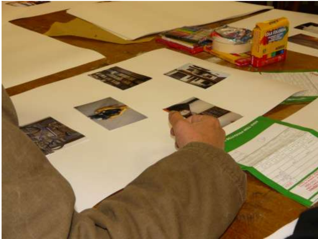
Figura 7 – Ensaio visual 1 , Fotografia, 2009. Por Michelle Salort

atividade para a tarefa primordial de conhecer-se, pois alguns nunca haviam pensado em pertencimento, na relação entre suas memórias e suas identidades.