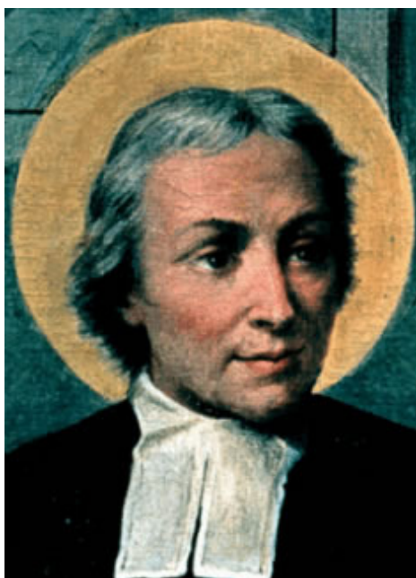
Ilustração de La Salle

João Batista de La Salle (1651-1719) foi sacerdote e educador francês, estudou na Universidade de Reims e, depois, na Sorbonne, de Paris. Terminado seu doutorado em Teologia e ordenado sacerdote, se envolveu na direção de escolas e na formação de professores. Aos vinte e oito anos fundou sua primeira escola e, da França, a atuação e a filosofia Lassalista irradiou-se pelo mundo. Criou uma escola normal para a formação de mestres, o “Seminário dos Mestres Escola” com uma escola elementar anexa a “Congregação dos Irmãos das Escolas Cristãs” promovendo assim a fundação de escolas populares tornando-se numa das iniciativas de maior representação no campo da educação. La Salle contribuiu para o surgimento da “civilização escolarizada”, defendendo a obrigatoriedade do ensino também para a classe