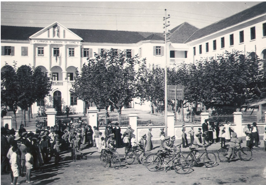
Ilustração do Colégio La Salle Carmo no século XX.

O Colégio Nossa Senhora do Carmo, hoje La Salle Carmo, é uma das instituições mais sólidas de ensino, de mais vasta abrangência e de influência mais marcante em Caxias do Sul e região. Já, transcorreram mais de 100 anos desde que os irmãos Lassalistas aqui chegaram.