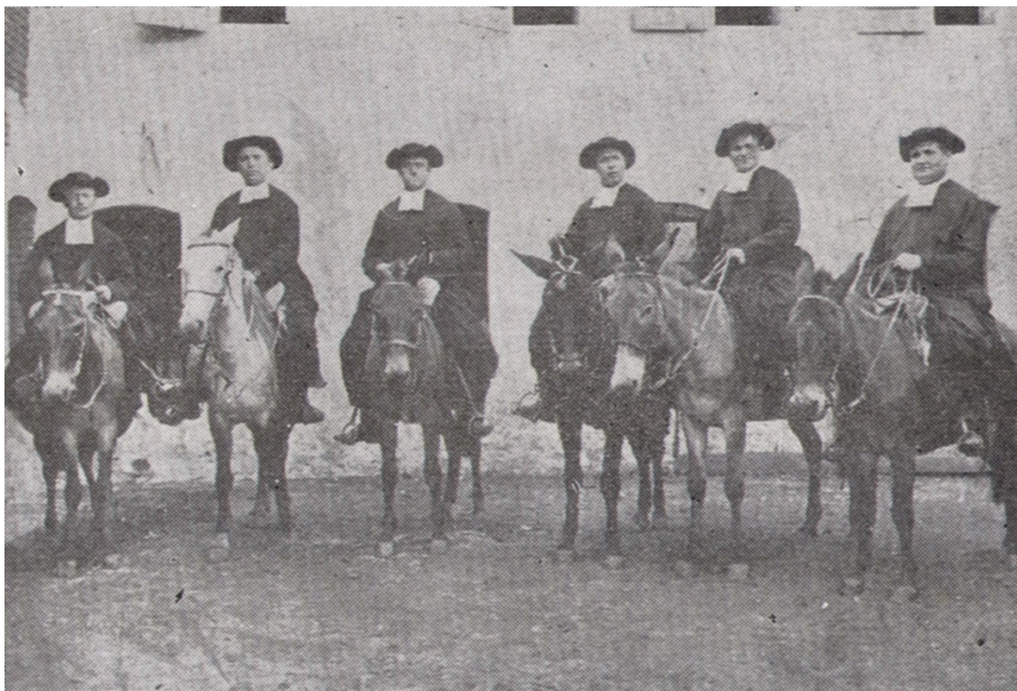
Ilustração forográfica dos primeiros Irmãos Lassalistas em 1908.

A boa representatividade do colégio do Carmo galgou a passos largos, numa época em que a instrução e educação dos filhos era prioridade para as famílias de imigrantes que, assistindo o rápido crescimento da indústria e do comércio, tinham consciência da necessidade de melhor preparo intelectual para os seus.