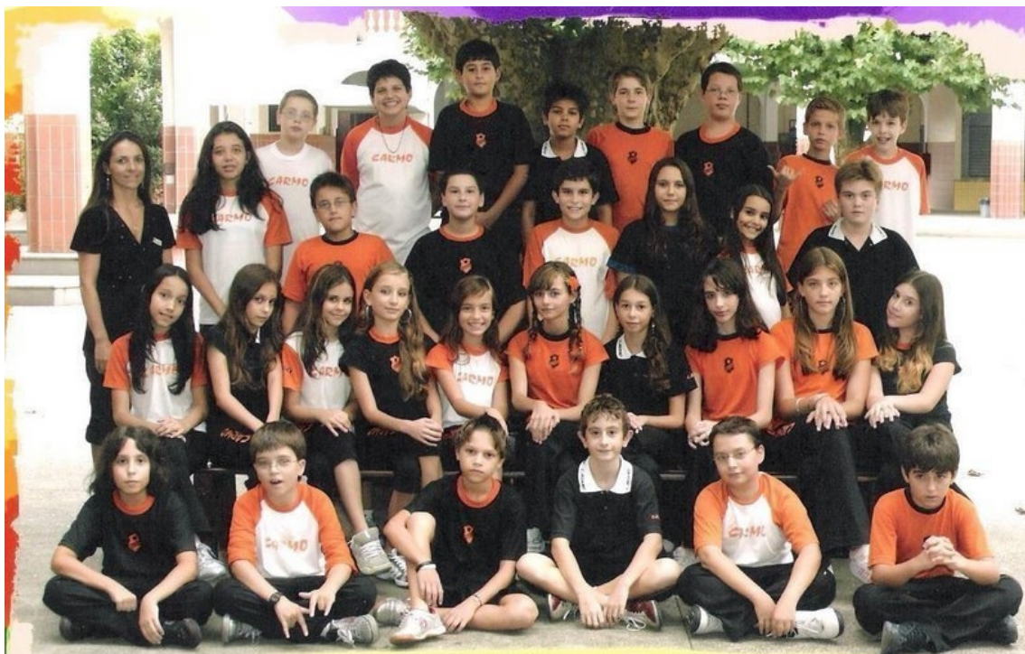
Ilustração fotográfica dos alunos do Carmo de 2006.