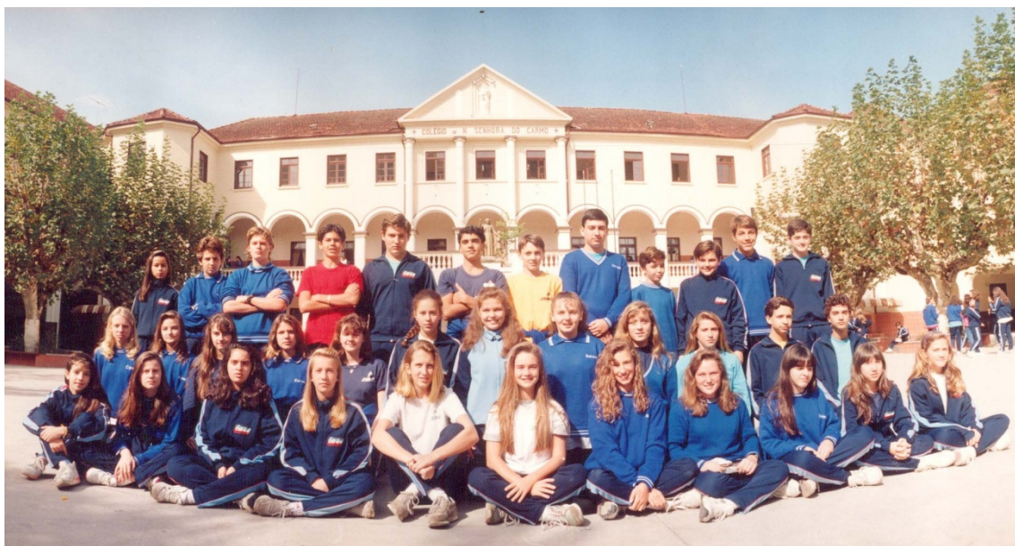
Ilustração fotográfica dos alunos do Carmo de 1992.

Essas ideias podem ser bem ilustradas no cotidiano das escolas onde um único uniforme, uma única cor o marinho, é substituída pelo “uniforme” com múltiplas opções, de cores, formas e materiais, que, na verdade, pouco uniformiza. Os professores por sua vez não são mais os irmãos da congregação, são especialistas graduados nas suas respectivas áreas, leigos, do sexo feminino ou masculino; o mesmo ocorre com os alunos de ambos os sexos que compartilham a sala de aula, de forma mais plural.