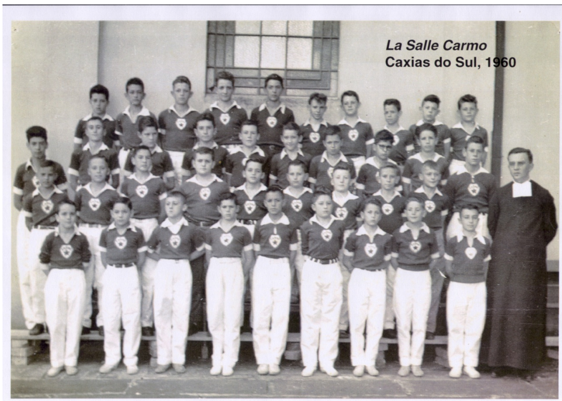
Ilustração fotográfica de 1960.