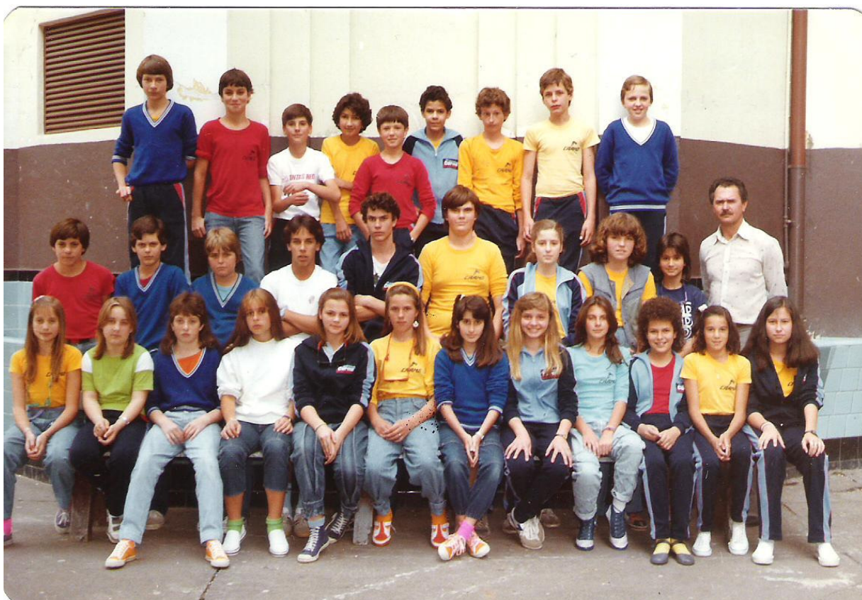
Ilustração fotográfica dos alunos do Carmo de 1985.