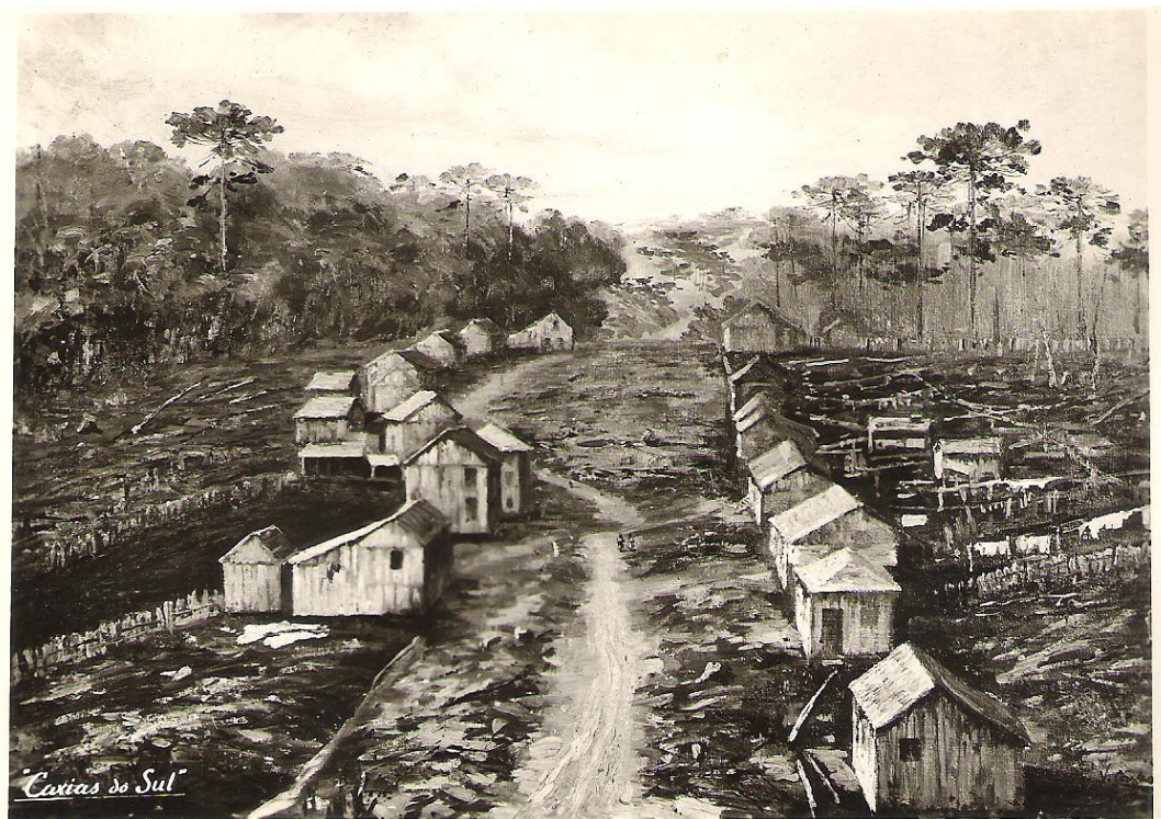
Ilustração de Caxias do Sul 1875.

Esta pintura representa uma paisagem embrionária da cidade de Caxias do Sul. Aparentando ser do século XIX quando os primeiros colonizadores chegaram a aquelas terras. A imagem foi copiada de um postal feito pelo “Studio Geremia”, conhecido estúdio fotográfico da cidade de outros tempos.