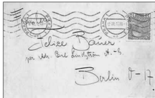
Figura 6 – Carta de Kafka à Felice endereçada ao escritório da Carl Lindström