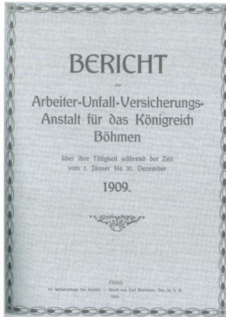
Figura 4 - Capa do relatório à companhia de seguros