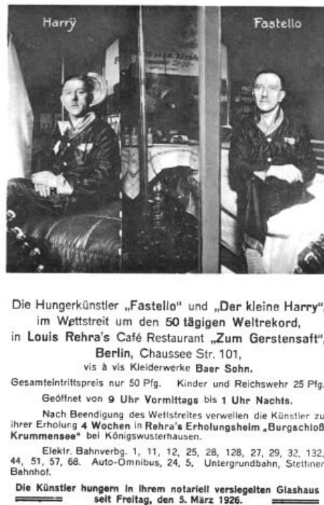
Figura 1 - Cartaz com anúncio de artistas da fome em Berlim em 1926