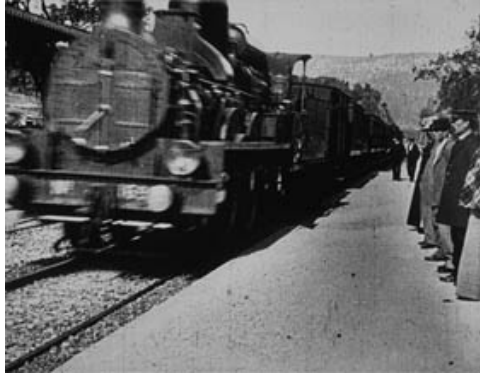
Figura 9 – L'arrivée d'un train en gare de La Ciotat

correndo assustadas em direção ao fundo da sala de apresentações ao ver o trem se aproximando da tela. A ilustração abaixo mostra uma cena da chegada da locomotiva que desaparece na margem, ao contrário do que teriam pensado os espectadores ao julgar que ele sairia da tela e os atropelaria.