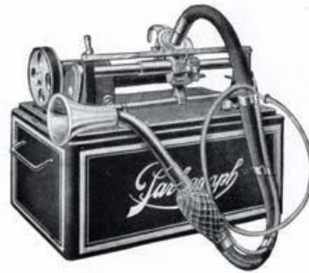
„Diktire in Lindströms Parlograph“ Der Parlograph ist ein Erzeugnis der Carl Lindström A. G.