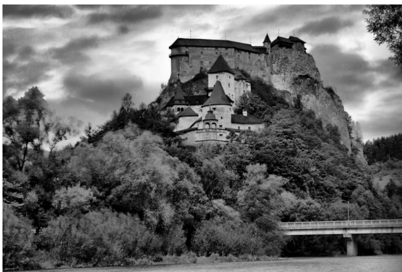
Figura 10 - Oravský hrad, atual Eslováquia (originalmente colorido, editado em preto e branco pelo autor)

Se essa descrição for comparada com a topografia do burgo Oravský hrad é possível perceber certa semelhança. Correspondendo à descrição do romance, o burgo possui na Orava uma extensa construção, um pequeno conjunto de casas de dois andares amontoadas e contornos dentados de um rochedo no horizonte.