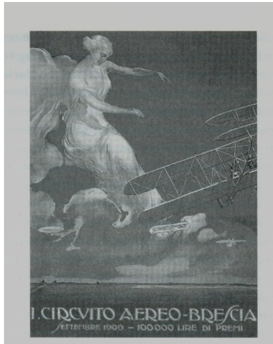
Figura 7 - Cartaz oficial do show aéreo de Bréscia em 1909

aviador tomava ares de um Zaratustra dos novos tempos. A FIG. 5 mostra o cartaz oficial do evento: