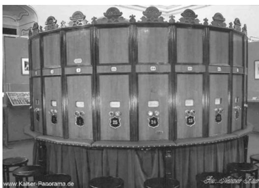
Figura 11 – Kaiserpanorama

O Kaiserpanorama constitui-se de um binóculo por onde se assiste a uma sequência de fotografias estereoscópicas, que, através de um dispositivo binocular, mostram imagens com efeito tridimensional, oferecendo um plano em profundidade. Há uma sucessão de fotos que passam perante os olhos aproximadamente a cada dez segundos. O primeiro aparelho desse tipo foi desenvolvido por Daguerre em 1822 em Paris, em 1838 foi aberto ao público em seu salão e desde então quase não foi alterado (OETTERMANN, 1980, p. 9, tradução nossa). Entre os temas principais do Kaiserpanorama encontram-se paisagens exóticas, países distantes, cidades turísticas. Logo após o desenvolvimento da fotografia o Kaiserpanorama funcionou como forma de divulgação de lugares que, de outra forma, seriam inacessíveis a uma grande maioria da população. Abaixo uma ilustração do dispositivo: