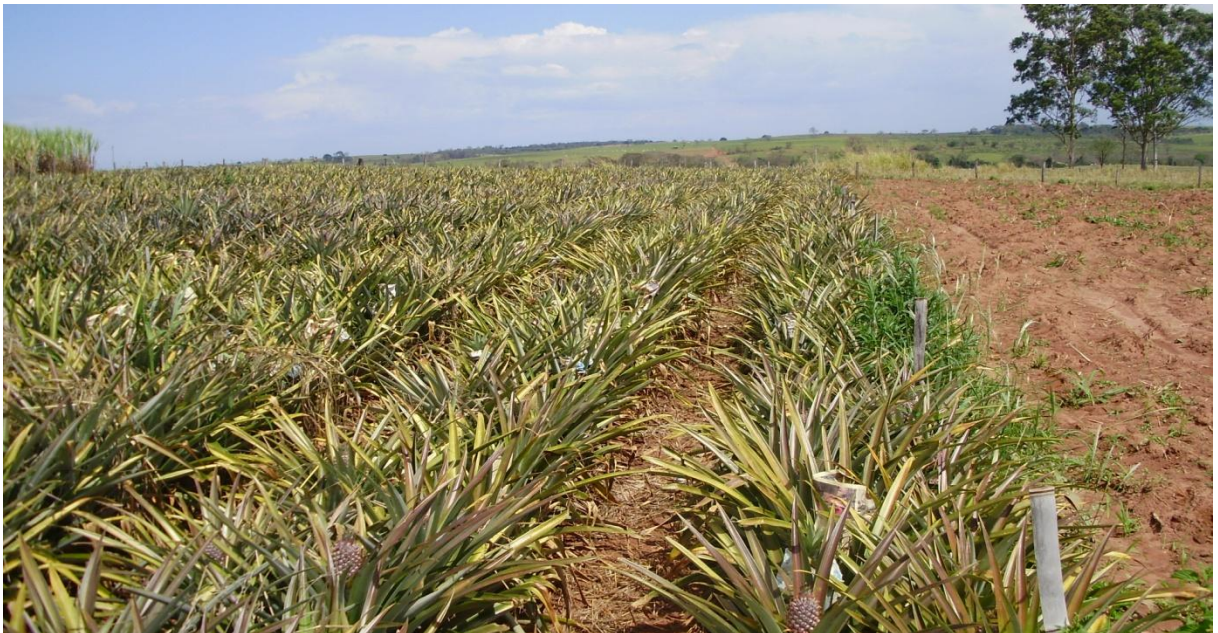
Foto 2 – Área experimental com a cultura do abacaxi no dia (03/09/2009), após a 2ª adubação e 2ª indução floral, mostrando frutos empapelados para a 1ª colheita, e frutos sendo formados para a 2ª colheita. Guaraçá – SP, 2009.