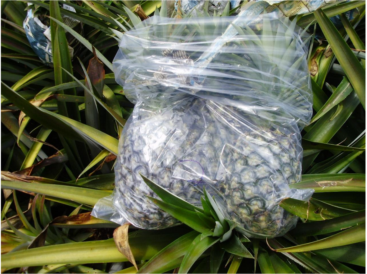
Foto 5 – Frutos colhidos dentro de sacos plásticos previamente identificados com o número da parcela (27/11/2009). Guaraçai – SP, 2009.