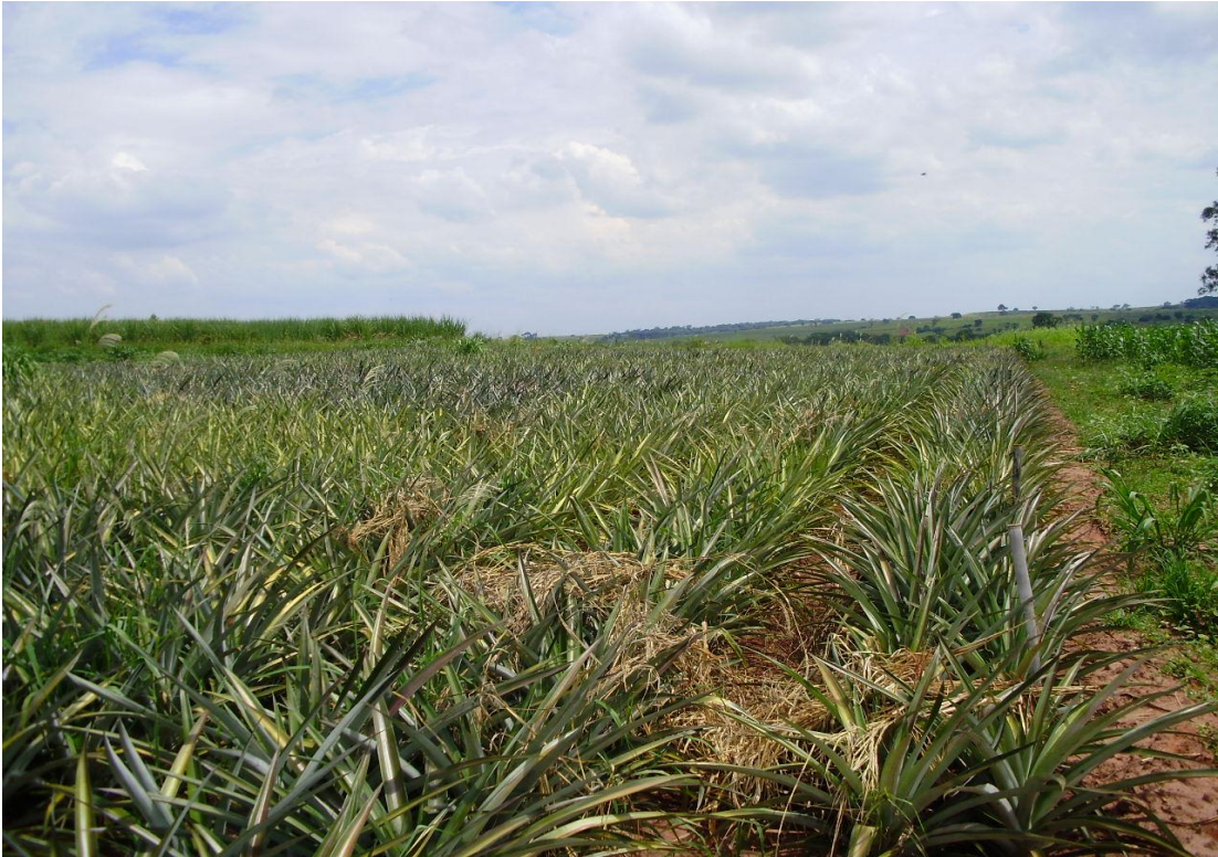
Foto 1 – Área experimental com a cultura do abacaxi com aproximadamente 1 ano de idade, após a 1ª adubação e 1ª indução floral (10/04/2009). Guaraçá – SP, 2009.