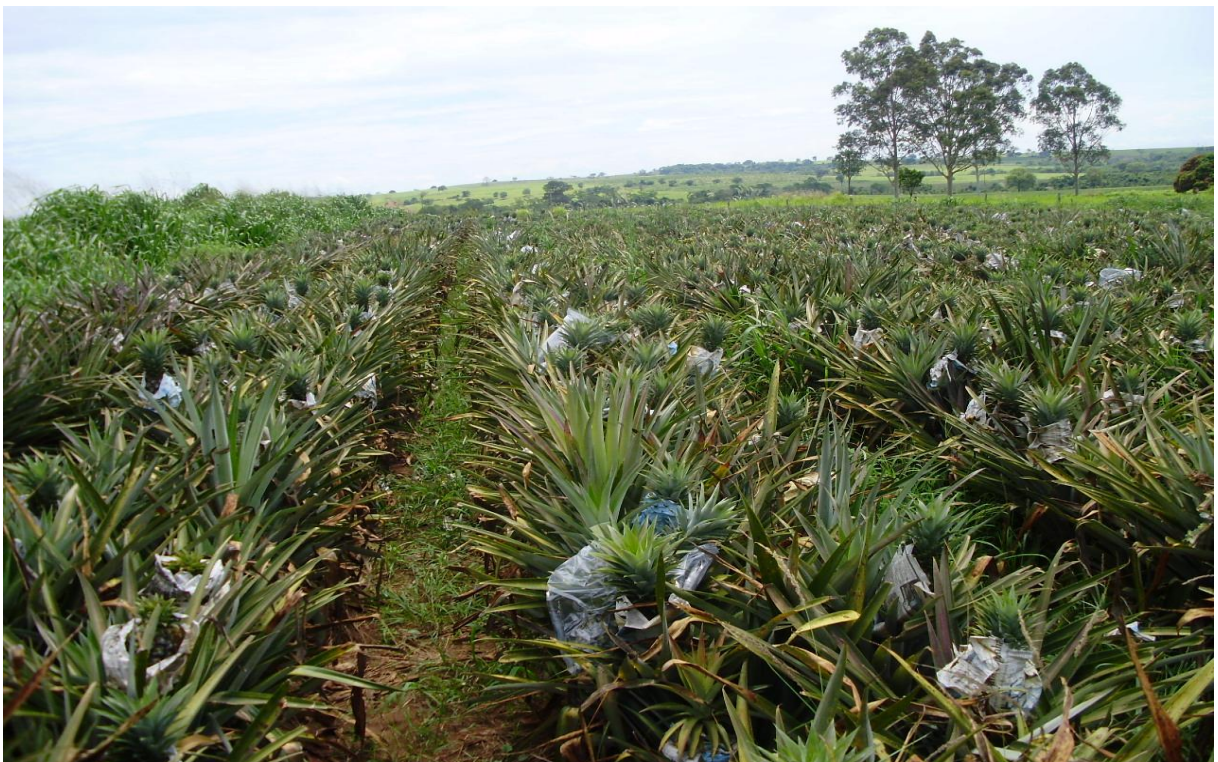
Foto 4 – Área experimental com a cultura do abacaxi no dia da 2ª colheita (27/11/2009), mostrando os frutos colhidos dentro de sacos plásticos. Guaraçá – SP, 2009.