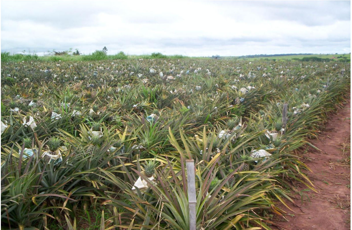
Foto 3 – Área experimental com a cultura do abacaxi no dia (10/11/2009), próximo a 2ª colheita, mostrando a maior quantidade de frutos colhidos nesta época. Guaraçá – SP, 2009.