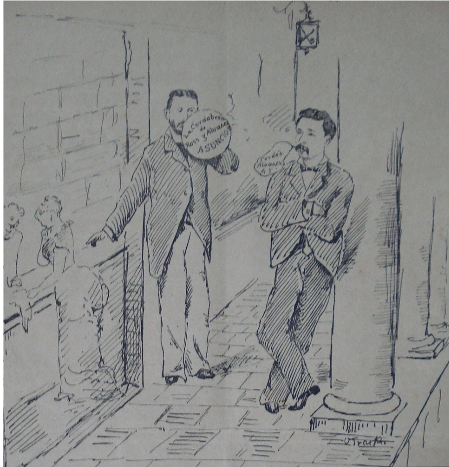
La cordobezza. De Ross y Alvarez

público. Ainda que passasse a maior parte do tempo no lar, não mais se encontravam restritas ao espaço doméstico.