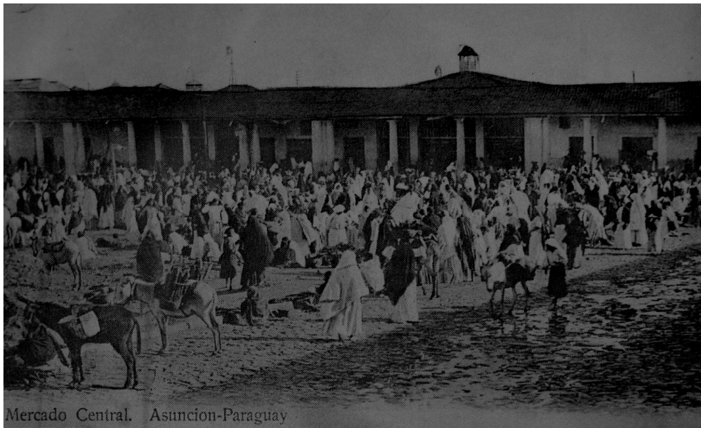
Mercado Central de Asunción, en una vista tomada a comienzos del 900.

MUSEO DEL BARRO. La Guerra del 70. Una visión fotografica. Asunción: Edición Museo del Barro, 1985.