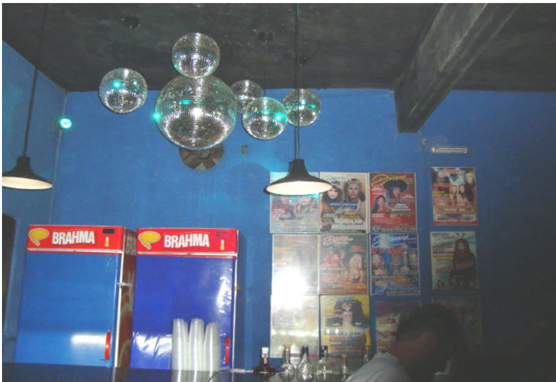
Bar interno da boate Divine, no qual globos prateados e cartazes emoldurados de shows mais antigos fazem parte da decoração.

Ligando o dancing ao ambiente ao ar livre, há um estreito corredor que abriga outras atrações da boate. Fora o fato de ser um lugar de “fricção de corpos” por sua estreiteza, nele se situam portas que dão acesso a um dos banheiros da casa, a uma sala de cine-vídeo pornô e ao dark room . Do lado direito de quem sai do dancing em direção ao outro espaço, encontra-se o bar interno, decorado com globos prateados no teto e os já citados cartazes antigos emoldurados. Esse, que se situa bem próximo ao aludido corredor, é mais iluminado e possui alguns banquinhos, quase nunca vazios.