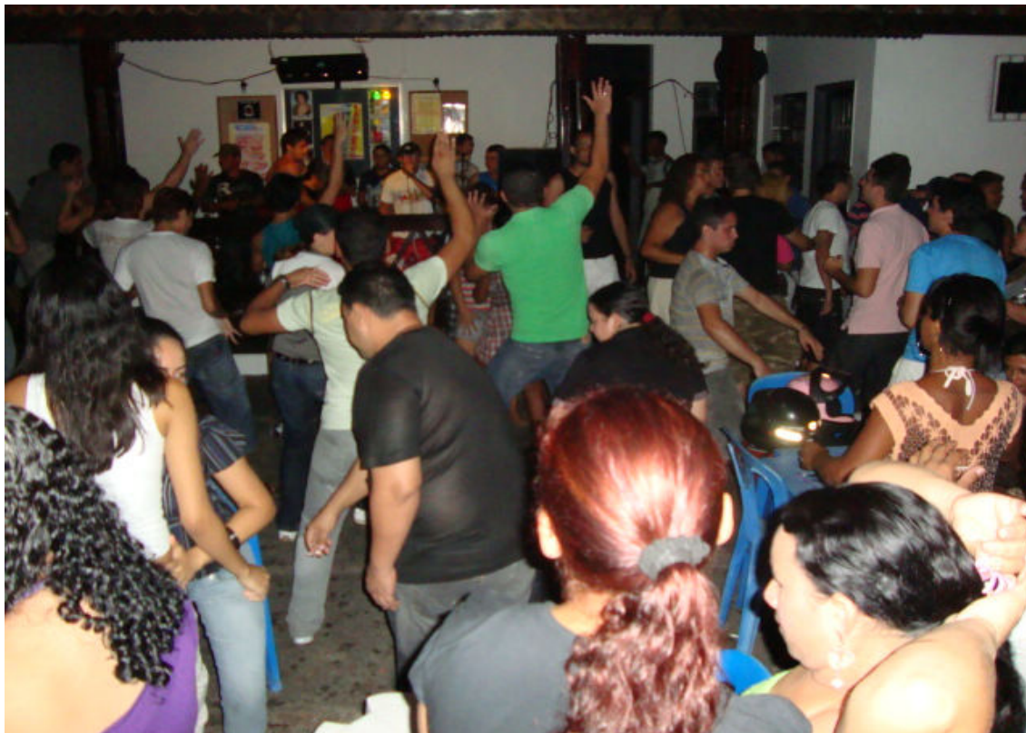
Frequentedores da Divine dançando as músicas de pagode, axé e swingueira no tradicional “Pagodão da Divine”, que acontece todos os domingos.