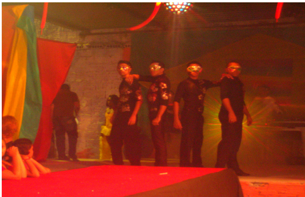
Grupo D'Layser em apresentação no Concurso Miss Gay Granja Portugal 2008.