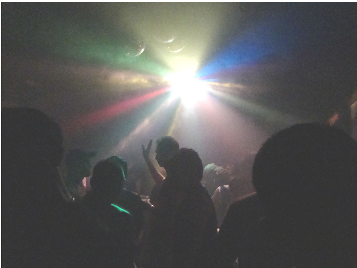
Dancing da boate Divine, domingo, perto de dez da noite, hora na qual muitos frequentadores começam a chegar.