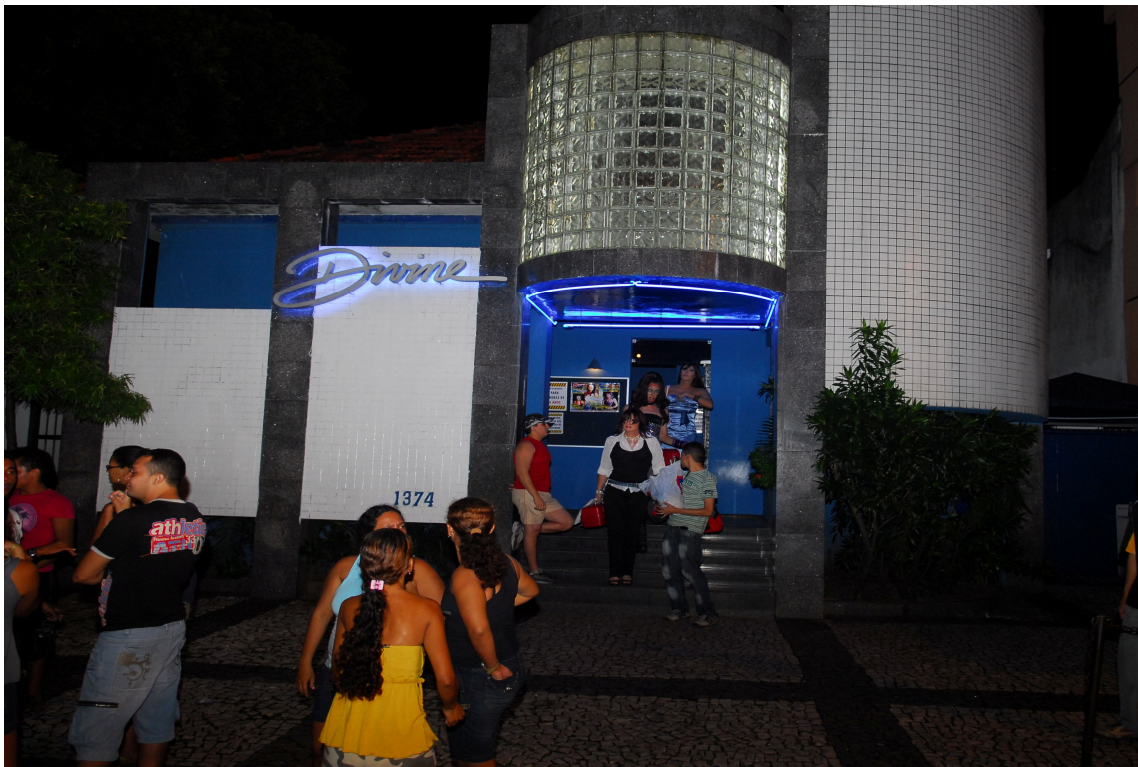
Fachada da boate Divine.