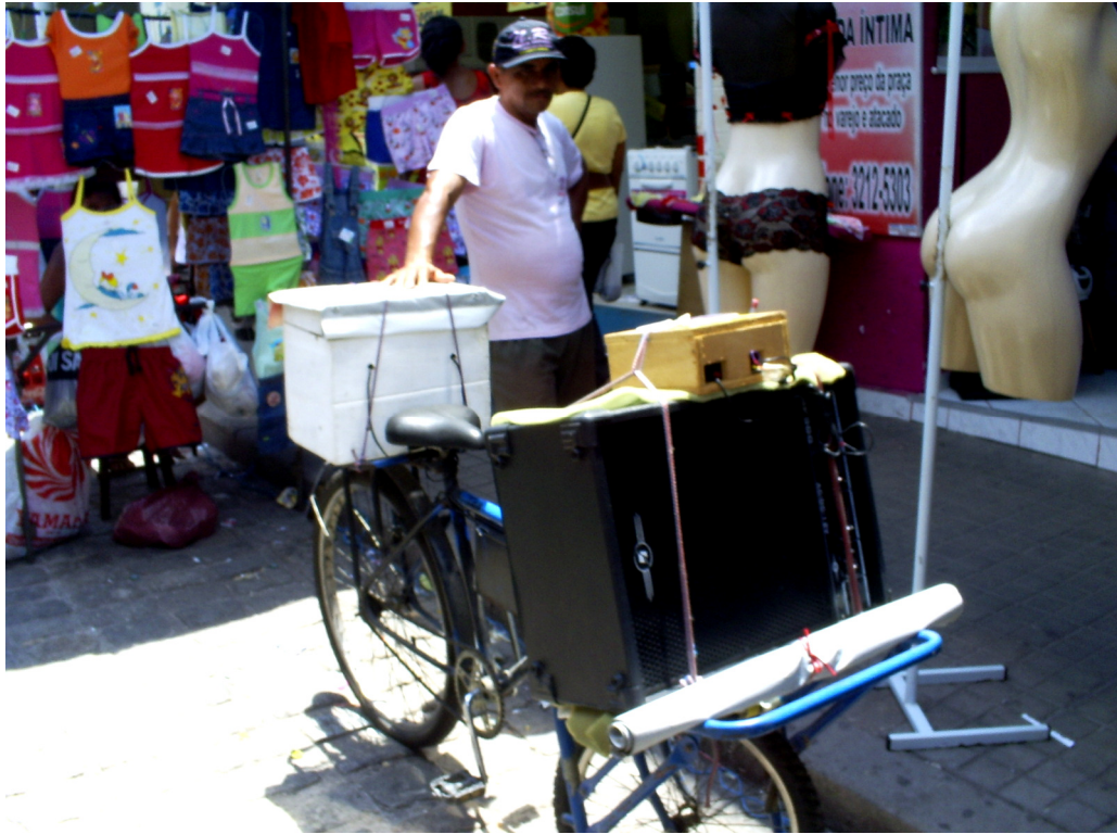
Foto 03: Bicicleta equipada com amplificadores sonoros, Centro Comercial de Belém