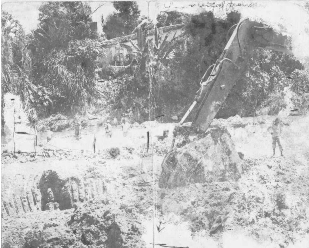
FIGURA 3: Umas das primeiras casas construídas na Vila São Paulo (ao fundo) e uma máquina de extração de areia.