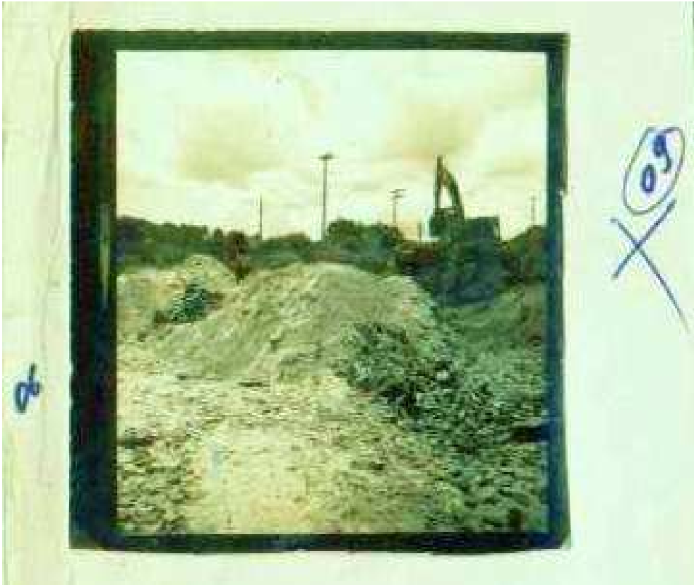
FIGURA 4: Local de extração de areia.