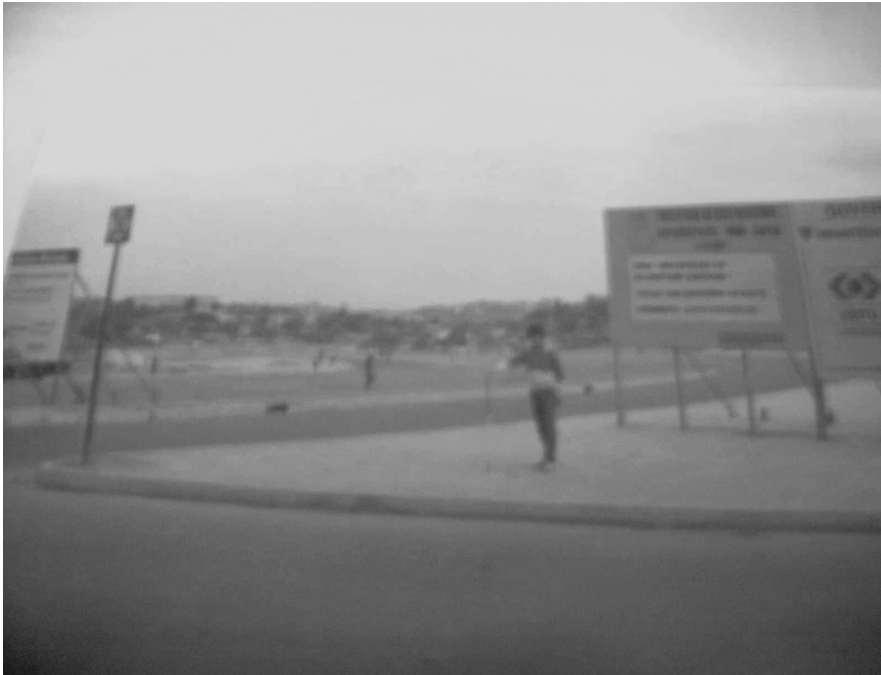
FIGURA 11: Foto da Avenida Cristiano Machado em 1984.

O relato de uma das entrevistadas, quase que por si só, resgata aquele momento tenso e intenso pelo qual provavelmente a Vila São Miguel e várias outras vilas e favelas de Belo Horizonte passaram para se fundar. A entrevistada, que já havia morado em uma outra ocupação chamada popularmente de Beira Linha (local onde hoje está localizada a estação de Metrô São Gabriel), relata assim sua experiência: