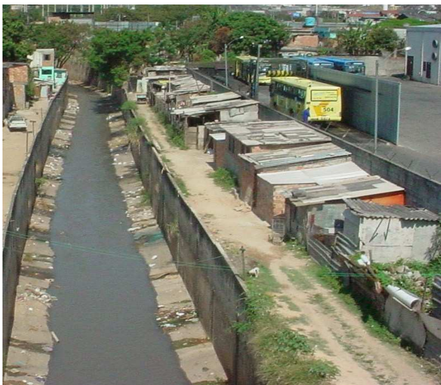
FIGURA 6: Foto da Vila São Paulo cortada ao meio pelo córrego Cachoeirinha em 2005. Fonte: DVRS/URBEL/PBH. Acessado em maio de 2010.

[...] falta de pavimentação da área, o fato de vários moradores não saberem o nome dos becos, a estrutura das residências e a falta, em vários trechos, até das precárias redes de esgoto. O nível de informalidade é quase total no que diz respeito aos serviços básicos, sendo também inviável o serviço dos correios no local (p.11-12).