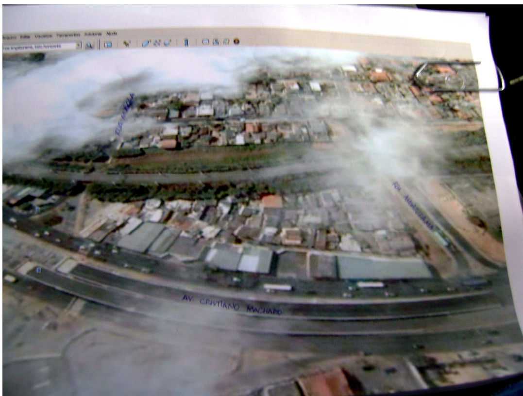
FIGURA 15: Foto aérea do restante da Vila Carioca depois das remoções pelo Projeto Linha Verde (sem data).