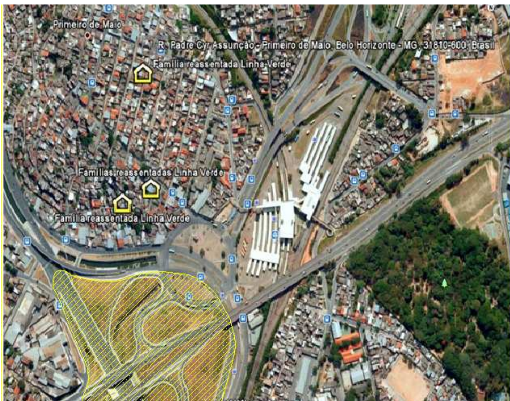
FIGURA 18 - Localização das famílias entrevistadas residentes no bairro Primeiro de Maio, Belo Horizonte-MG.