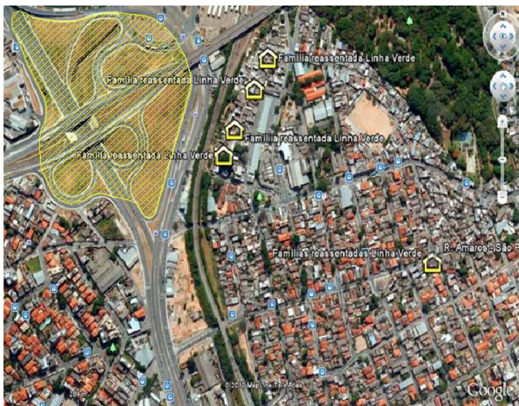
FIGURA 17 - Localização das famílias entrevistadas residentes no bairro São Paulo, Belo Horizonte – MG.

Abaixo seguem duas figuras que ilustram e visualizam as escolhas feitas. Através da visualização projetada pelo programa Google Earth, é nítida a pequena distância entre o local (áreas hachuradas) onde se localizavam as três vilas removidas totalmente - Vila São Paulo, Vila Vietnã e Vila Maria Virgínia - e as atuais residências das entrevistadas. Ressalta-se que o local é um emaranhado de vias (Avenida Cristiano Machado com Anel Rodoviário) que se cruzam e se interpõem, não existindo, à época da foto aérea, nenhum rastro de vegetação no espaço que sobrou.