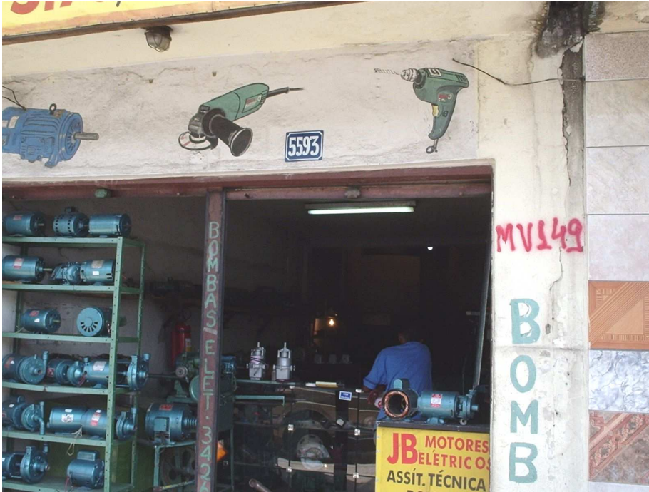
FIGURA 9: Comércio de motores elétricos na Vila Maria Virgínia de frente à Avenida Cristiano Machado em 2005.