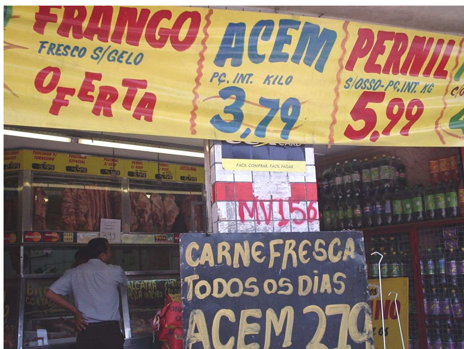
FIGURA 8: Comércio na Vila Maria Virgínia de frente à Avenida Cristiano Machado em 2005. A sigla MV156 é o que identifica a qual vila pertence, e o número corresponde a uma contagem sequencial.

Na Vila Maria Virgínia havia, em 2005 116 , na época da entrada do Projeto Linha Verde, 233 imóveis, sendo 191 deles identificados como domicílios, com uma população residente de 601 pessoas (média de 3,15 habitantes por domicílio). Os 42 imóveis restantes foram identificados como de uso comercial e de serviços, evidenciando um significativo aproveitamento do espaço físico da vila para fins comerciais, o que resulta em valorização da área para a população moradora da vila e do seu entorno. Seguem abaixo fotos que ilustram a ocupação do espaço de parte da Vila Maria Virgínia (parte que dava frente para a Avenida Cristiano Machado) por diversos tipos de comércio. (Figuras 8, 9 e 10).