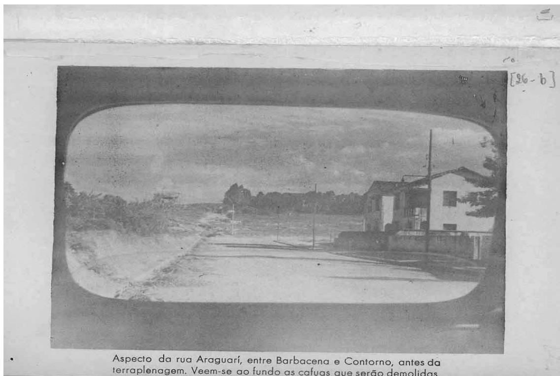
FIGURA 1: Vista da rua Araguari em 1948

Para efeito do que se objetiva identificar na leitura dos relatórios - perceber a posição oficial do poder público no tocante aos processos de remoção 78 de população em virtude de grandes obras no espaço urbano de Belo Horizonte -, a construção do Túnel da Lagoinha (estudos para a viabilização dessa obra começam em 1949) e da barragem Santa Lúcia são exemplos marcantes. Para a realização de ambas as obras, não só remoções foram necessárias, como também vários decretos foram editados para que terrenos fossem desapropriados no intuito de desobstruir os locais para a construção. Durante a década de 1950, mais precisamente em 1955, é importante registrar a criação do Departamento Municipal de Habitações e Bairros Populares (DMHBP) - ou DBP, como ficou mais conhecido -, que passa a ser, além de um órgão encarregado do desfavelamento da cidade, a materialização, por parte do poder público, de estruturas