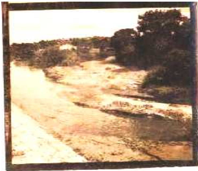
FIGURA 5: Córrego Cachoeirinha na década de 1960.