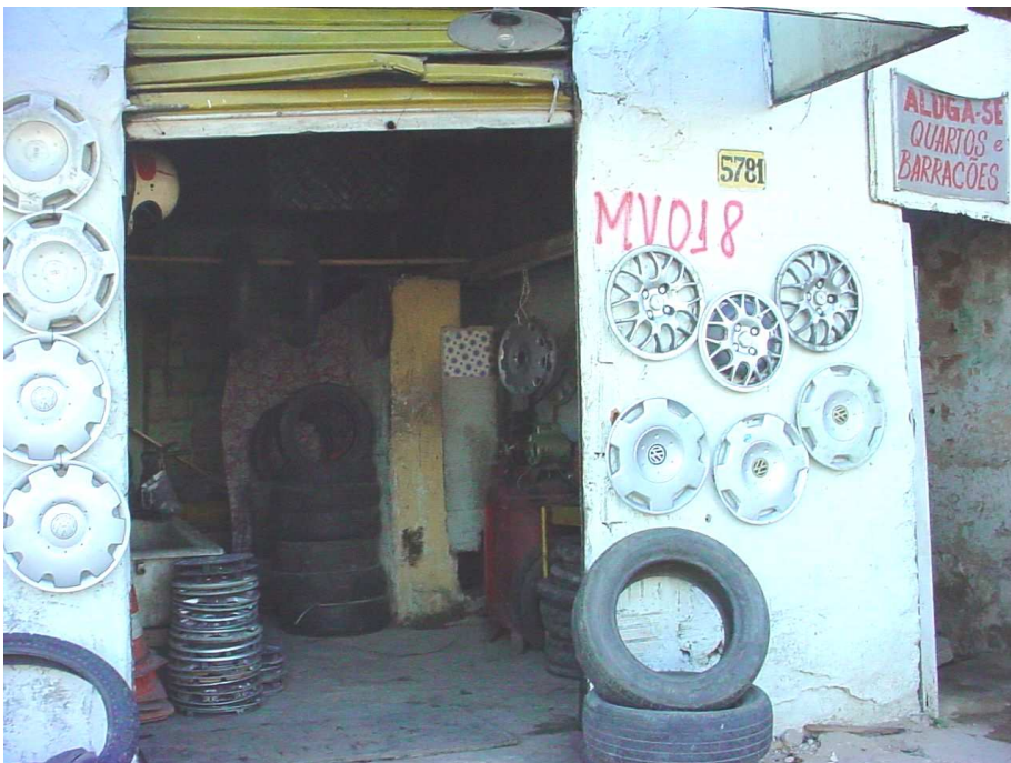
FIGURA 10: Comércio de acessórios para veículos na Vila Maria Virgínia de frente à Avenida Cristiano Machado em 2005.