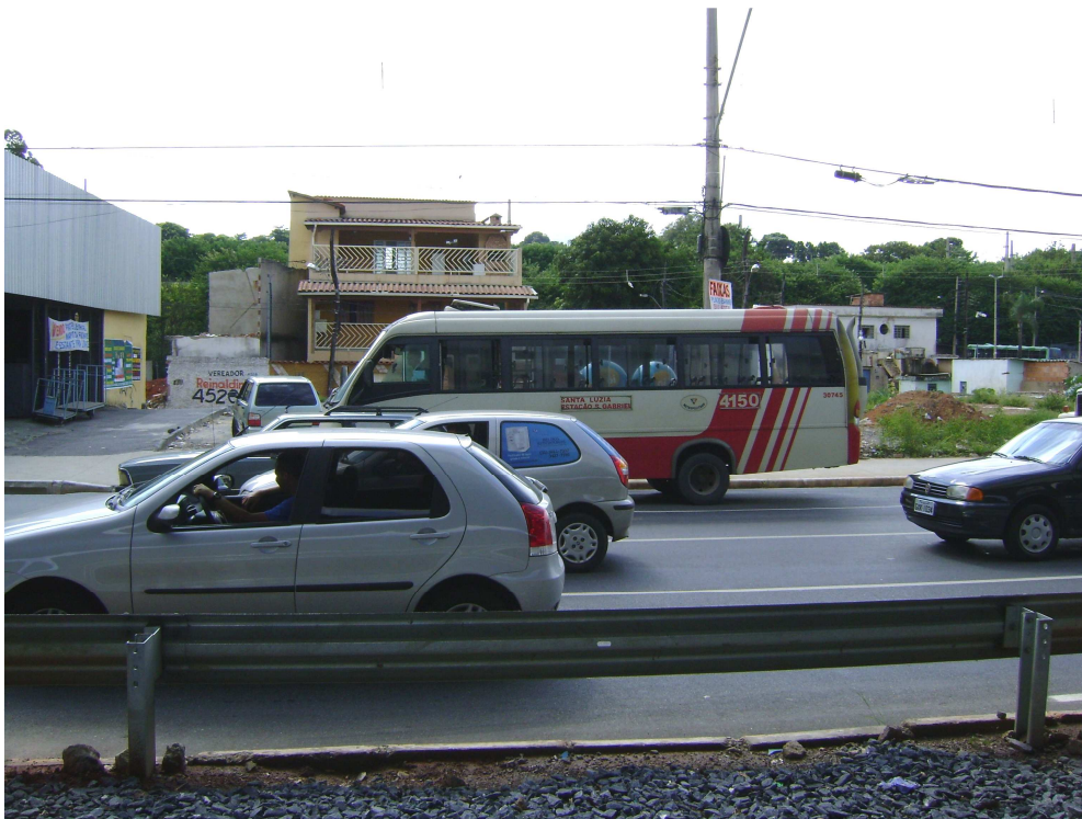
FIGURA 16: Vista parcial da Vila Carioca após o término do Projeto Linha Verde. Esses imóveis foram removidos depois de 2007 por pressões da comunidade em função das constantes inundações da área (sem data).