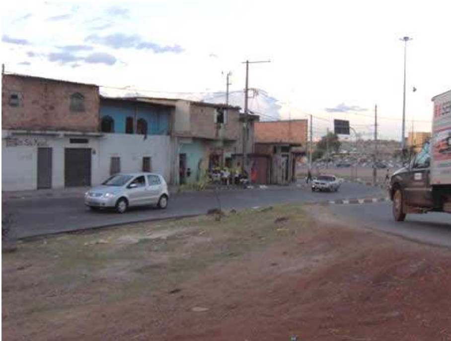
FIGURA 14: Foto do encontro entre os dois retornos de entrada e de saída para a Avenida Cristiano Machado e Anel Rodoviário, em frente à Vila São Miguel/Vietnã.