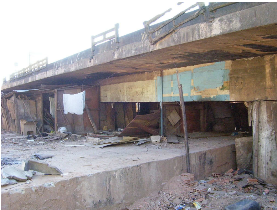
FIGURA 7: Foto de moradias localizadas debaixo do viaduto da BR-262 em processo de desocupação. Essa parte do viaduto ficava localizada dentro da Vila São Paulo.