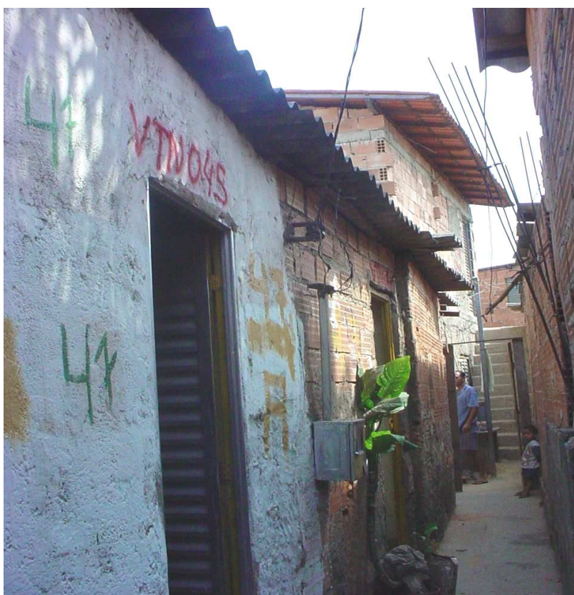
FIGURA 12: Foto de um dos becos da Vila São Miguel/Vietnã em 2006. Fonte: DVRS/URBEL/PBH. Acessado em maio de 2010.

A foto a seguir (Fig.12) demonstra que a tentativa de se preservarem espaços internos prevendo a construção e consolidação de ruas foi frustrada frente à demanda por mais espaços de moradia.