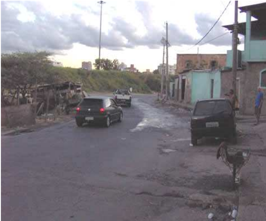
FIGURA 13: Foto da via usada como retorno para veículos que acessavam uma das pistas do Anel Rodoviário (sentido BH-Vitória). Bem ao lado da via está a Vila São Miguel/Vietnã. (sem data)

Fonte: site: www.favelaeissoai.com.br . Acessado em abril de 2010.