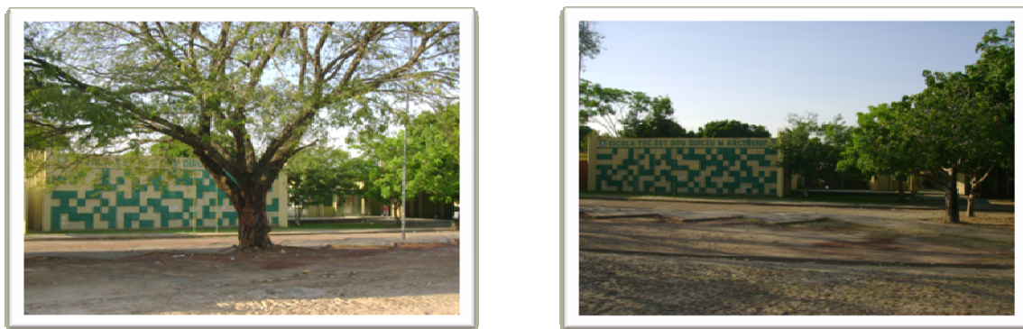
Figura 02 (A e B): Centro de Educação Profissional de Tempo Integral Governador Dirceu Mendes Arcoverde.

Fundado em março de 1978, o Centro de Educação Profissional de Tempo Integral Governador Dirceu Mendes Arcoverde fica localizado na Rua Valdemar Martins nº 3360. A escola funciona nos três turnos e possui um total de 1455 alunos. Trabalham na escola um total de 66 professores de diversas áreas de ensino sendo que 7 são de Língua Portuguesa.