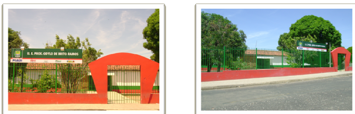
Figura 04 (A e B): Unidade Escolar Professor Odylo de Brito Ramos

Fundada em 29 de março de 1978, a Unidade Escolar Professor Odylo de Brito Ramos fica localizada na Av. Gibraltar s/n – Dirceu I – zona Sudeste. A escola funciona nos três turnos e possui um total de 1350 alunos. Trabalham na escola um total de 70 professores de diversas áreas de ensino sendo que 8 são de Língua Portuguesa.