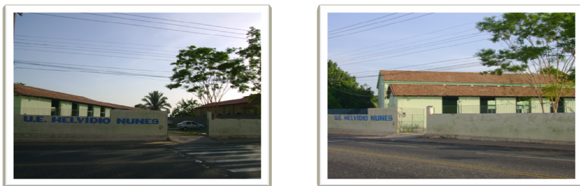
Figura 03 (A e B): Unidade Escolar Helvídio Nunes

Fundada em 29 de março de 1978, a Unidade Escolar Professor Odylo de Brito Ramos fica localizada na Av. Gibraltar s/n – Dirceu I – zona Sudeste. A escola funciona nos três turnos e possui um total de 1350 alunos. Trabalham na escola um total de 70 professores de diversas áreas de ensino sendo que 8 são de Língua Portuguesa.