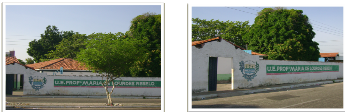
Figura 01 (A e B): Unidade Escolar Professora Maria de Lourdes Rebêlo.

Fundado em março de 1978, o Centro de Educação Profissional de Tempo Integral Governador Dirceu Mendes Arcoverde fica localizado na Rua Valdemar Martins nº 3360. A escola funciona nos três turnos e possui um total de 1455 alunos. Trabalham na escola um total de 66 professores de diversas áreas de ensino sendo que 7 são de Língua Portuguesa.