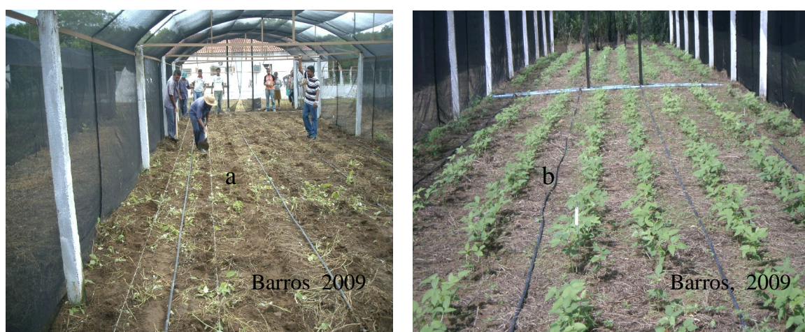
Figura 1 - Avanço de geração em telado1 (a) telado 2 (b)

cruzamentos C_1 e C_2 , as gerações F_1 , F_2 e os retrocruzamentos RC_1 e RC_2 foram conduzidos por Sousa (2008). Com o objetivo de realizar a multiplicação das sementes e avançar uma geração para que ocorresse a segregação para inflorescência composta em todas as progênes resultantes dos RC, conduziu-se um ensaio em condições de telado (Figura 1). Utilizaram-se dois telados com área de 200m^2 cada, revestidos com sombrite (35% de sombreamento). De cada RC foram semeados, no mês de fevereiro de 2008, 112 progênes. Nessa etapa, não foi utilizado delineamento, sendo que os genótipos foram distribuídos em fileira de 2,5m, utilizando espaçamento de 0,50m entre fileira e 0,25m entre plantas com 10 cavos por fileira.