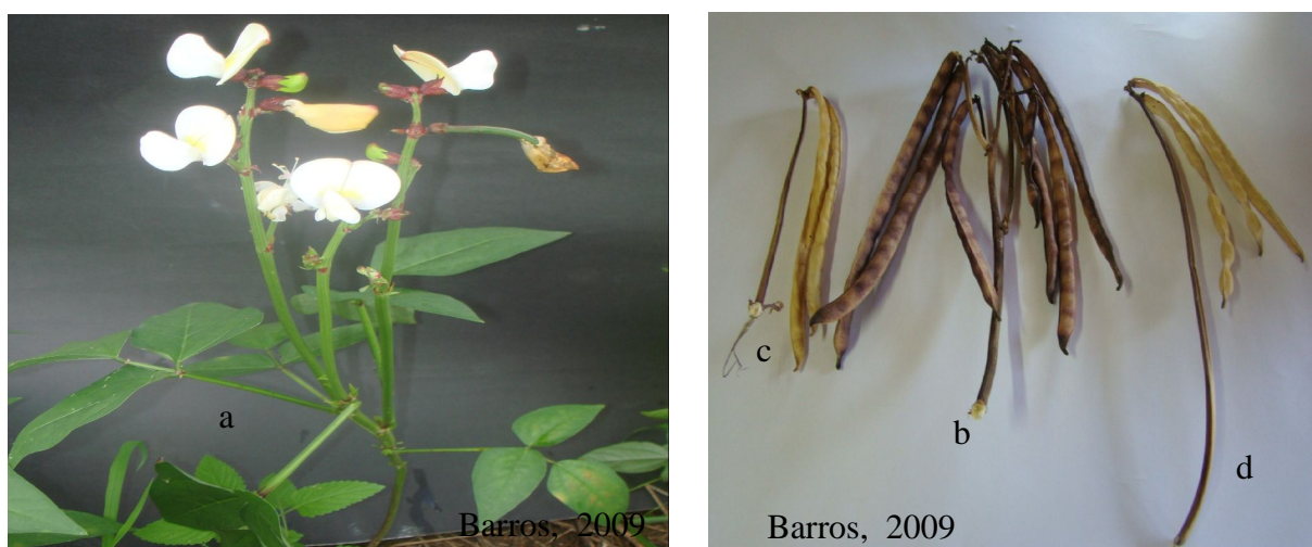
Figura 3 – Detalhe da planta com inflorescência composta (a); pedúnculo simples (c) e (d); e pedúnculo composto (b).

O IG apresentou BLUP significativos e positivos para a maioria das progênes nos dois retrocruzamentos. Entre as progênes com BLUP(+), 33,33% no RC 1 e 50% no RC 2 possui inflorescência do tipo composta. Teixeira et al. ,(2007) obteve uma média geral de 72,14% para o índice grão em feijão-caupi, no presente estudo todos os genótipos com BLUP(+) estão dentro desta média, pois estes são superior a medias dos parentais nos dois retrocruzamentos.