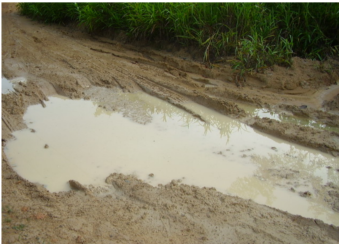
Trecho de vicinal de acesso ao lote da Família Banana. (Mai/2009)