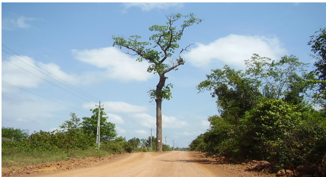
Km 06 - Ramal do Pau Rosa – Limite demarcatório de acesso ao Projeto de Assentamento Tarumã-Mirim. (Set/2008)