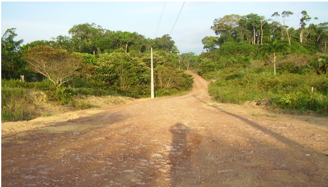
Vicinal de acesso ao lote da Família Açaf. (Set/2008)