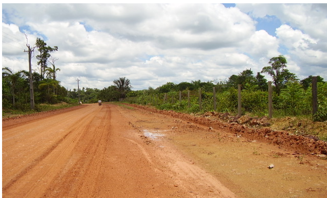
Ramal do Pau Rosa – Trecho nivelado para receber pavimentação que dá acesso ao lote da Família Pé-de-Moleque. (Out/2008)