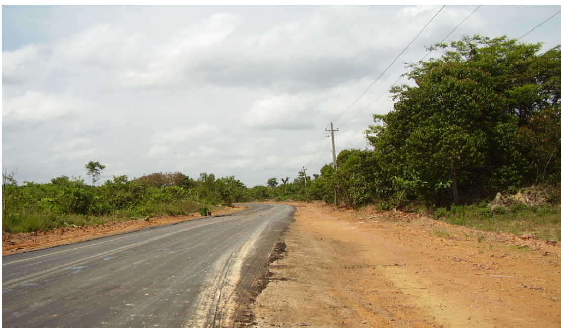
Trecho pavimentado do Ramal do Pau Rosa que dá acesso ao lote da Família Laranja. (Set/2008)