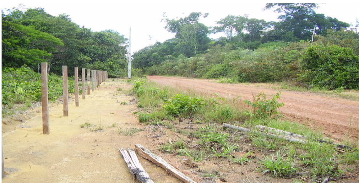
Trecho inicial da vicinal que dá acesso ao lote da Família Hortaliça. (Out/2008)