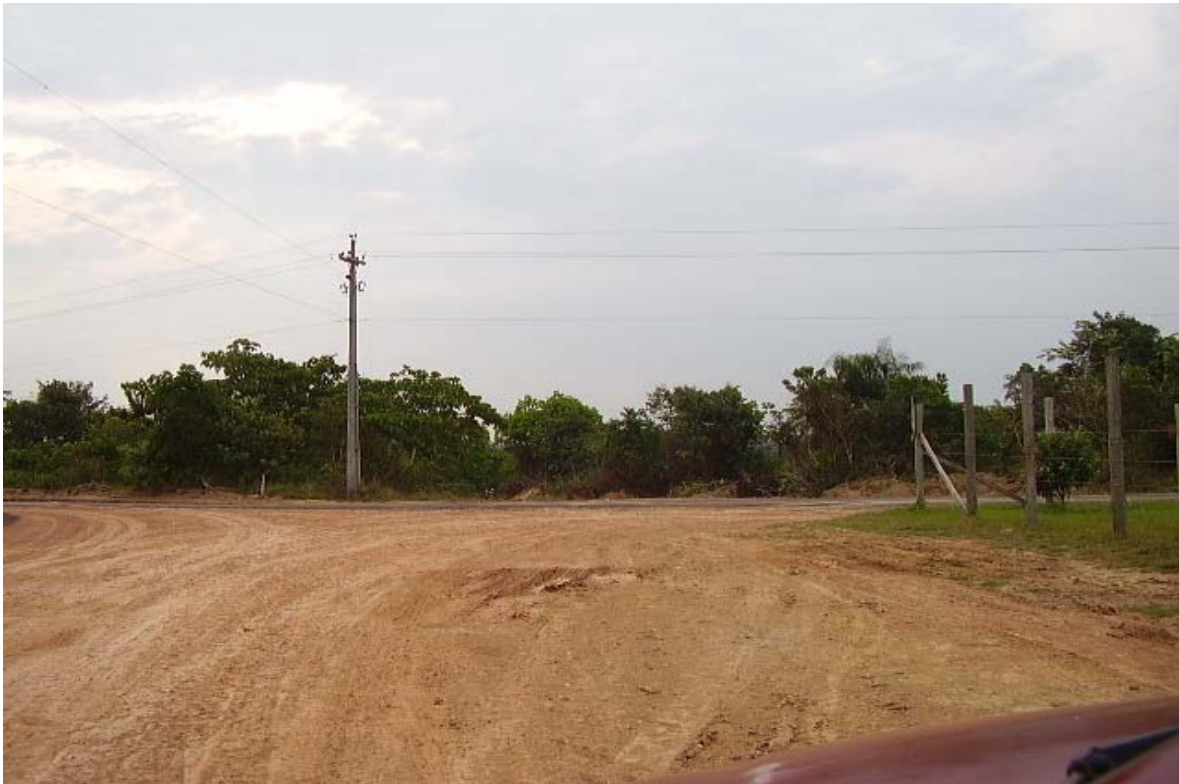
Saída da vicinal que dá acesso ao lote da Família Farinha. (Set/2008)