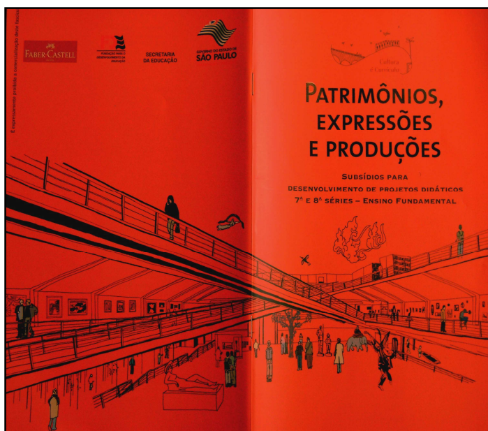
Figura 2 – Capa do Fascículo: Patrimônio, Expressões e Produções