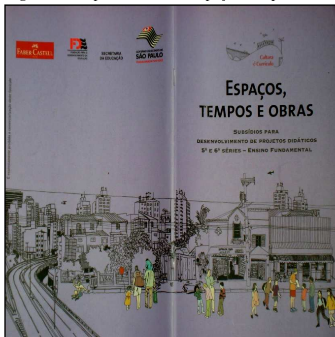
Figura 1 – Capa do fascículo Espaços, tempos e obras