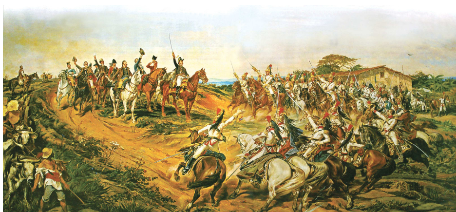
Figura 6 – Quadro Independência ou Morte , de Pedro Américo, 1888.