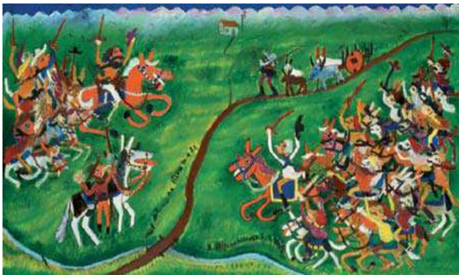
Figura 5 – Ilustração de um aluno