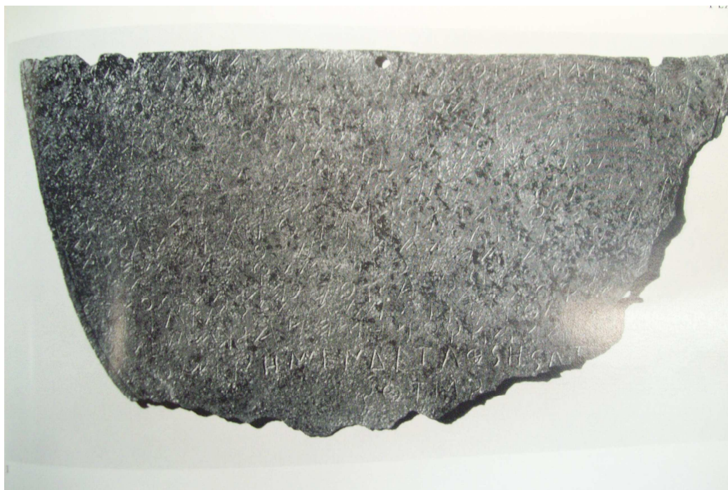
Figura 2: Foto do lado A da Mitra de bronze retirada da obra de Raubitschek (1972).

legal, isenção de impostos. A inscrição ainda apresenta o caráter hereditário, tanto das funções como das benesses atreladas a estas. Institui-se que, onde o kosmos estiver, Spensiteos deve ir e, quando necessário, substituí-lo. O mesmo ocorre em relação aos sacerdotes em funções públicas.