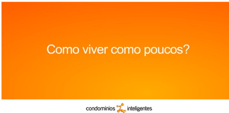
Figura 24: Floripa Loft Cacupé

Convém salientar que tal empreendimento integra o portfólio dos Condomínios Inteligentes 81 , constituídos por casas dotadas de alta tecnologia e uma publicidade que destaca o “viver como poucos”, visto acima e abaixo. Esses anúncios publicitários não se restringem à internet: espalham-se pela cidade através de imensos out-doors , alguns exclusivamente em inglês.