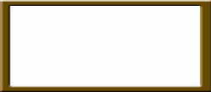
Figura 0: Moldura

Você sabe melhor do que ninguém, sábio Kublai, que jamais se deve confundir uma cidade com o discurso que a descreve. Contudo, existe uma ligação entre eles.