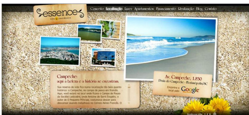
Figura 10: Essence Life Residence – localização do condomínio Disponível em: http://www.essencecampeche.com.br . Acesso em 17/03/2009.

A memória estaria ocupando o espaço deixado pelo medo do futuro, “a cultura da memória preenche uma função importante nas transformações atuais da experiência temporal, no rastro do impacto da nova mídia na percepção e na sensibilidade humanas” (Ibid., p. 25, 26). Sobretudo memórias por meio de imagens, pois estas parecem ter a capacidade de reter e perpetuar o tempo, de trazer de volta a outra temporalidade. A imagem fotográfica tem essa pretensão, “não importando qual seja o objeto da representação, a questão recorrente é o aspecto (consciente ou inconsciente) da captura do tempo, ou da preservação da memória” (KOSSOY, 2007, p. 132). Na imagem abaixo o passado é apresentado explicitamente como parte do produto: