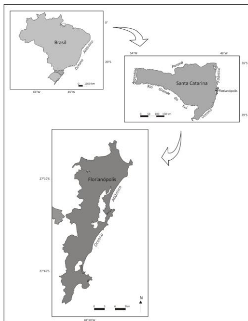
Figura 11: Mapa de localização de Florianópolis Organizado por Tiago Gonçalves.

Capital de Santa Catarina, estado ao sul do Brasil, o município de Florianópolis soma área total de 436,5 km 2 , dividido entre ilha, com 424,4 km 2 e continente, com 12,1 km 2 . 28 Em 2007 a população catarinense era estimada em 5.866.252 habitantes dos quais 396.723 residentes em Florianópolis. 29