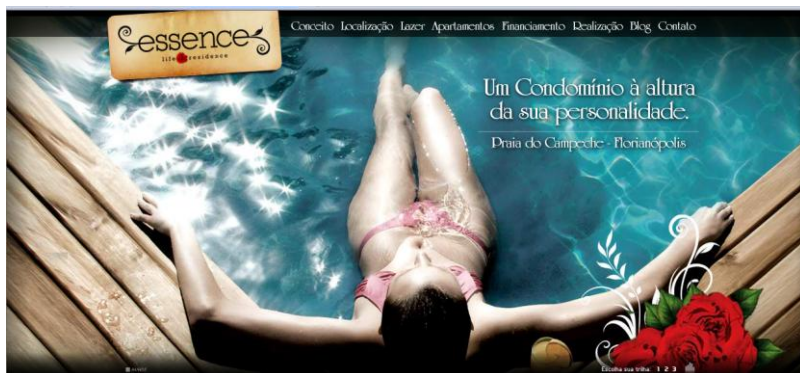
Figura 16: Essence Life Residence – personalidade

Como se vê nas imagens abaixo, procura-se identificar ou atrelar os futuros moradores a uma vida de lazer na qual há tempo para fazer o que se gosta, buscando relacionar a personalidade dos futuros compradores ao que é possibilitado pelo condomínio. O lazer, o tempo livre, que nesses casos são expressos pela piscina e pelo violão, pode ser interpretado como parte da essência ou da personalidade das pessoas que irão morar lá, pois o não é à toa que o nome do condomínio é “Essence Life Residence”. Há aqui um apelo para o essencial do ser humano, e o essencial passa a relacionar-se ao local onde a pessoa reside.