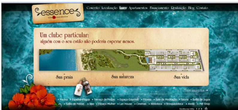
Figura 6: Essence Life Residence, um clube particular.

O city marketing de Florianópolis evoca um estilo de vida e formas próprias de viver nesta cidade, passando a mensagem de que em Florianópolis se vive melhor do que em outros lugares. Com base em uma leitura parcial da cidade, reinventam seus conteúdos e divulgam um cenário sedutor. A publicidade imobiliária não deixa a desejar, apropriando-se dos elementos do marketing e focando a individualidade, ou melhor, a originalidade de quem vive em Florianópolis, pois isso proporciona um estilo de vida diferenciado da maioria da população: