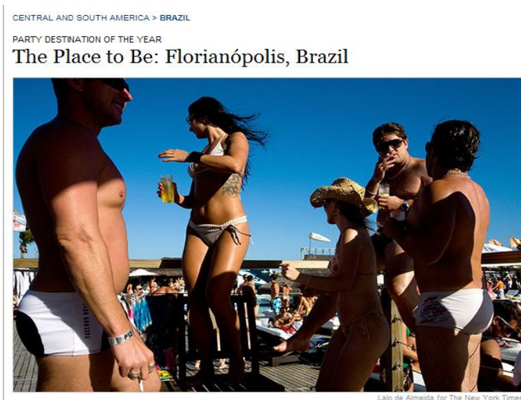
Figura 3: The Place to Be: Florianópolis, Brazil

ria divulgada no New York Times que elenca Florianópolis entre os 44 lugares do mundo para visitar em 2009: