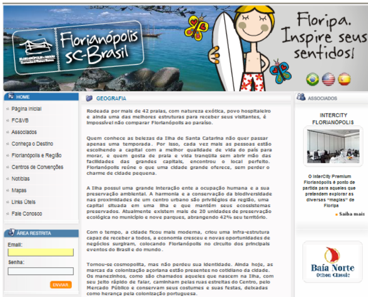
Figura 9: Geografia

sismo e projeções futuras. A divulgação da cidade dirige seu foco para esses tempos ausentes: