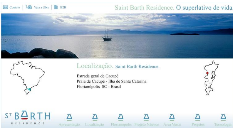
Figura 22: Saint Barth Residence – localização

Disponível em: http://www.stbarthresidence.com.br . Acesso em: 20/08/2008.