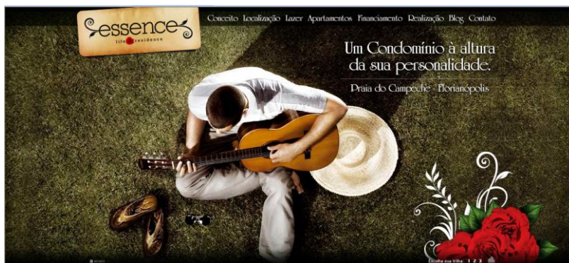
Figura 17: Essence Life Residence – personalidade

A imagem de Florianópolis apresenta e propõe um estilo de vida diferenciado, que inclui a relação com o ambiente natural ainda pre-