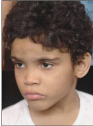
Figura 2. Foto do paciente 23 com diagnóstico de Síndrome do Álcool Fetal.