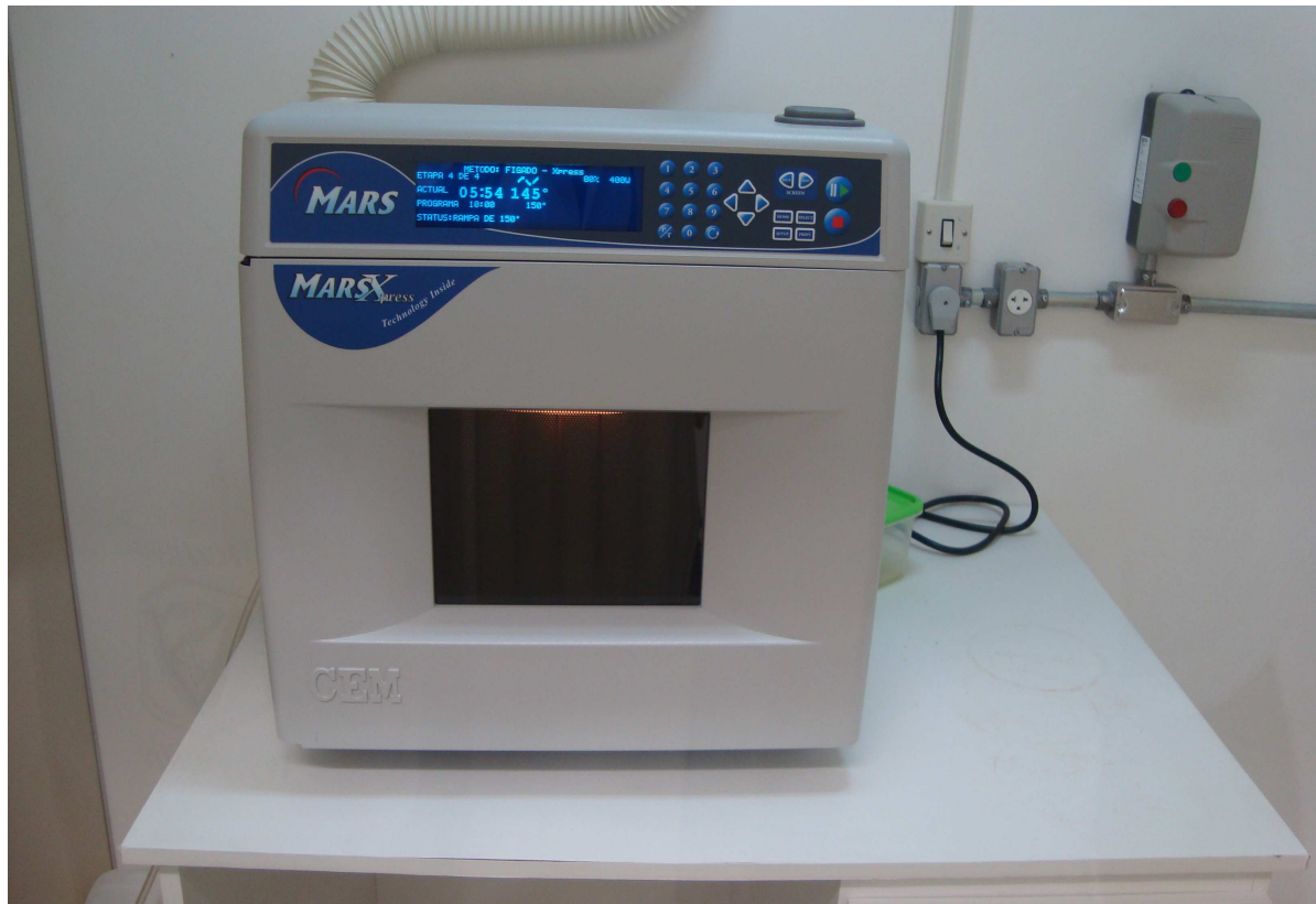
Figura 8 - Processo de digestão fechada através de um forno de microondas MarsXpress – CEM Tecnology Inside.