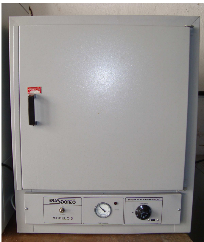
Figura 3 – Estufa para esterilização.

As cinzas foram solubilizadas pela digestão com 3ml de HNO 3 supra-puro, a uma concentração de 65%, 1ml de H 2 O 2 , a uma concentração de 30% e 1 mL de HCL supra-puro, a uma concentração de 37%, e após foram diluídas com água deionizada, para formar soluções para análise de cálcio e fósforo (Adaptado das técnicas de NOMURA et al., 2005).