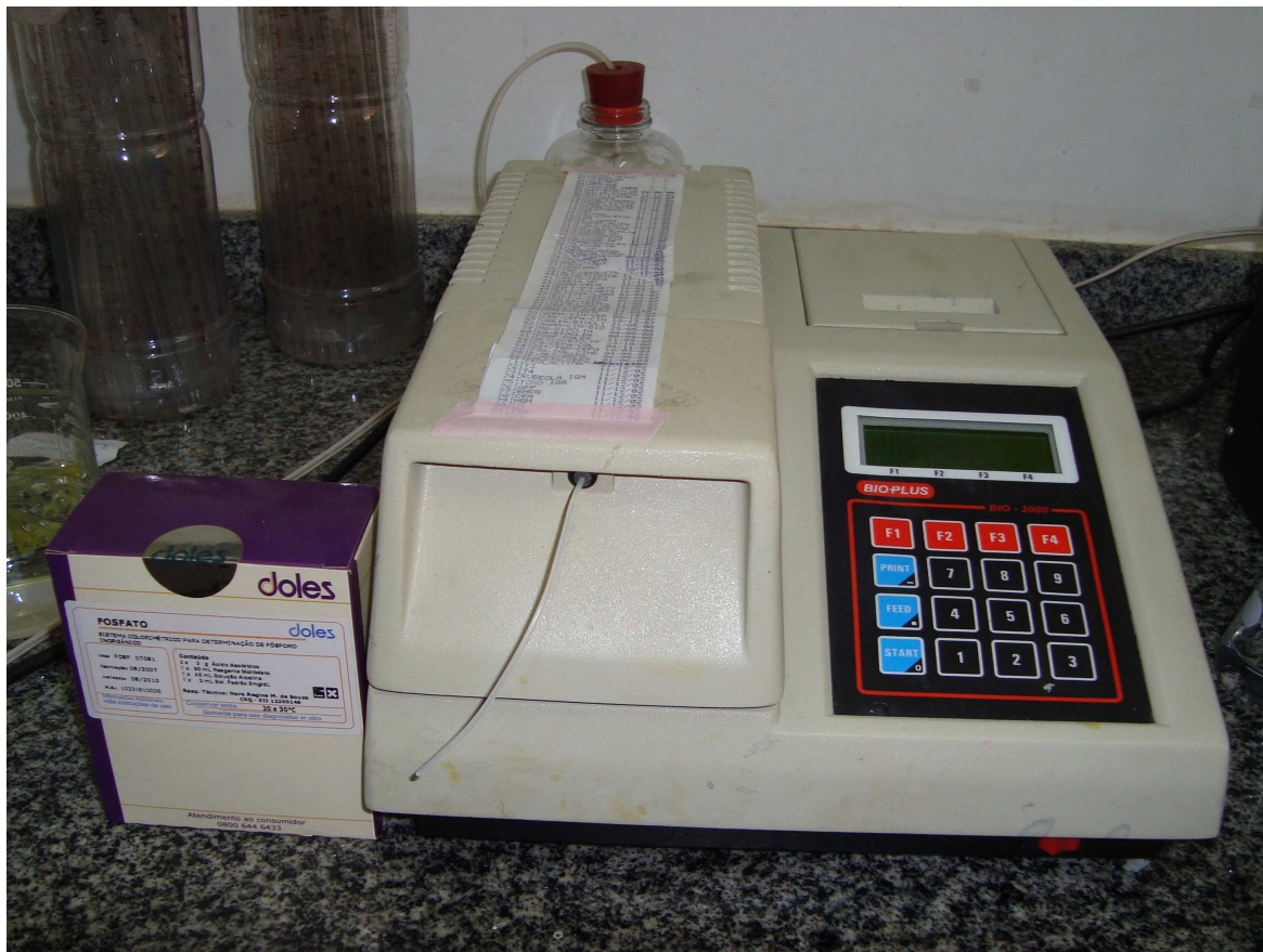
Figura 2 - Kit reagente e aparelho semi-automático de bioquímica Bioplus 2000.

Universidade Federal do Pará através de teste colorimétrico utilizando Kits reagentes no aparelho semi-automático de bioquímica Bioplus 2000 (Figura 2).