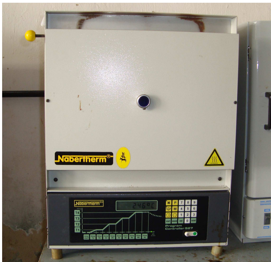
Figura 5 – Mufla.