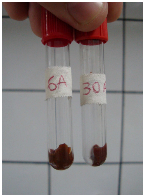
Figura 7 – Amostras de fígado acondicionadas em tubos de vidros estéreis e identificadas.