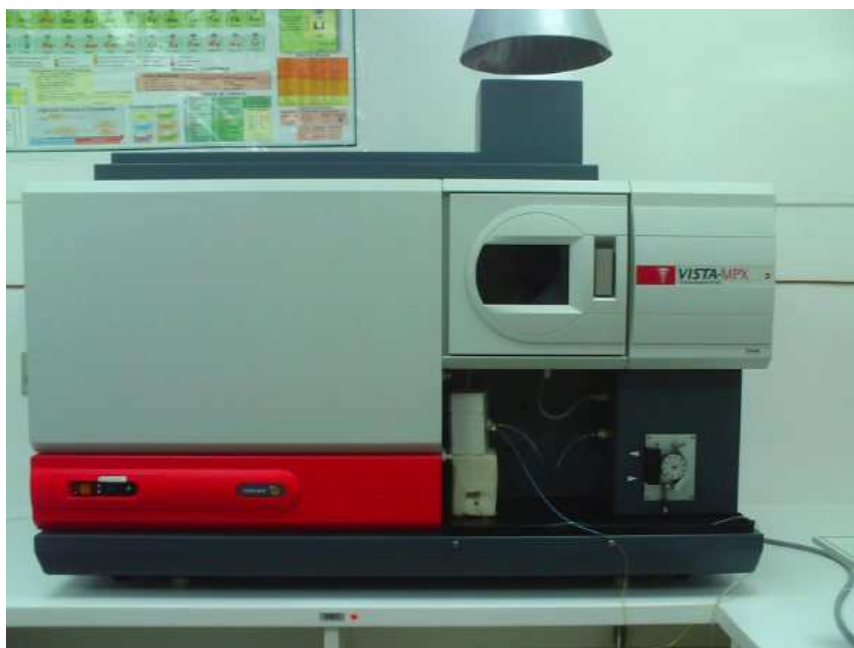
Figura 9 - Espectrometria de Emissão Ótica com Plasma Induzido (ICP OES), modelo Vista-MPX CCD simultâneo (Varian, Mulgrave, Austrália).

O método analítico empregados para a determinação de fósforo obedeceu ao procedimento e recomendações descritas no Procedures Manual HACH-Espectrophotometer e foram determinados por espectrofotometria no equipamento DR2800 da HACH ® (HACH COMPANY, 2008). Todos os resultados foram expressos em porcentagem, baseados no osso seco livre de gordura.