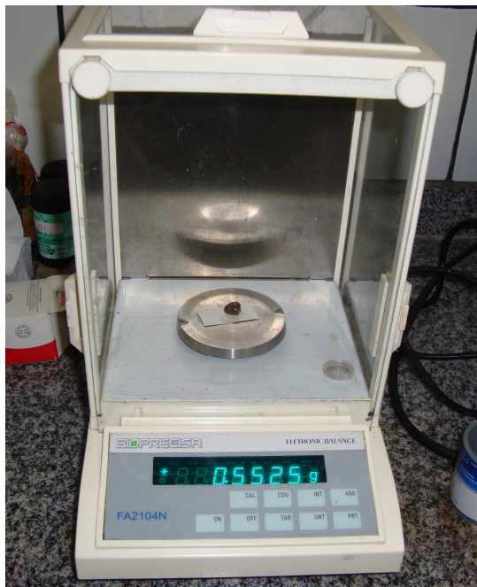
Figura 6 – Pesagem da amostra de fígado em balança de precisão.