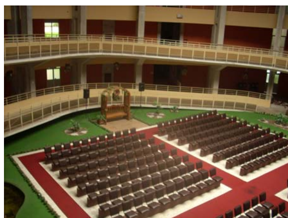
Cemitério de Curitiba