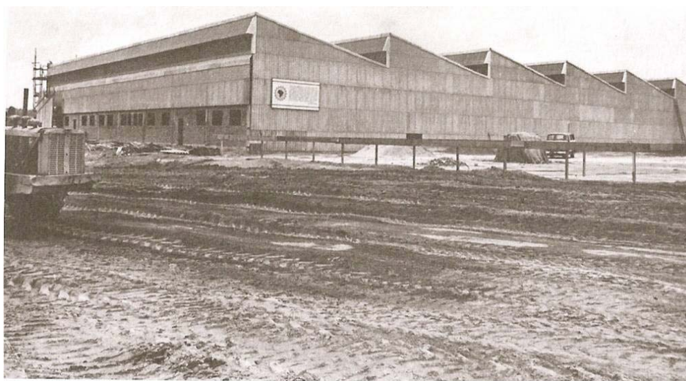
Imagem dos anos 60, cortesia de Roberto Nasser