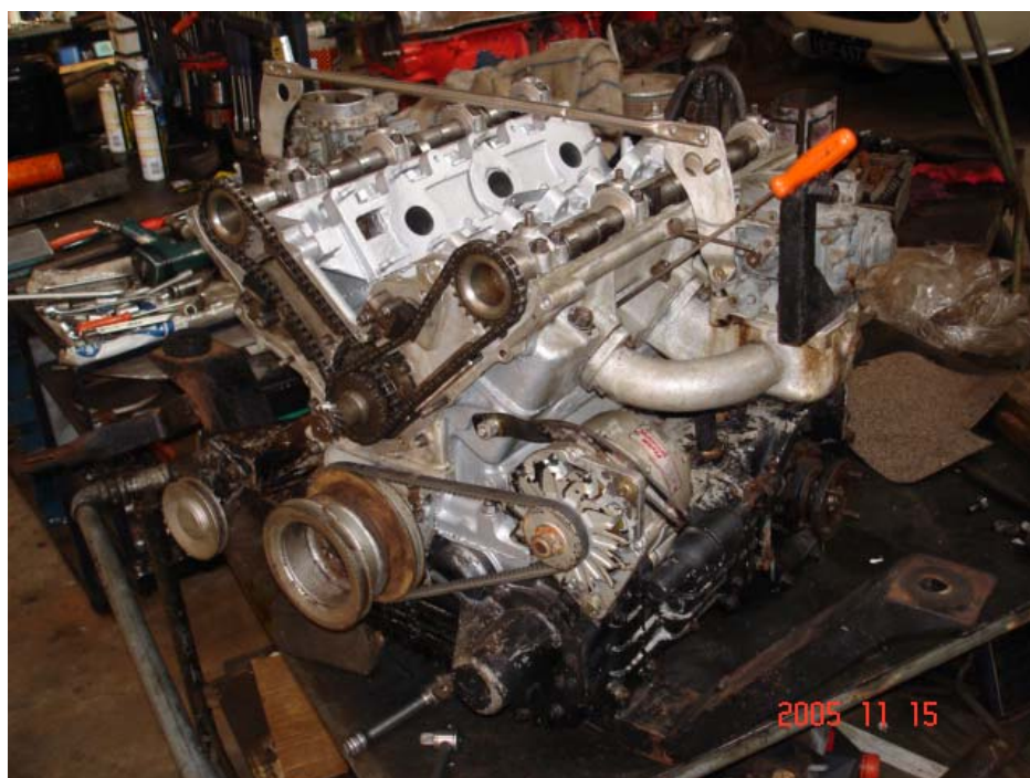
Motor do Democrata de Roberson Azambuja, no restauro em 2005