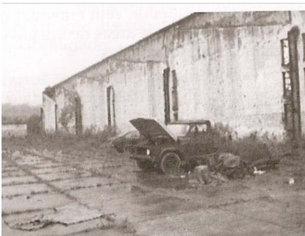
Fábrica abandonada