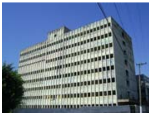
Hospital de Vila Formosa