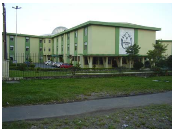
Cemitério de Curitiba