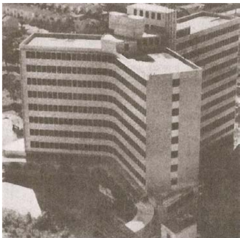
Hospital Presidente