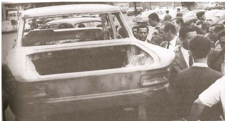
Carroceria para mostras de resistência