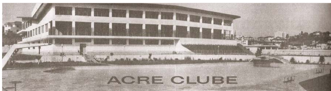
Acre Clube, cortesia de Roberto Nasser