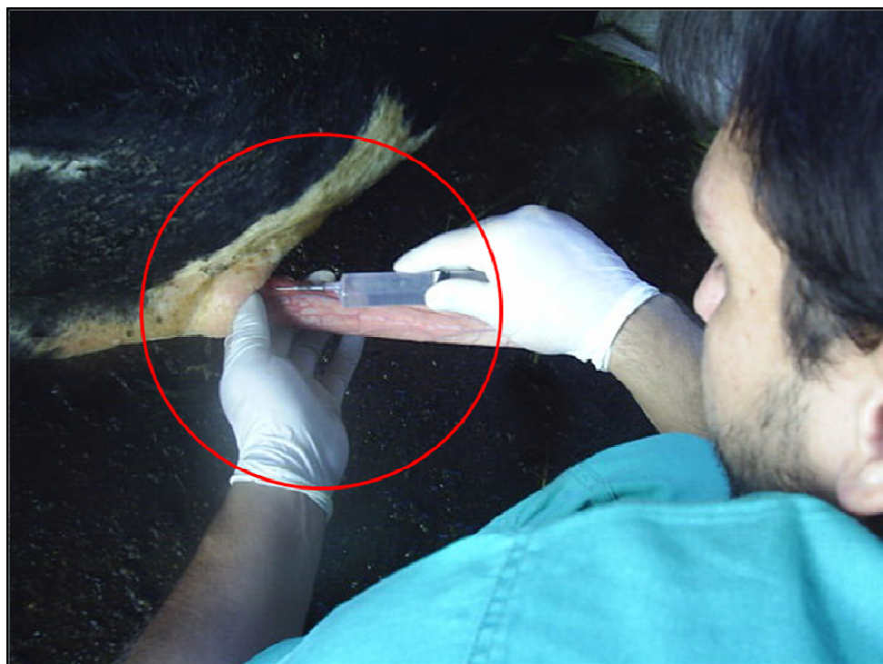
Figura 6: Procedimento de infusão de lidocaína na região dorsal do pênis bovino ao longo do local de incisão

A anestesia foi realizada através de bloqueio local com lidocaína 2,0%, com vaso constritor, na região dorsal do pênis destinada à incisão cirúrgica, até a formação do “botão anestésico”, que corresponde ao aumento de volume local provocado pela infusão de lidocaína no tecido ( Figura 6 ). O local da incisão cirúrgica foi definido através da obtenção, com o auxílio de uma régua, da distância entre a região mais proximal da glândula à rafe do prepúcio, reproduzindo esta mesma distância, a partir da rafe do prepúcio em sentido distal à glândula. Este local, de acordo com o estudo prévio realizado com peças anatômicas, corresponde ao ponto de menor densidade do LADP, sendo então o local ideal para a incisão.