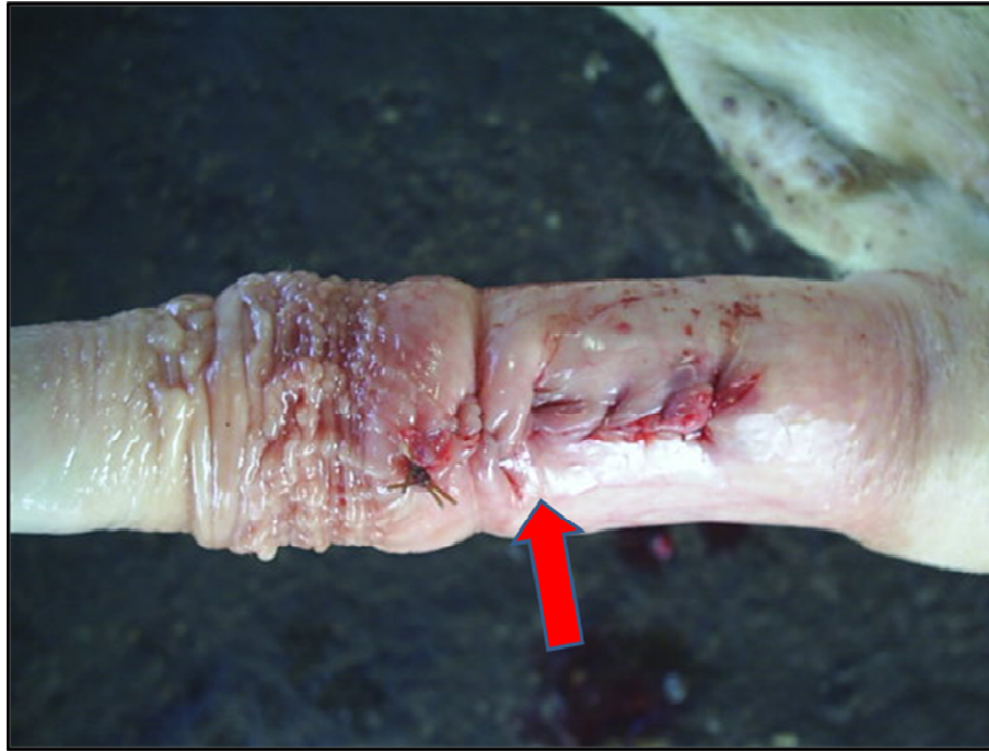
Figura 8: Sutura contínua simples com pontos utilizando fio absorvível natural.

Todas as cirurgias foram associadas à vasectomia preventiva, evitando fecundações indesejadas em caso de insucesso da técnica. As vasectomias foram feitas imediatamente após a cirurgia de extirpação do LADP.