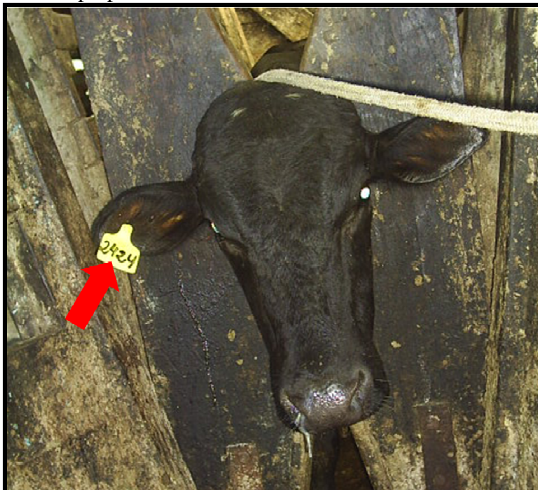
Figura 3: Identificação por brinco de animal nascido na propriedade

O sistema de rastreamento dos animais consiste na utilização de brincos amarelos numerados, para animais nascidos na propriedade, de acordo com o nascimento ( Figura 3 ). Para animais adquiridos de outrem, os brincos são de coloração vermelha, seguindo a ordem de aquisição. Além dos brincos, os animais são marcados a ferro quente com a mesma numeração constante no brinco, seguida da letra “B”, para os nascidos no local e letra “O” para os adquiridos de outras propriedades.