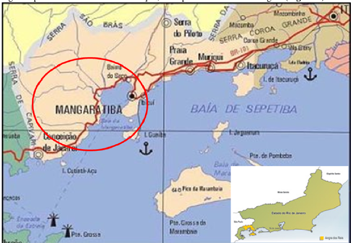
Figura 2: Localização geográfica da propriedade rural, na região de Mangaratiba-RJ, onde foi realizado o estudo

A propriedade possui 700 alqueires, dos quais 350 de mata atlântica preservada e os 350 restantes constituem pastos divididos por cercas elétricas nas divisões interna e arames farpados nas divisões externas. Os pastos são cultivados com braquiarias ( decumbens , brizantha ) e capim colômbio ( Panicum Maximum ). Possui dois currais de ordenha, sendo o primeiro para vacas recém paridas, onde permanecem até sessenta dias de lactação e o segundo para as demais vacas em lactação, onde permanecem até a secagem ( Figura 2 ).