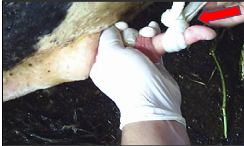
Figura 5: Amarradura com atadura de crepom na região distal do pênis bovino para mantê-lo exposto durante o procedimento cirúrgico, sem torção e traumatismos indesejáveis.