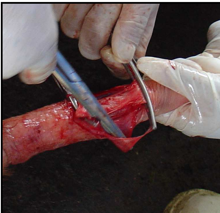
Figura 7: Pênis bovino: Segmento do LADP a ser extirpado, pinçado por duas pinças hemostáticas formando os limites a serem seccionados.

Durante todo o procedimento cirúrgico, o pênis foi mantido exposto, tracionado por um auxiliar da equipe, por meio da mesma amarradura de crepom. Foi realizada uma incisão longitudinal, no local pré-definido anteriormente e previamente anestesiado, com o auxílio de bisturi de lamina. Em seguida foi realizada a dissecação da túnica albugínea utilizando tesoura de ponta romba e pinça dente de rato e após a visualização do LADP e definido o ponto de clivagem, o ligamento foi cuidadosamente separado do corpo do pênis através de dissecação com tesoura de ponta romba, ficando a tesoura entre o corpo do pênis e o LADP. A extremidade distal não aderida do ligamento foi pinçada com pinça hemostática Kelly e a partir de então foi realizada a medida de cinco centímetros, sentido proximal onde foi fixada outra pinça do mesmo modelo. Neste momento, a porção a ser extirpada já está definida ( Figura 7 ). Foi realizada a secção das extremidades pinçadas obtendo-se assim a extirpação de cinco centímetros do LADP.