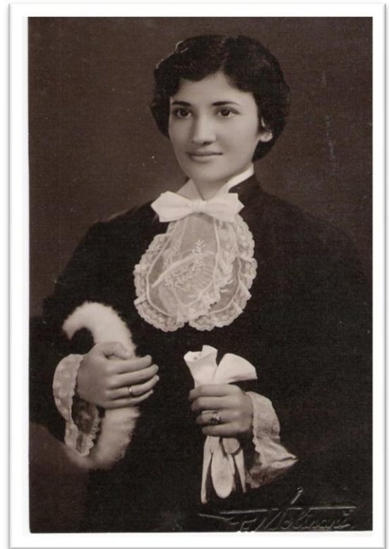
Foto 6 – Ex-normalista com a beca de formatura