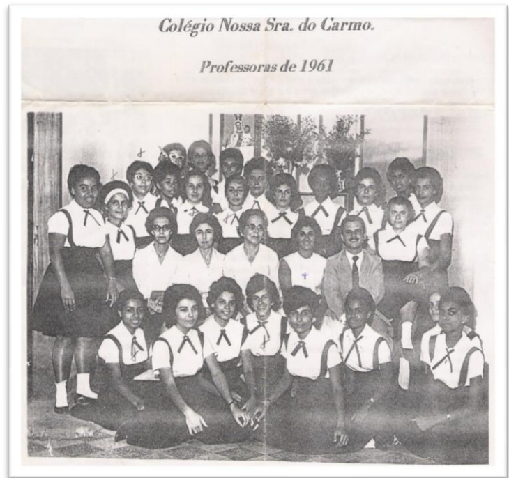
Foto 2 – Ex-normalistas e professores do CNSC