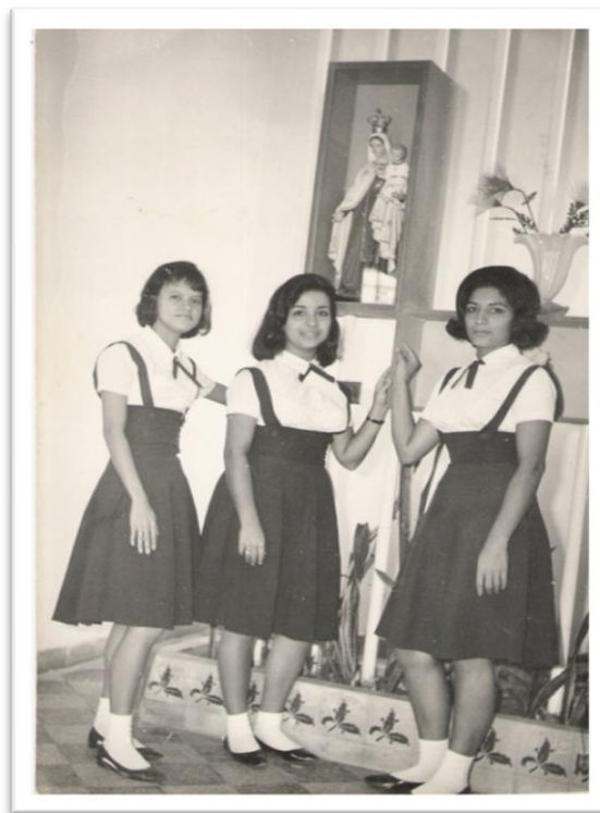
Foto 5 – O uniforme das normalistas

A foto 5, revela o brio do uniforme das ex-normalistas e a padronização de comportamento e posturas disciplinadas pela vestimenta, de acordo com a consideração de Freire, L. F. C. de que a escola tradicional como o locus privilegiado do cultivo da disciplina e do aprendizado da ordem “necessita de uma indumentária que imponha elementos constritores do comportamento individual dos alunos” (2004, p. 229).