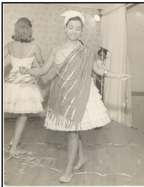
Foto 8 – Expressão artística no CNSC

As recordações guardadas em imagens fotográficas misturavam-se às imagens/memórias verbalizadas e que refletiam quão significativas haviam sido as experiências formativas.