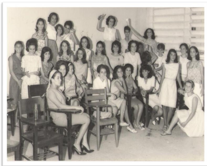
Foto 7 – As normalistas se tornaram professoras