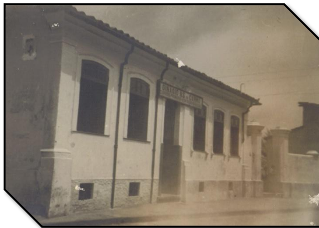
Foto 4 – Fachada da casa onde o CNSC iniciou suas atividades

A instituição escolar é um significativo espaço de memórias, mas uma memória que tem uma temática central – a aquisição de determinados conhecimentos sistematizados, escolhidos por um grupo social como imprescindíveis para a sua permanência. Ao tempo em que “forma personalidades”, as forma segundo o desejo de um tempo e de um espaço determinado (MENEZES, 2007, p. 64).