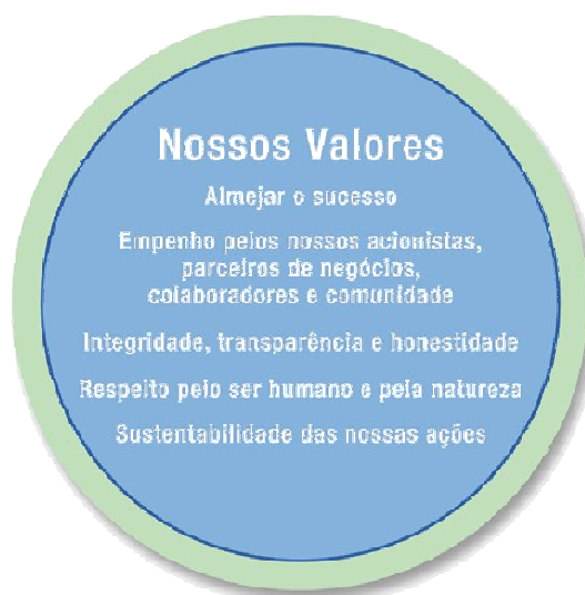
Figura 5 – Valores VSK