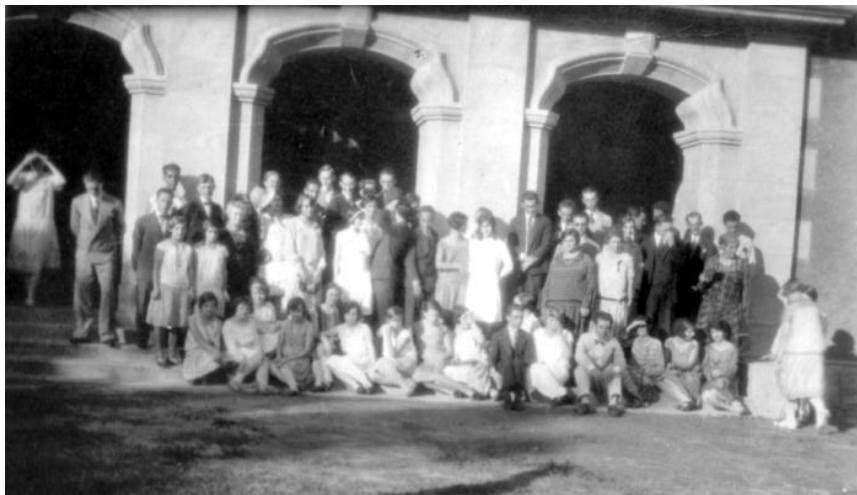
Figura 7: 3º Congresso da UETC – Bennett – RJ

O terceiro congresso, o primeiro da nomenclatura “União dos Estudantes para o Trabalho de Cristo” ocorreu no Colégio Bennett, no Rio de Janeiro, entre os dias 5 e 8 de abril de 1928.