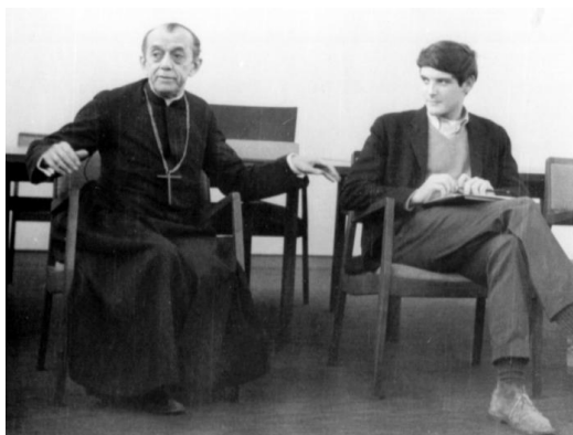
Figura 21 – Encontro dos estudantes da UCEB e de Cornell na Praia da Piedade em Recife, com a presença de Dom Hélder Câmara.

É preciso que registremos ainda, os encontros entre os estudantes membros da UCEB e os estudantes da Universidade de Cornell (EUA). Esses encontros aconteciam no período de férias escolares nos Estados Unidos, entre os meses de julho e agosto, e contavam com a presença de aproximadamente 20 de estudantes das duas nações. Um dos encontros memoráveis foi o que aconteceu na Praia da Piedade – Sul do Recife – com palestras sobre o Nordeste e o Brasil. Entre os palestrantes, Dom Hélder Câmara se sobressaiu. Convidado a visitar os Estados Unidos, passou a ter maior projeção internacional em sua resistência à ditadura.