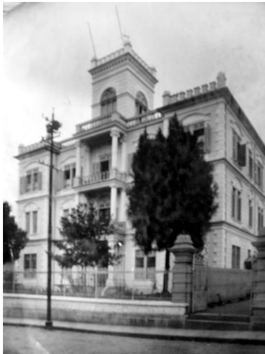
Figura 4: Fachada do Granbery

Dessa forma, como já indicado em preliminares abordagens, a UCEB trilhou seus caminhos buscando se tornar uma expressão brasileira dos movimentos de estudantes cristãos presentes em várias partes do mundo. Em 1924, a exemplo do Movimento de Estudantes Voluntários, em operação nos Estados Unidos, um grupo de jovens metodistas, aspirantes ao ministério pastoral resolveu criar, a partir do Colégio Americano Granbery uma organização pioneira dedicada ao serviço cristão em terras brasileiras.