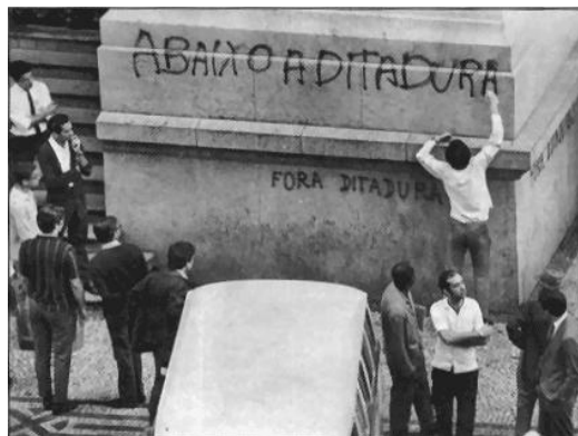
Figura 3: Luta dos jovens estudantes contra a ditadura militar

E infelizmente, os grupos reacionários das Igrejas Protestantes apoiaram tais alternativas de poder e se afastaram do legado da Reforma que lhes deu origem.