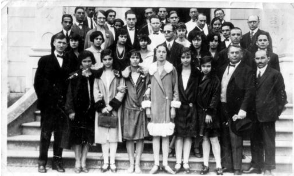
Figura 6: 2º Congresso da UETC (Juiz de Fora, 1927) Note-se, na primeira fileira da direita para a esquerda, os reverendos Erasmo Braga e Walter Harvey Moore.

O segundo congresso do então “Grêmio dos Obreiros Estudantes” também aconteceu no Granbery. Realizou-se entre os dias 13 e 15 de maio de 1927. Nesse congresso, as linhas e finalidades do movimento foram definidas. “Uma comissão é nomeada para elaborar os Estatutos e na sétima sessão do Congresso eles já são lidos e aprovados por unanimidade”. 251 Nesse congresso, o Grêmio recebeu o nome de “União dos Estudantes para o Trabalho de Cristo”.