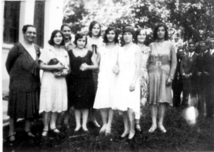
Figura 8: 5º Congresso da UETC, Colégio Batista, RJ