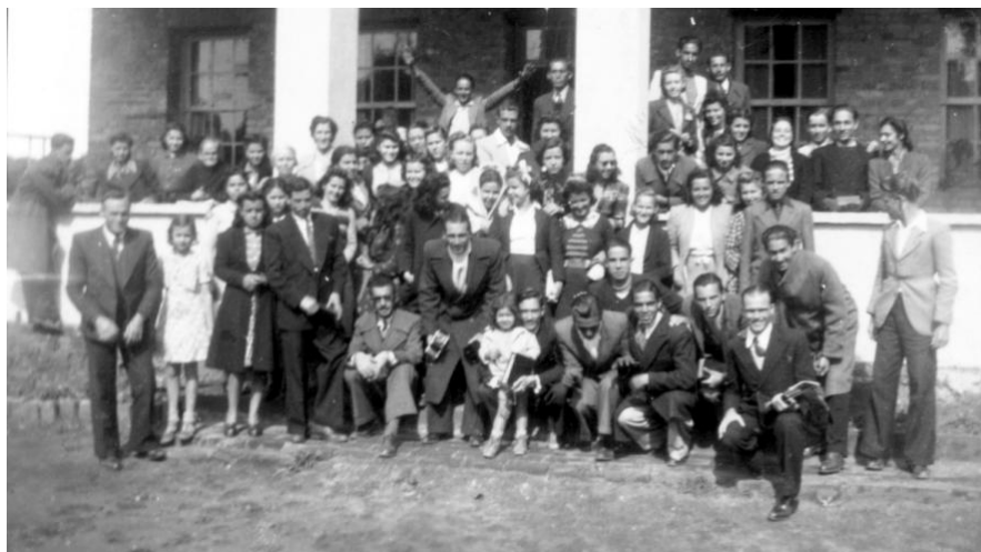
Figura 13: 15º Congresso da UCEB, Castro, 1940

Essa última constatação confirma, uma vez mais, que uma das características dessa primeira fase era a busca por uma espiritualidade que fundamentasse o testemunho da fé cristã nas escolas. Entrementes, uma ação social, na perspectiva da piedade, já começava a se configurar. Dessa forma, os grêmios estudantis eram fundamentais para a ênfase do testemunho cristão com vistas ao proselitismo: