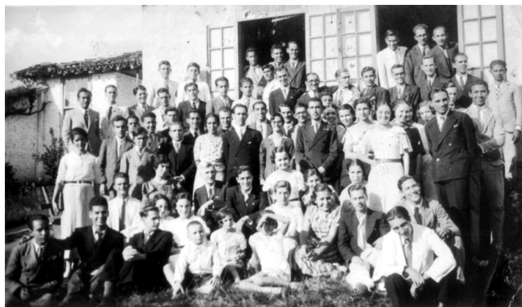
Figura 10: 11º Congresso da UETC, 1936.