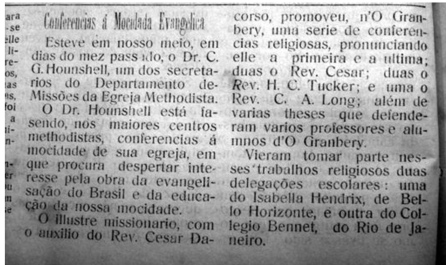
Figura 5: Periódico “Ó Granbery”, pontua a visita de Hounshell.

um Congresso que contou com a participação de pastores, missionários, professores e alunos. Mesmo não havendo uma divulgação anterior, os colégios Izabella Hendrix de Belo Horizonte e Bennett do Rio de Janeiro enviaram seus representantes.