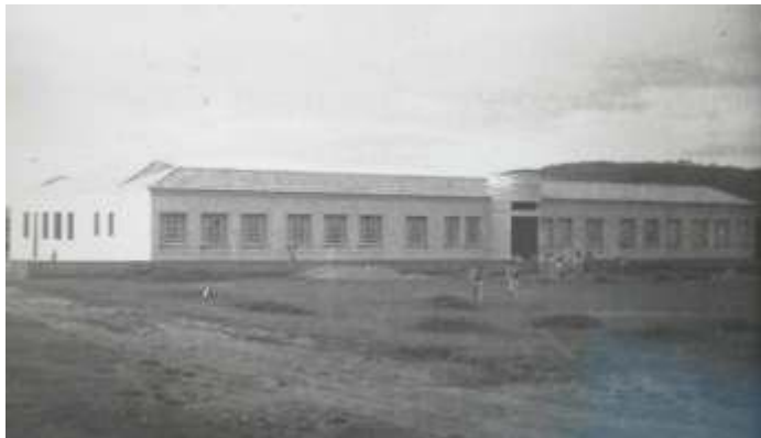
Fachada principal da Escola Normal de Oeiras 1968