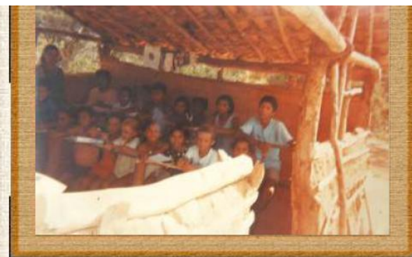
Alunos em sala de aula- 1997 (Omitimos o nome da escola e da localidade por questões éticas)