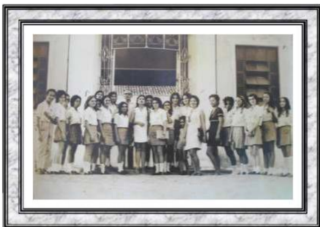
Turma de estudantes da Escola Normal Presidente Castelo Branco - Concluintes do Curso Magistério - Oeiras/PI, 1972