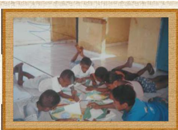
Práticas escolares Momento de atividade de arte na sala de aula Loc Vaca Brava Oeiras-PI/1999