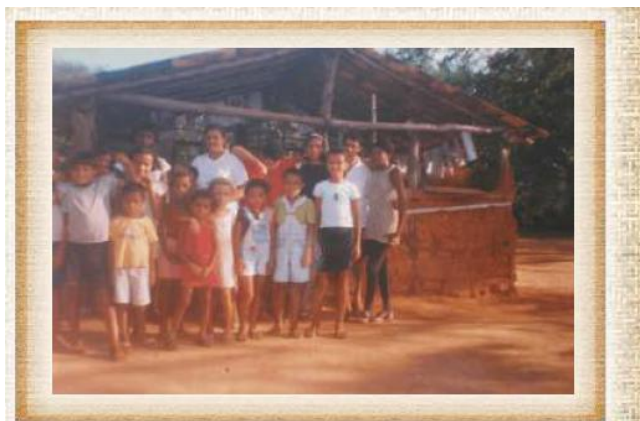
A professora leiga rural com os seus alunos em frente à escola (Omissão de nome da escola e da localidade por questões éticas) Oeiras-PI/1998