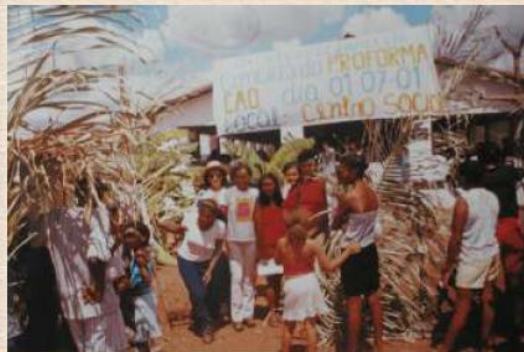
Culminância de projeto de pesquisa com os professores cursistas do Proforma Loc. Contentamento - Oeiras_PI/2001