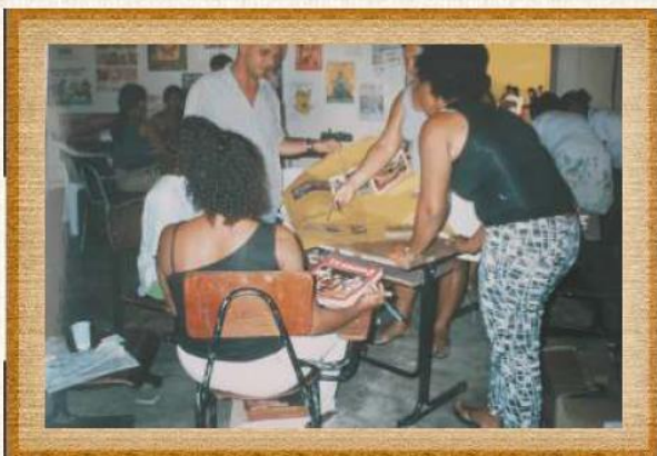
Atividade dirigida em curso de formação para professores - Escola Lauro Machado Torres - 1998