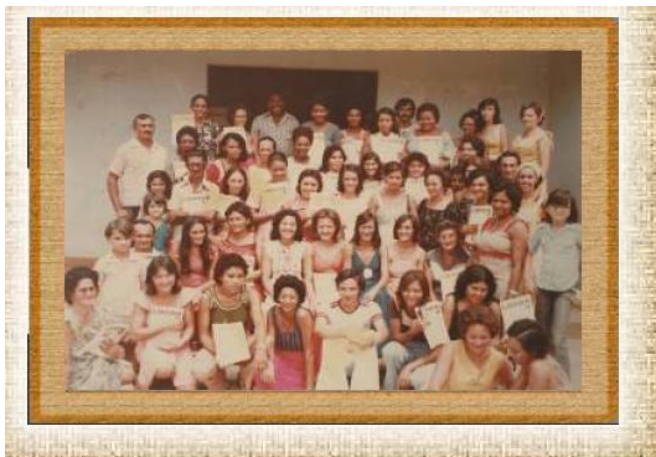
Projeto Logos II - Oeiras - 1980

1ª Turma de Cursistas - Professores Leigos dos Municípios de Oeiras, São Francisco, São José do Peixe, Santo Inácio e Paes Landim.