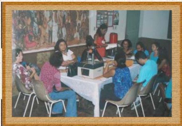
Planejamento mensal para professores-formadores do Proformação (Agência Formadora em Oeiras/PI- ano 2000)