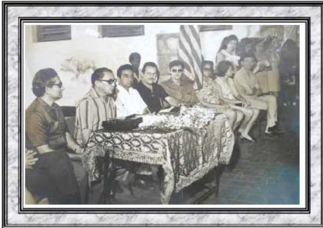
Criação da Escola Normal São José - Oeiras/PI - 1953