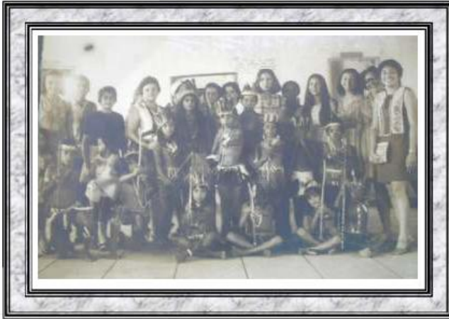
Atividade lúdica referente ao Dia do Índio no Grupo Escolar Armando Burlamaqui - Oeiras/PI - abril /1971