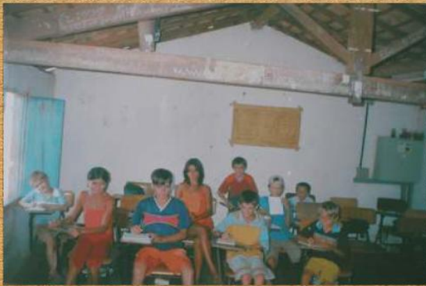
Prática escolar - atividade de leitura e escrita em sala de aula Loc. Malhada Grande Oeiras-PI/2002