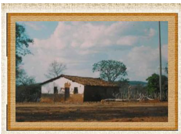
“Casa de Escola” Antiga casa onde funcionava uma Escola Rural Oeiras, 1982