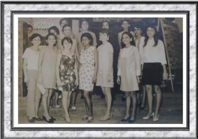
Professores da educação pública estadual que participaram da capacitação de implantação do Método Misto - CTP (Centro de Treinamento de Campo Maior - 1969 )