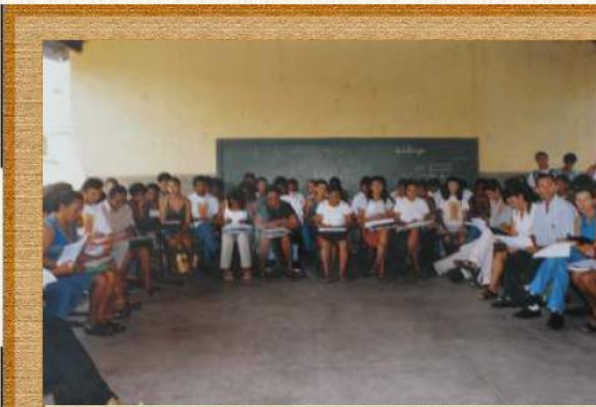
Reunião de abertura da fase presencial do curso Proformação para professores leigos Oeiras-PI/2000