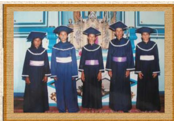
Momento de formatura dos professores leigos pelo Proformação Oeiras-PI/2001