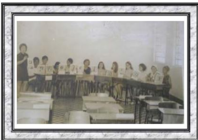
Encontro de Supervisores no Centro de Treinamento de Campo Maior - Campo Maior /PI - 1973