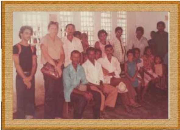
Reunião com a Comunidade Buriti do Rei para instalação de uma sala para Alfabetização Funcional do Mobral Oeiras_PI, 15/09/1977