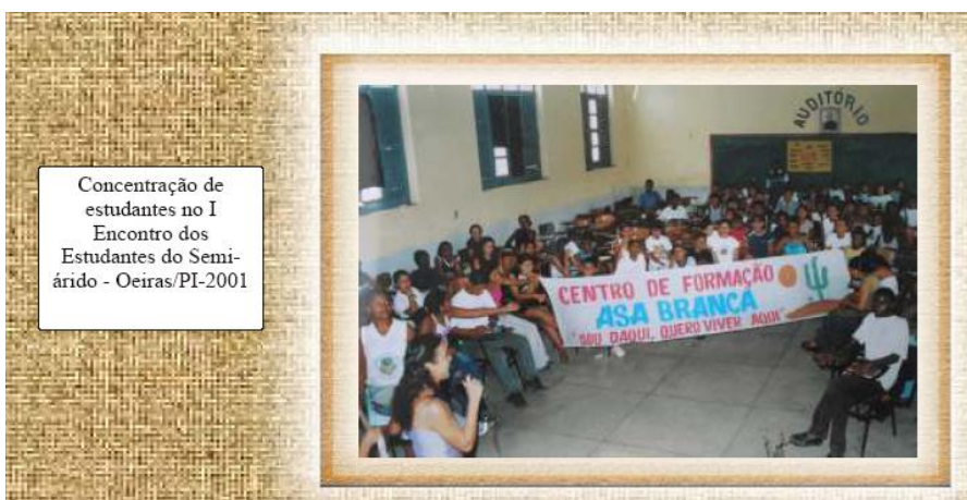
Concentração de estudantes no I Encontro dos Estudantes do Semi- árido - Oeiras/PI-2001