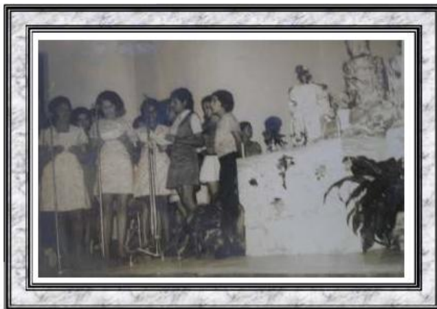
Festividades alusivas ao mês de maio nas Escola Normal Presidente Castelo Branco - Oeiras/PI - 1978