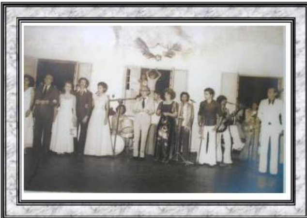
Festividade de Colação de Grau do Curso Magistério da Escola Normal Presidente Castelo Branco - Oeiras/PI, 1975