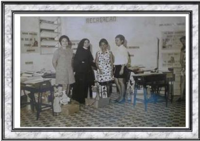
Implatação das novas tecnologias educacionais na educação pública do Estado do Piauí - Centro de Treinamento de Campo Maior - 1969