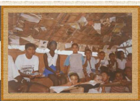
Momento de aula em uma escola rural - 1997 (Omissão do nome da escola e da localidade por razões éticas)