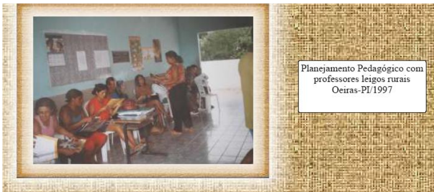
Planejamento Pedagógico com professores leigos rurais Oeiras-PI/1997