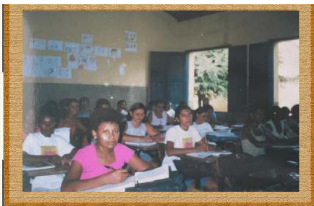
Capacitação de professores leigos pela Escola Lauro Machado Torres Oeiras/PI, 1998