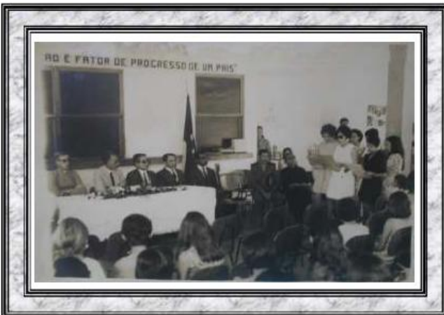
Fundação do Centro Regional de Supervisão de Oeiras/PI - 1970 (Entidade responsável pela orientação pedagógica às escolas rurais do centro-sul da região de Oeiras)