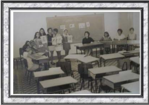
Primeiro curso para Professores de Alfabetização - Oeiras/PI - 1969 ( Promovido pelo Centro Regional de Supervisão de Oeiras)