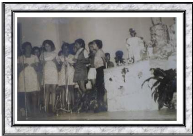
Festividades alusivas ao mês de maio nas Escola Normal Presidente Castelo Branco - Oeiras/PI - 1978