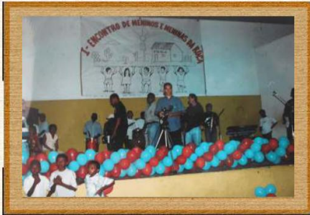
Momento de abertura do I Encontro de Meninos e Meninas da Roça (Prática Educacional realizada no município de Oeiras-PI/1999 com a participação de mais de 1.500 alunos da rede municipal)