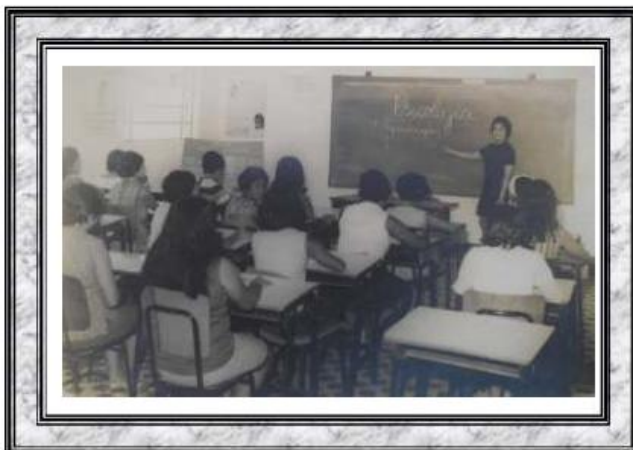
Capacitação de professores da Educação Pública do Estado do Piauí - Centro de Treinamento de Campo Maior - 1969