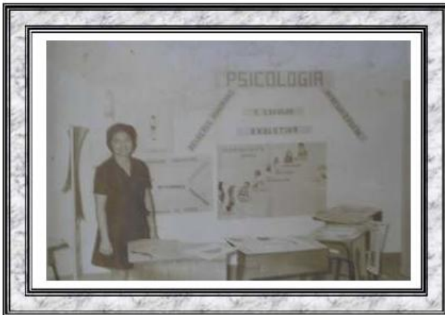
Inovações Tecnológicas na Educação Pública do Estado do Piauí - o uso da Psicologia para capacitação de professores (Centro de Treinamento de Campo Maior - 1969 )