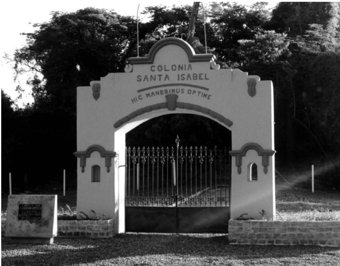
Figura 2 – Portal da Colônia Santa Isabel – Betim, 2009

No final da década de 90 há a inclusão de pacientes nas internações de longa permanência (AIH5) em todos os hospitais colônia do estado. Em Santa Isabel entram para este modelo assistencial 120 pacientes, com preferência para os moradores do chamado Centro da Colônia. Em 2002 estabelece-se o Plano Terapêutico individual que aponta o cuidado por uma equipe multiprofissional com periodicidade diária ou semanal.