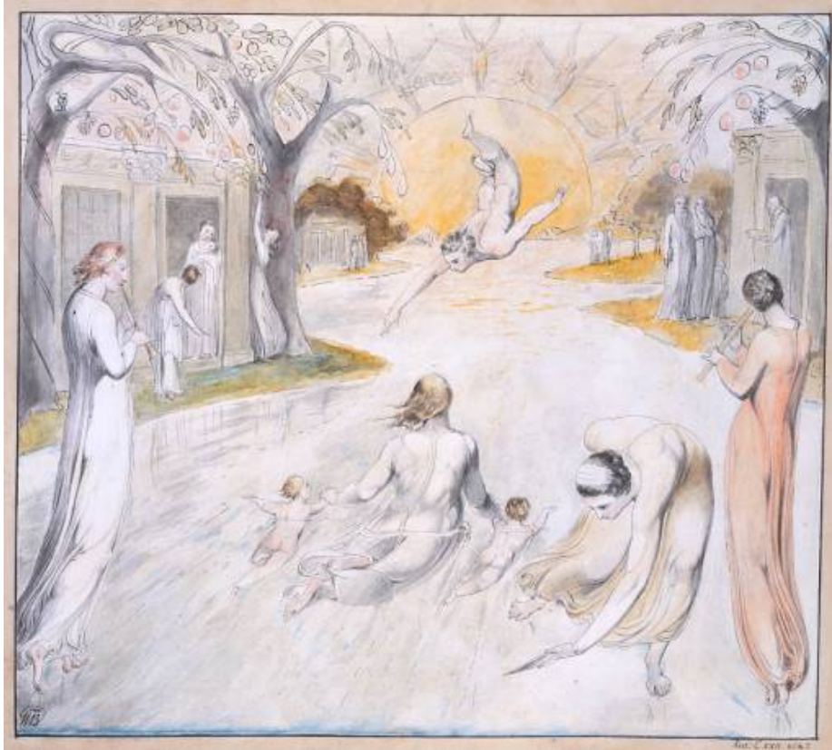
“The River of Life”, o rio vivo que William Blake intuiu/materializou

Querido leitor, aqui nesse espaço intermediário, o espaço “entre” essas camadas sedimentares de minha interioridade que essa arqueologia poética escava, nesse lugar em que a memória individual e a memória coletiva se fundem, nesse território sem dono em que o rio vivo na época da seca deixa a céu aberto sedimentos poéticos que o homem processou; nesse interlúdio escutamos uma voz profunda, harmoniosa de um verdadeiro artesão das palavras, das cores, dos