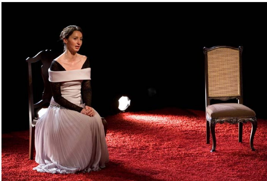
A Filha Mais Velha

O texto de Lagarce começa com um longo solilóquio dito pela Filha mais Velha que, de certa maneira sintetiza tudo o que a peça almeja revelar. Ali encontramos a memória e a imaginação aliadas, encontramos estruturas frasais poéticas e repetitivas, uma dança dos tempos verbais e uma narrativa-lírica. Ou seja, Lagarce joga com os ingredientes da linguagem, para assim, mergulhar na intimidade da personagem. Vamos a ele.