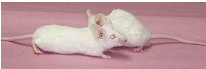
Ilustração 3: Camundongos BALB/c

O camundongo BALB/c (Ilustração 3) tem sido considerado susceptível a muitas espécies de Leishmania . Diaz et al. (2003), utilizaram este modelo para examinar a produção de óxido nítrico durante o curso da infecção por L. mexicana , o que resultou no desenvolvimento de lesões crônicas progressivas com predominância de IL-4 e células Th2. Este animal possibilitou a avaliação do papel realizado por citocinas na diferenciação das células Th durante a doença progressiva apresentada (Gumy et al. , 2004).