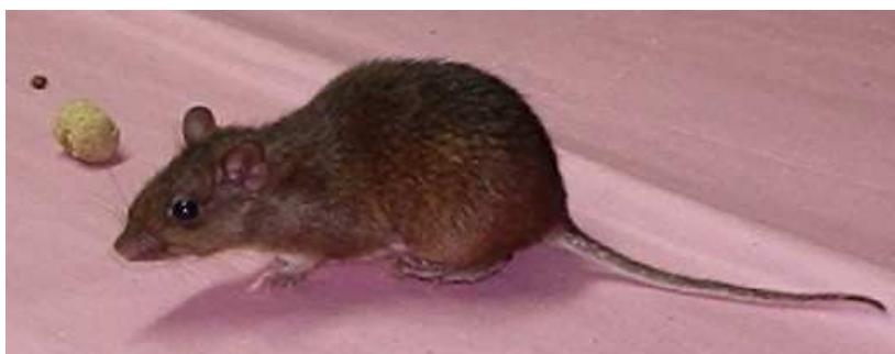
Ilustração 4: Proechimys sp.

Lainson et al. (2002), investigaram a susceptibilidade de uma espécie comum da Amazônia, Proechimys guyanensis à infecção com L. chagasi , no qual nenhuma infecção foi detectada pelos métodos utilizados, apesar dos hamsters terem apresentado fígado e baço rico em amastigotas.