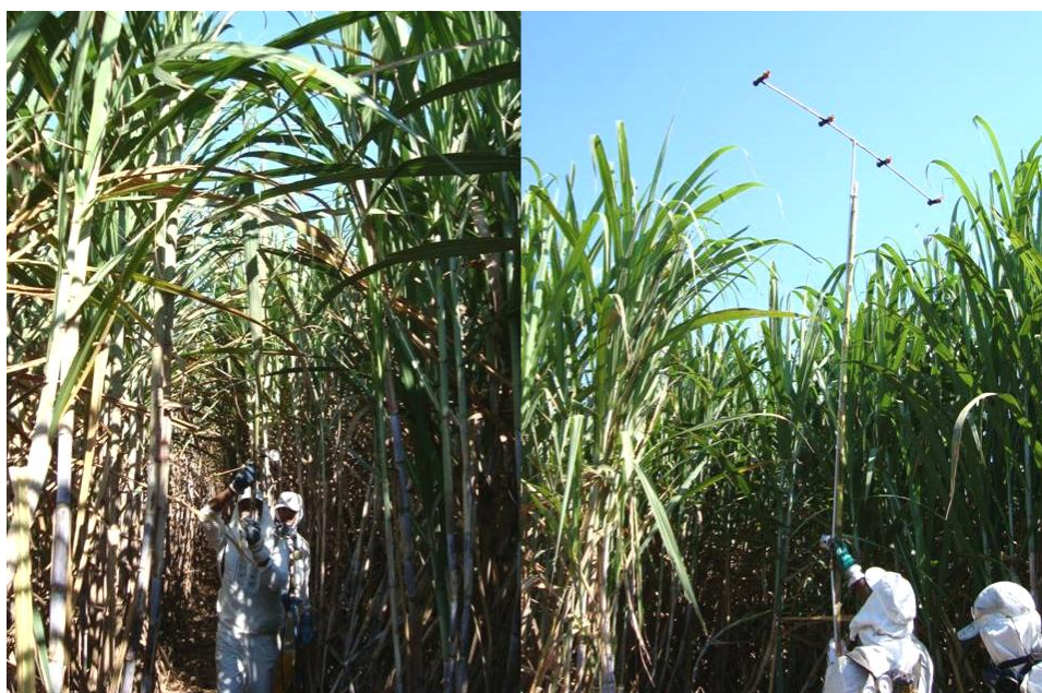
Figura 3. Aplicação dos tratamentos principais por meio de equipamento costal pressurizado (CO 2 ) com barra em forma de "T". Fazenda Itaquerê. Usina Santa Fé, Nova Europa, SP. Safra 2008/09.