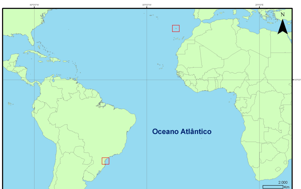
Figura 1 – As ilhas de São Francisco do Sul e da Madeira em continentes diferentes, mas banhadas no mesmo oceano Fonte: André Lima, 2010

“Embora muitas pessoas digam que não, sempre houve e haverá reinos maravilhosos nesse mundo” (TORGA, 2007, p. 23).