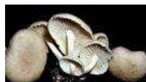
Figura 6. Oudemansiella canarii

Segundo a Embrapa (2009), os cogumelos possuem atividade anticâncer que está associada a polissacarídeos existentes na parede celular do corpo de frutificação (fruto), podendo estimular a formação de anticorpos que inibem o crescimento de tumores. Neste caso, o polissacarídeo mais importante conhecido é a Beta-glucana, que potencializa o sistema imunológico, aumentando as defesas naturais do corpo. Nos cogumelos, ela é constituída por ligações glicosídicas \beta(1\rightarrow3) e \beta(1\rightarrow6) (MANZI, 2000).