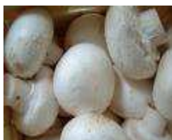
Figura 5. Champignon de Paris