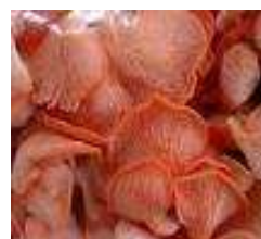
Figura 3. Pleurotus salmon