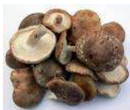
Figura 1. Shiitake

Os cogumelos são conhecidos e utilizados há milhares de anos, principalmente em países orientais. A espécie mais cultivada no mundo é o Champignon de Paris ( Agaricus bisporus ), que também foi a primeira a ser cultivada no Brasil. Já o Shiitake ( Lentinus edodes ) ocupa o segundo lugar em consumo, mas tem sua importância medicinal devido às várias substâncias ativas que já foram isoladas e purificadas (FURLANI e GODOY, 2005). Nos últimos anos, espécies do gênero Pleurotus vêm ganhando espaço nas prateleiras dos mercados, por possuírem aromas e cores diferenciadas, como nas variedades shimeji, Pleurotus branco e Pleurotus salmon, conhecidos no exterior como “oyster mushrooms”, devido ao seu aspecto parecido com o de uma ostra. As figuras abaixo (1 a 6) apresentam algumas espécies de cogumelos comestíveis.