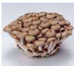
Figura 2. Shimeji