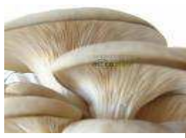
Figura 4. Pleurotus branco