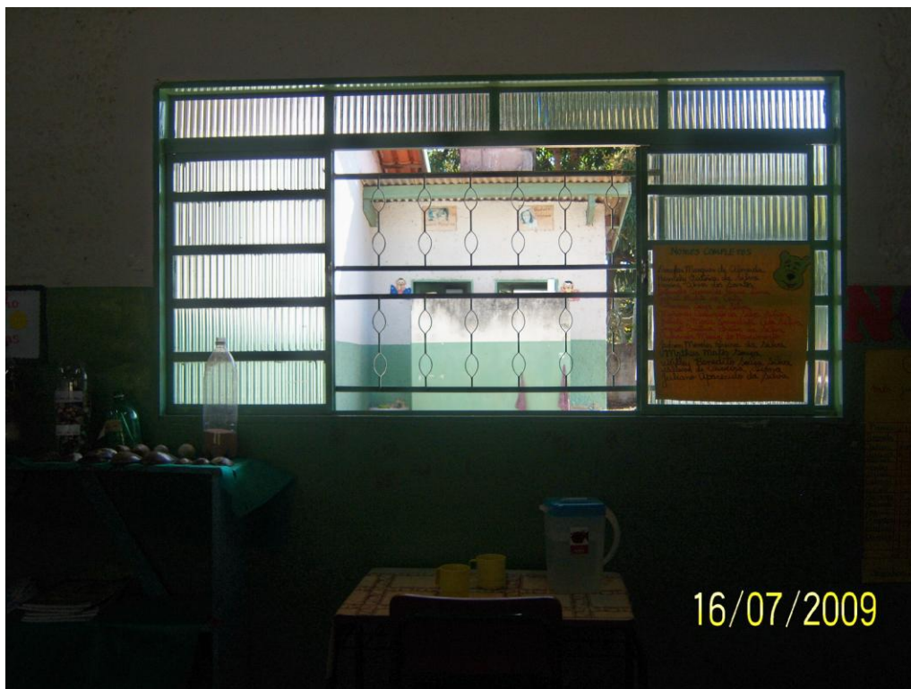
Figura 5– Escola com classe multisseriada – Organização Espacial – Estratégia da água

Observou-se que, na classe multisseriada, a porta da sala de aula permanecia aberta sempre, já que a sala não possuía ar condicionado. Isso pareceu facilitar o trânsito livre dos alunos para fora da sala durante as aulas, quando necessitavam ir ao banheiro. Percebeu-se, ainda, que os alunos também percorriam com liberdade os espaços escolares durante o recreio, talvez pelo fato de se ter um número menor de alunos ao todo na escola com classes multisseriadas, quando comparada à escola de 3º ano na zona urbana.