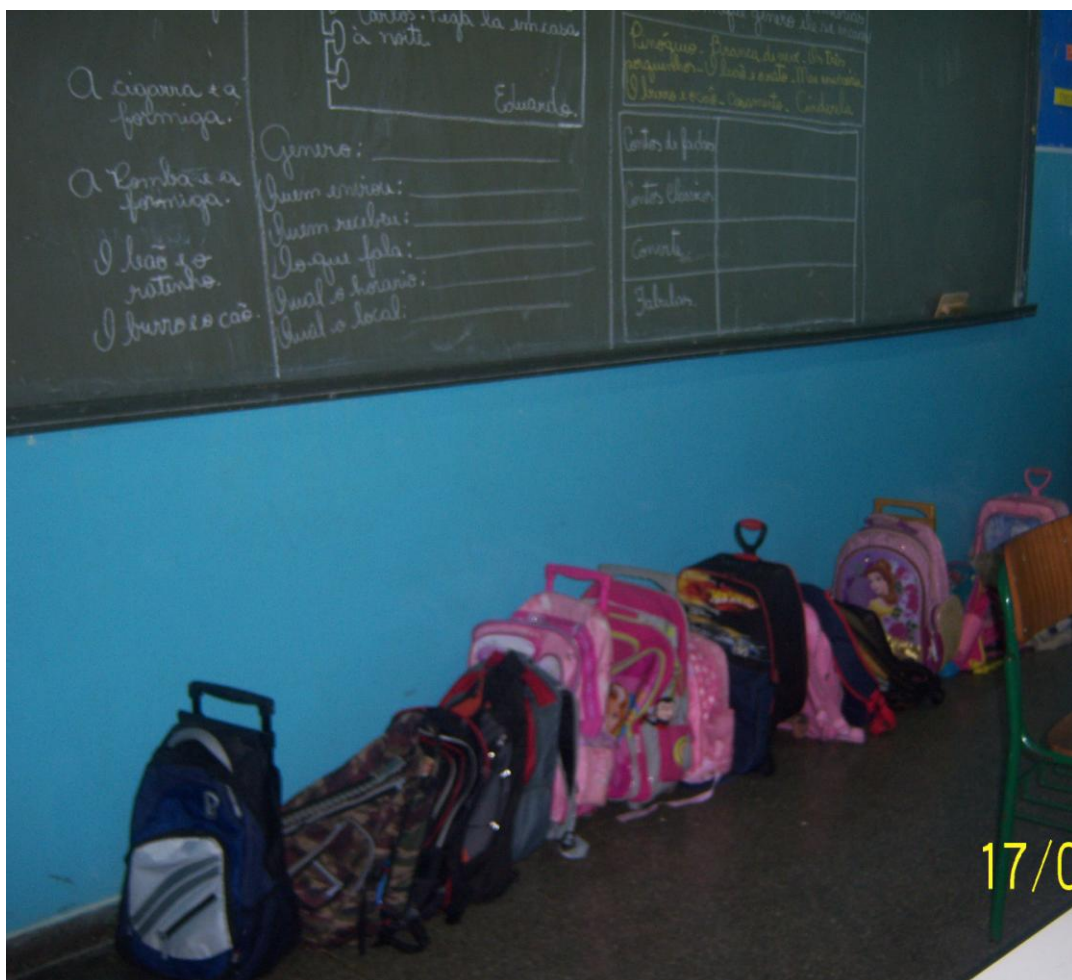
Figura 6– Escola com classe 3º ano do CBAC – Organização Espacial – Dia de Prova

Com o ar condicionado ligado e a porta sempre fechada, os alunos precisavam do aval da professora para qualquer movimento diferenciado.