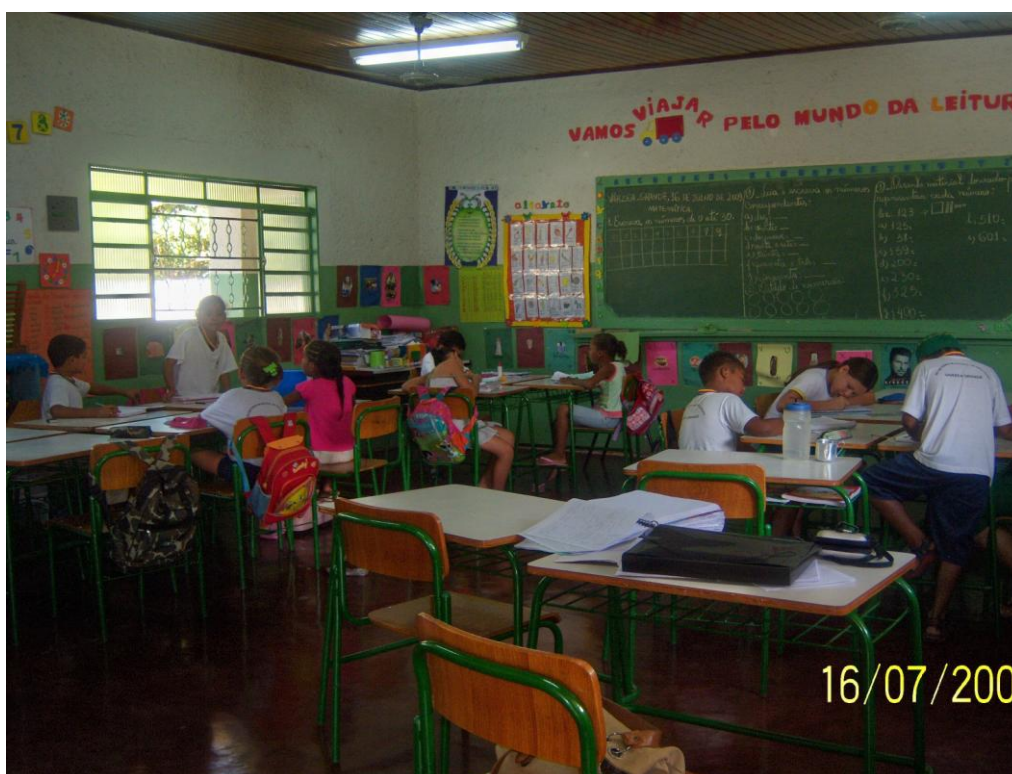
Figura 3 – Escola com classe multisseriada – Organização Espacial

As figuras 3 e 4 permitem averiguar como se compunham as duas realidades, evidenciando diferenças na condução do trabalho: