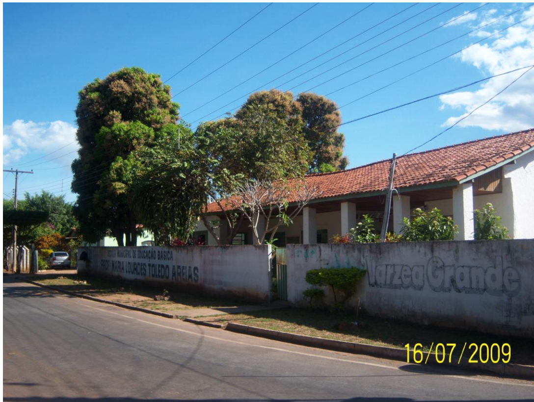
Figura 1 – Escola com classe multisseriada- Escola em que se realizaram as observações pontuais.

cores padrão estabelecidas pela prefeitura: verde e branco, conforme ilustram as figuras a seguir: