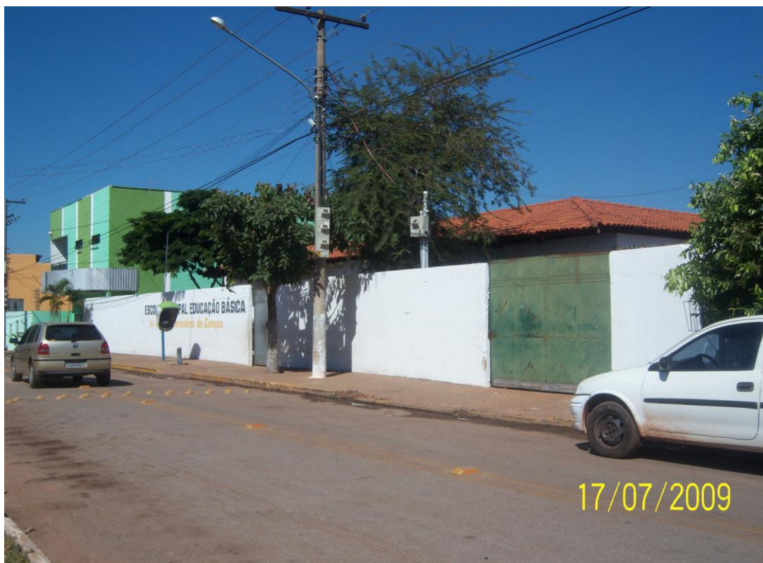
Figura 2 – Escola com classe de 3º ano do CBAC. Escola em que se realizaram as observações pontuais.

Para se ter uma visão geral do perfil das oito professoras que participaram deste estudo, foi composto o quadro 1, a seguir, com informações gerais sobre a origem das docentes, suas formações acadêmicas e tempo de atuação no magistério.