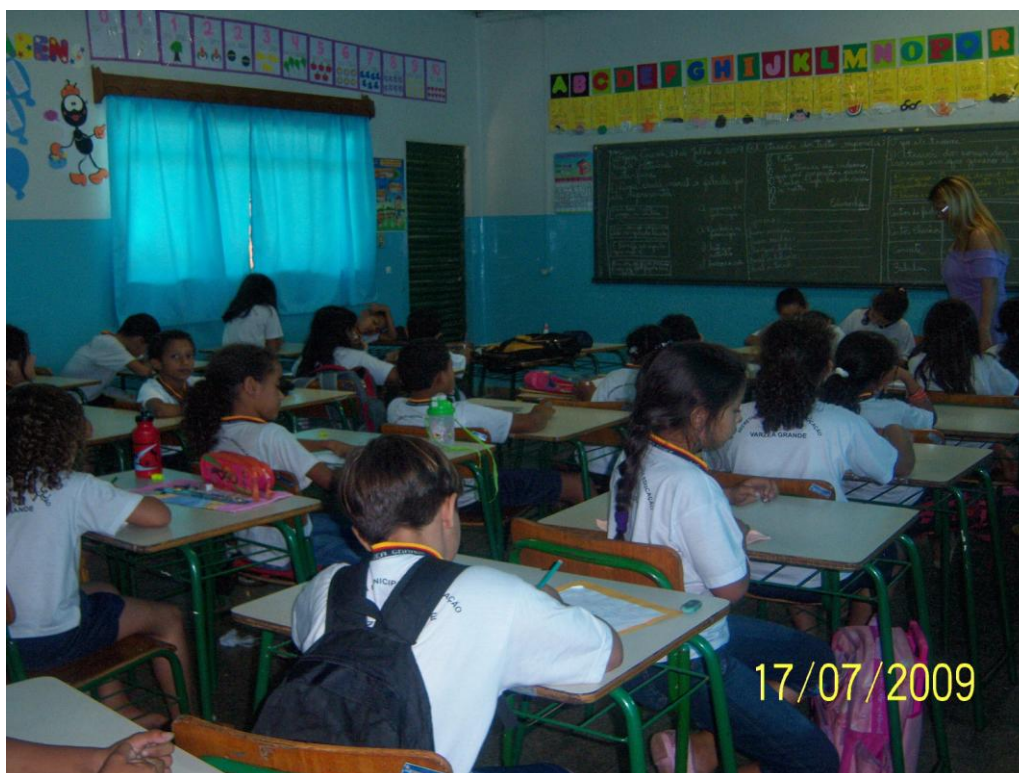
Figura 4 – Escola com classe de 3º ano do CBAC – Organização Espacial

O comportamento dos alunos também se destaca de um contexto para outro. Na classe multisseriada, pareceu mais tranquilo. As crianças transitavam livremente, tanto para resolverem as atividades nos grupos, sempre falando com os colegas, quanto para beber água e ir ao banheiro, ao recreio, ou pedir explicações para a professora. Pelo que se pode observar, o espaço físico permitia essa dinâmica. A classe era organizada em grupos de trabalho, as mesas proporcionavam o agrupamento, a água foi colocada em outra mesa dentro da sala de aula, com acesso a todos os alunos e era mantida fresquinha pela merendeira da escola, como se vê na figura 5.