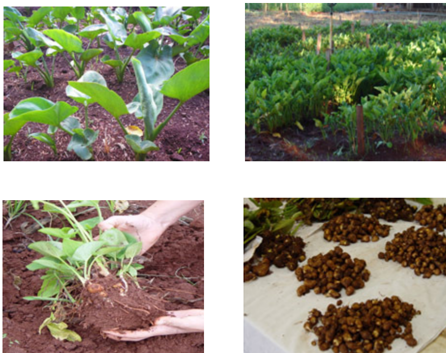
FIGURA 2. Aspecto geral do cultivo e colheita de plantas de Xanthosoma mafaffa Schott (mangarito). UFGD, Dourados- MS, 2006-2007.