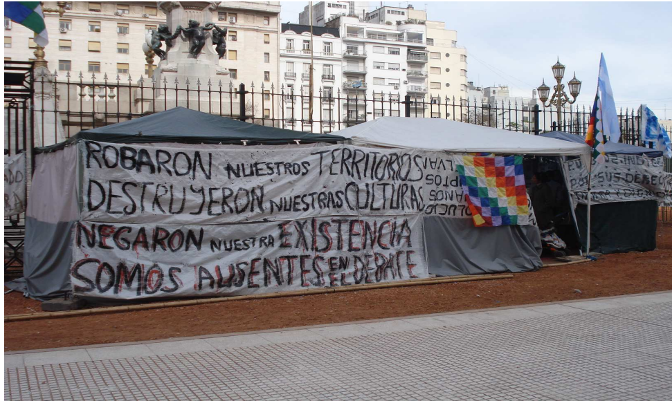
Ilustração 2 - Protesto de trabalhadores na praça do Congresso Nacional em Buenos Aires.