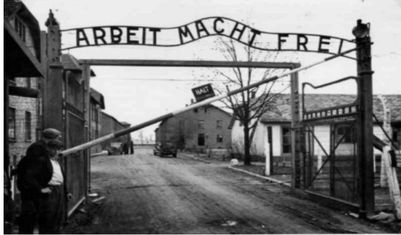
Ilustração 1 - Foto da entrada do campo de concentração nazista de Auschwitz.

Nesse passo, não há como negarmos a importância das relações trabalhistas para a sociedade e para o Estado, considerando que essa é responsável pelo fomento da economia, arrecadação de impostos e capacidade de sustento daqueles que realizam atividade remunerada.