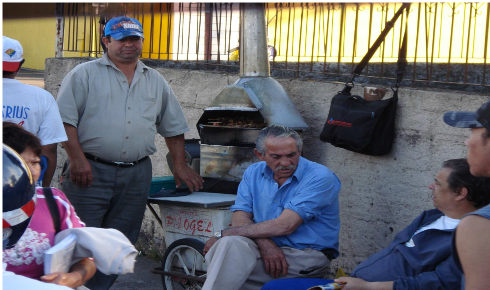
Ilustração 4 - Vendedor de espetinhos em Santa Maria/RS.

Na ilustração 4 uma pequena representação dessa informalidade. Um senhor vende espetinhos numa esquina movimentada de Santa Maria, de forma desorganizada e precária.