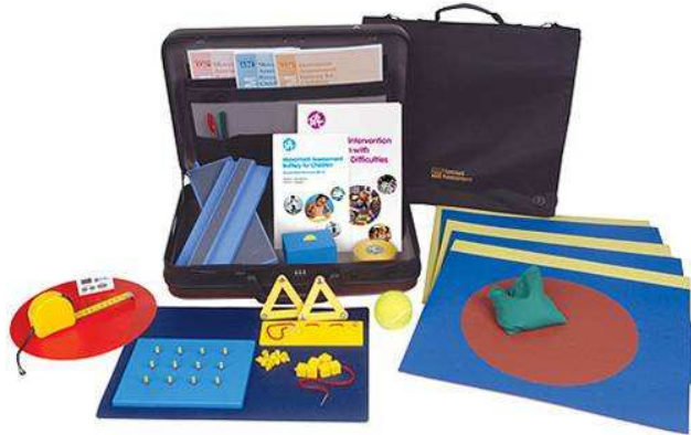
Figura 2 – Instrumento M-ABC2

O teste é administrado individualmente, e leva cerca de 20 a 40 minutos para ser realizado dependendo da idade e da dificuldade motora apresentada pela criança. O presente estudo utilizou as faixas 2 e 3.