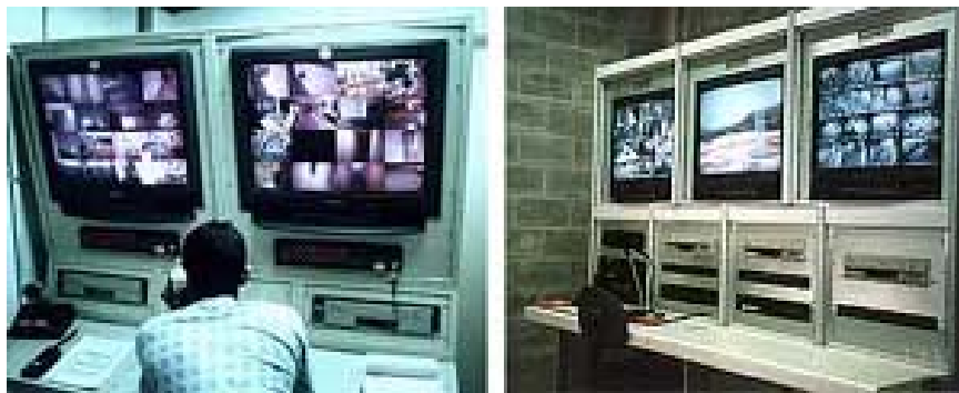
Fig. 4 e Fig. 5: Sistemas eletrônicos de vigilância. À esquerda, Recreio Shopping, Rio de Janeiro. À direita, Penitenciária Dr. Serrano Neves, Presídio Bangu III, Rio de Janeiro.

Dispomos, atualmente, da capacidade tecnológica necessária para monitorar constantemente o cidadão, como insinuou Orwell, que mostra, de forma metafórica, um aparato estatal de vigilância, através da “Grande Tela”, do “Grande Irmão”, das torturas e tensões permanentes em um ambiente de delação. O olhar eletrônico figura em toda parte, com e sem autorização. Numa versão atual simultânea do Big Brother de Orwell e do Panopticon de Jeremy Bentham, poder e conhecimento realimentam-se em um processo circular. A "máquina de visão" deixou de ser um instrumento militar e passou a ser uma tecnologia civil banal; e o "Grande Olho" se torna uma arma do desejo, insaciável por mais informação. Orwell se presentifica como nunca, ante o controle social desse nosso tempo.