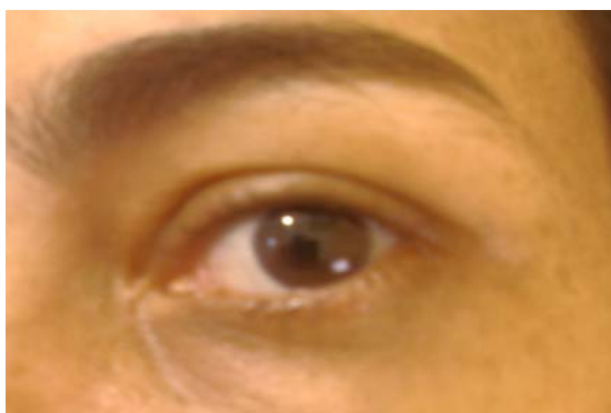
Fig. 10 - O meu olhar vigilante

A sala-de-aula parece um lugar onde o meu olhar assume uma macrodimensão, não sei se por conta da posição física quando falo, sempre de pé, àquelas criaturas sedentas de novidades e aparentemente inertes, no mais das vezes, ou se pela posição mesma de professora, aquela que deve saber e conhecer mais, pelo menos o que está falando, do que aqueles e