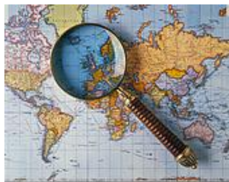
Fig. 2 - Mundo Vigiado

Nunca foi tão fácil e tão barato colher dados sobre indivíduos e sobre a sua vida íntima. O Estado e as organizações privadas mantêm cadastros de informações sobre bens, renda, previdência social, atividade criminosa e outros detalhes, formando grandes bancos de dados sobre os indivíduos. Isto ocorre, basicamente, através da imagética eletrônica - da transmissão de imagens digitalizadas das pessoas, da instalação de câmeras no espaço domiciliar e urbano (muitas vezes sob o consentimento do 'vigiado', que se deleita sobre a super-exposição) e da interceptação / processamento dos dados que cada um gera ao transitar nos diversos sistemas informatizados e redes que constituem a vida social contemporânea.