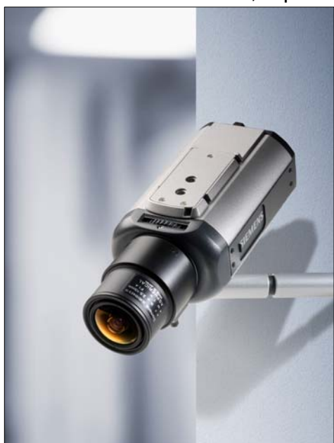
Fig. 7 – Câmera de Vigilância

Sendo o poder o nome dado a uma situação estratégica complexa numa sociedade determinada, que se instaura por meio de determinada “prática discursiva”, a performatividade aqui pretendida é poder.