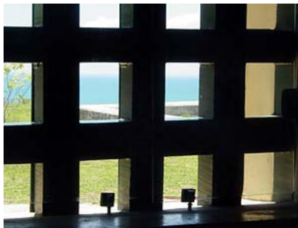
Fig. 6: Prisão de Porto Seguro/BA.