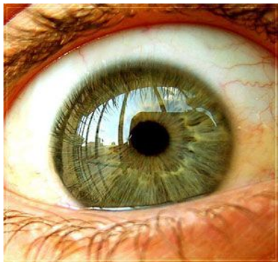
Fig. 1 – Vigilância de todos nós

Quem poderá negar que vivemos em uma sociedade de vigilância? Vivemos, certamente. Mas se antes ela existia de forma mais obscura, agora não só é notória como é estimulada por aqueles que dela fazem parte. Os documentos, dados cadastrais, contas de banco, endereços, sites que acessamos, bens materiais que compramos, tudo isso é sabido por um poder maior, onipotente e onipresente, que tende a reprimir qualquer simples manifestação que implique uma contravenção, um desequilíbrio da ordem social. Esse poder maior se manifesta pelo olhar que não é apenas o olhar proveniente do olho humano, mas o olhar muito mais potente, astuto, veloz e certo dos meios de tecnologia - no caso desta dissertação, os meios ditos de segurança. Assim, sabemos: temos os nossos passos, sentimentos, idéias e atitudes observados e vigiados no dia-a-dia.