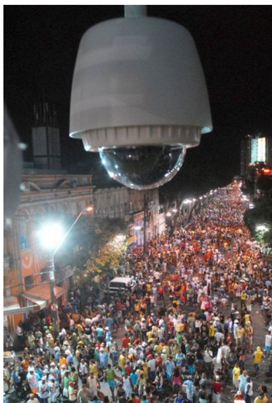
Fig. 8 – Vigilância no Carnaval de Salvador / 2007

Não é sempre que este poder de persuasão é tão bem recolhido como no esforço que a moça da Performance 4 resolve aplicar sobre, e com controle, junto ao seu namorado. Os dois estavam sós. Claro que seguramente vigiados pelas câmeras, ainda que tenham escolhido namorar no banquinho do jardim em vez de namorar nas ruas de Salvador, em pleno carnaval, cuja vigilância foi constante e diretamente anunciada nas mídias impressas e eletrônicas. Escolheram estar ali, realidades corporais de intimidade. Tinham um compromisso entre eles, era lógico ver. O que poderia até legitimar algumas carícias mais excitantes, mais eróticas, mesmo. Mas ela preservou sua privacidade. Ou será que ela se sujeitou a tornar invisível o seu desejo? De fato. Foi mesmo uma ação moral que ela praticou, construindo um lugar de punição e recalque para o seu desejo. Reprimir e submeter a sexualidade à condição de punição tem sido prática comum, frente à simulação de vigilância, real ou simbólica. Assim, a sexualidade opera como um fio de invisibilidade, um marco demarcatório, em que desejo e vontade são, frente à moral vigente, crimes tão repreensíveis quanto o furto, a predação etc.