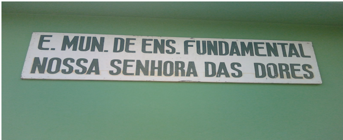
Foto 6: Escola Municipal de Ensino Fundamental Nossa Senhora das dores (Sede Núcleo Três Vendas. Pelotas/RS)