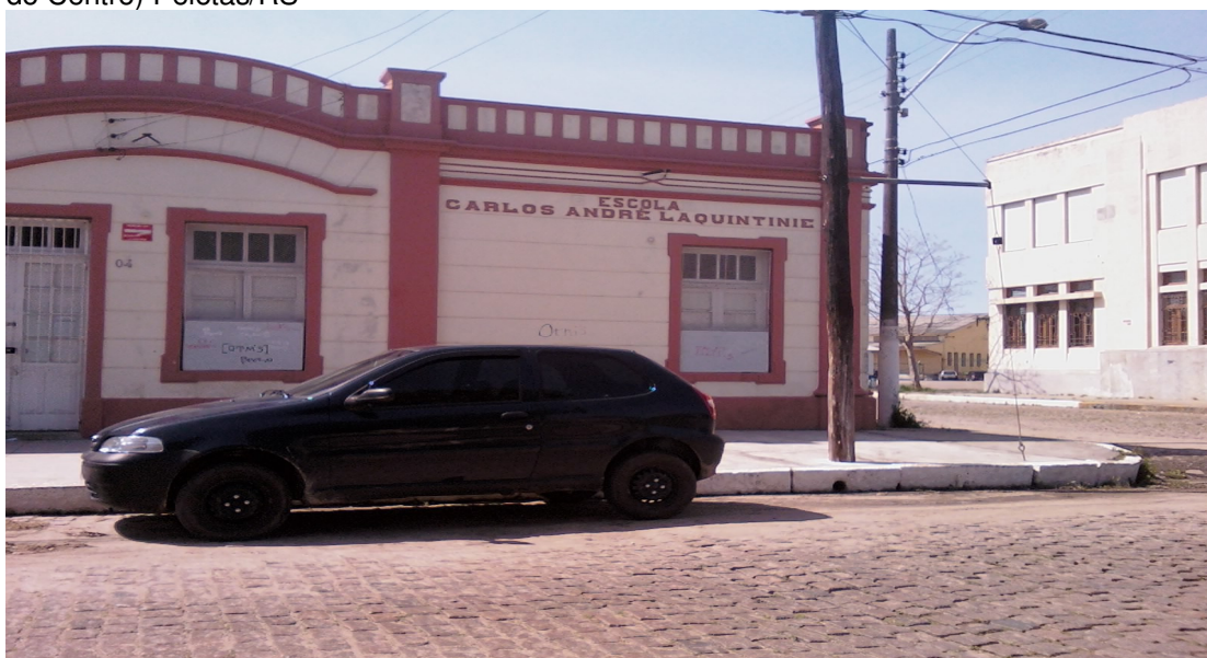
Foto 2: Escola Municipal de Ensino Fundamental Carlos André Laquintinie (Sede do Núcleo do Centro) Pelotas/RS