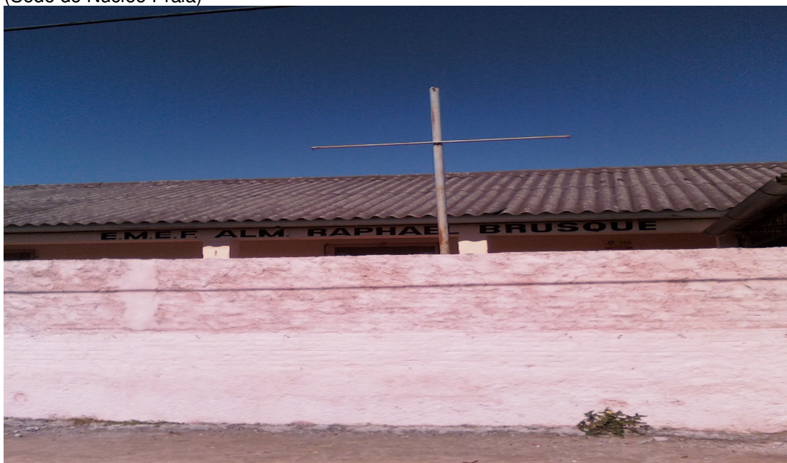
Foto 1: Escola Municipal de Ensino Fundamental Almirante Raphael Brusque.Z3/Pelotas/RS (Sede do Núcleo Praia)