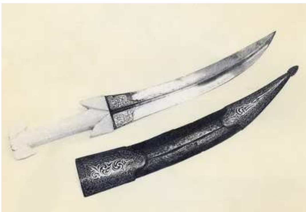
“Em osso, aço, ouro, prata e couro, essa peça é de origem provavelmente persa. A adaga era, mais do que uma arma, um sinal da condição social do portador. Entre os islâmicos, indicava a condição de homem livre” Catálogo da exposição “Armas que não vão à guerra”/Museu Histórico Nacional. Disponível em < www.museuhistoriconal.com.br >. Acesso em 05/06/09.