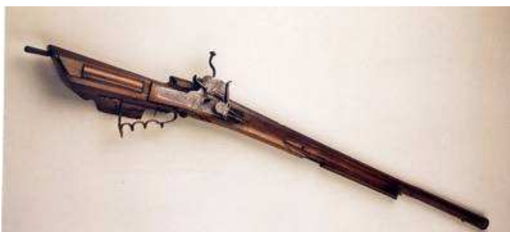
Em aço, latão e chifre, esse mosquete foi fabricado na Alemanha, na segunda metade do século XVII. Fonte: Museu Histórico Nacional. Disponível em< www.museuhistoriconacional.com.br >Acesso em 08/06/09.