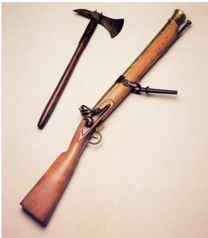
Armas Navais: “BACAMARTE, em madeira, latão e aço, fabricado na Inglaterra no início do século XIX. MACHADINHA DE ABORDAGEM, em aço e madeira, século XIX. “Estas peças são tipos de armas usadas em navios de guerra para abordar ou repelir abordagens de outros navios. Consta que foram usadas por marinheiros brasileiros na Batalha do Riachuelo, episódio da Guerra do Paraguai, em 1865”.

3- Bacamarte: “Cravina curta de boca muito larga, que se carrega com muitas balas e quartos” 108 . Possui a extremidade do cano mais larga do que a culatra. Esse tipo de arma era difundido entre a população marianense no início do século XVIII, especialmente entre os membros da elite.