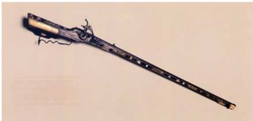
“Em aço, madeira, marfim e madrepérola, fabricado na Europa central no final do século XVI, pertenceu ao Rei D. João VI. Arma de caça de alto luxo, provavelmente austríaca, decorada com gravações de motivos bélicos, mostrando soldados magiares, turcos e europeus, possivelmente narrando uma história ou biografia. Integrou as coleções da Coroa Portuguesa”.

Esse tipo de arma possui aproximadamente 1.2 m de comprimento- ou cinco palmos-, 6 quilos de peso (HESPANHA, 2003) e seu poder de alcance gira em torno de 45 metros (COTTA, 2005). De acordo com o militar português Luis Mendes de Vasconcelos, citado por Hespanha (2003), o material que complementava a arma de um arcabuzeiro era: pólvora, balas, corda, frasquinho, frasco e porta frasco. O frasco deveria ser colocado sempre no porta-frasco para facilitar o carregamento da munição, e este último acessório nunca devia ser colocado na cinta, pois no momento de necessidade o soldado poderia ter dificuldade para encontrá-lo (Ibidem). Analisando a situação do armamento em Castela, no ano de 1588, I.A.A. Thompson, citado por Lópes, verificou que o arcabuz: