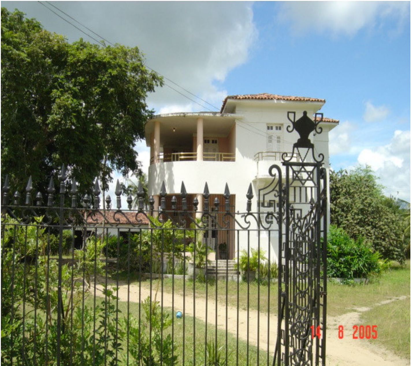
Vista parcial da residência de Francisco Heráclio do Rêgo, localizada na Av. Capibaribe, em Limoeiro. Fotografia de agosto de 2005.