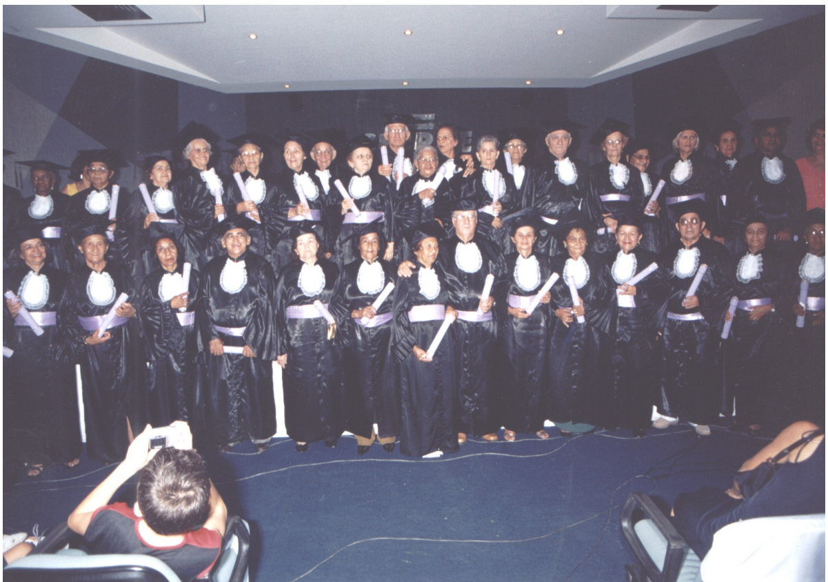
Solenidade de Formatura