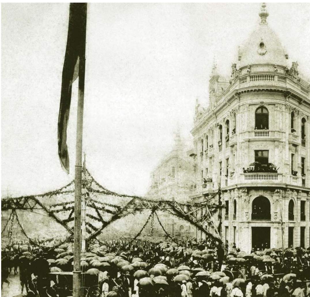
Inauguração da avenida Central, 15/11/1905, foto: Augusto Malta. Museu da República, IPHAN. Fonte secundária: O Porto e a Cidade: O Rio de Janeiro entre 1565 e 1910 , p. 186. (Atentar para o detalhe dos enfeites criticados por Bilac na crônica publicada na Gazeta de Notícias , 19/11/1905 – cf. BILAC: 1996, p.267.)

(...) a avenida era como uma noiva linda, de que uns querem apanhar bem o jeito, a maneira, a impressão das últimas horas de solteira, e a quem outros se contentam de olhar, de alma aberta, felizes e radiosos unicamente de vê-la radiosa e feliz. (...) (O Paiz, 16-11-1905)