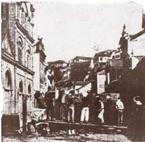
Barricada da Saúde.

Bilac degrada os revoltosos comparando-os a vermes, ignorantes, que não precisam de exemplos para devastarem uma cidade. Além disso, uma das causas dessa “desgraça” é o analfabetismo — e o Rio de Janeiro de então, assim como o Brasil, estava cheio deles. Na opinião do cronista, é fácil convencer a gente pobre, ingênua, ignorante e analfabeta das estalagens com idéias descabidas, tais como a que dizia que “o governo queria vaciná-la com caldo de ratos mortos de peste...” (BILAC: 1996, p. 258). E é justamente por isso que ele defende a obrigatoriedade da instrução primária, pois só assim não haveria mais ingenuidade e ignorância entre a gente pobre e humilde para que os ambiciosos dela se aproveitassem. Também não haveria mais levantes militares 34 , nem assassinos assalariados, como os bandos de capoeiras. Com instrução, todos aceitariam a vacinação e, com isso, todos lucrariam — “desde a gente que trabalha até a gente que governa, desde a limpeza das ruas até a nossa dignidade de povo, desde os inofensivos postes de iluminação pública e as pobres árvores até o crédito do país” 35 (BILAC: 1996, p. 259).