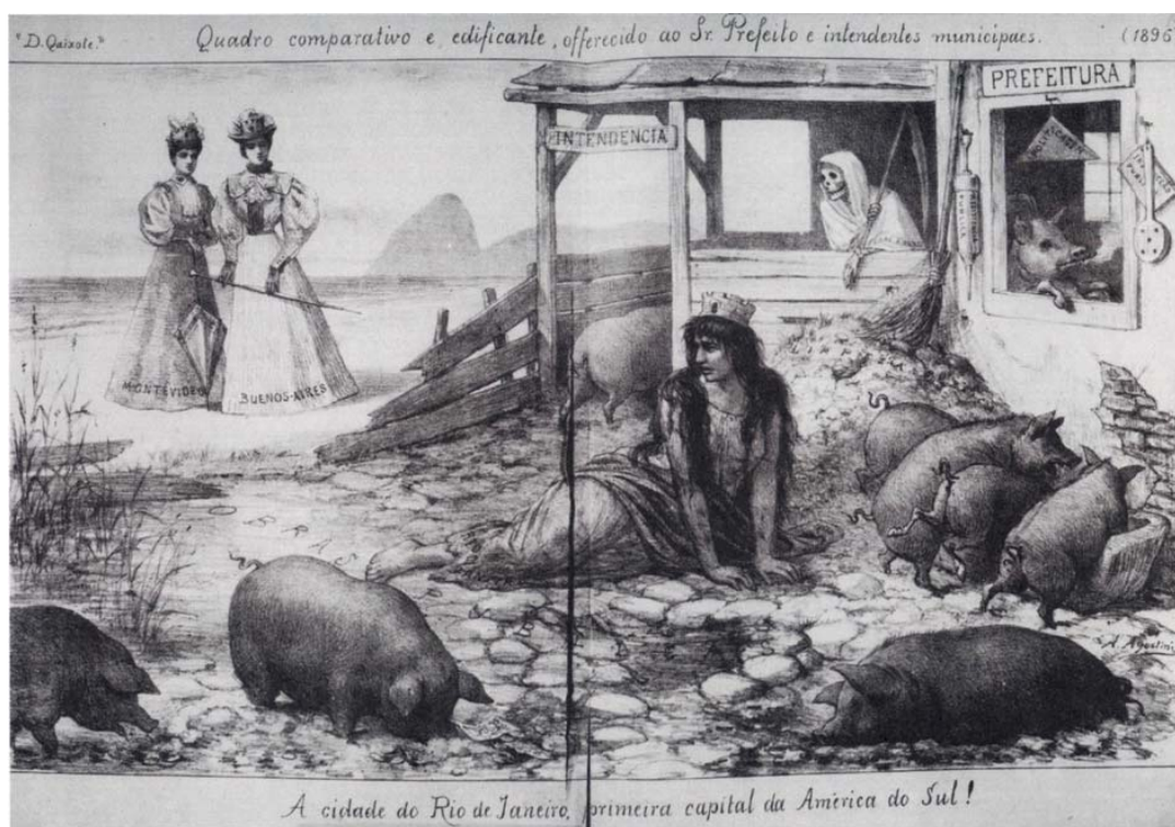
Charge sobre o Rio de Janeiro – Fonte: Dom Quixote, n° 69, 08/08/1896 - Biblioteca Nacional. Fonte secundária: Maurício de Abreu. “Evolução Urbana do Rio de Janeiro”. Rio de Janeiro. IplanRio. 1997. p.61.

Além disso, na época, Buenos Aires havia se transformado “na primeira cidade moderna e cosmopolita do continente sul-americano” (BENCHIMOL: 1992, p. 201). Por esse motivo, Bilac não era o único cronista a ver nas reformas ocorridas na capital argentina um exemplo a ser seguido: porto modernizado, grandes avenidas, longas ruas retas. Em síntese, a capital argentina era a nossa grande rival e, dentro do contexto sul-americano, importava superar o atraso para tornar-se a Paris tropical — sonho do cronista.