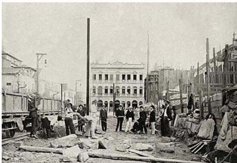
Demolições para a construção da avenida Central, 1904-1905

O trabalho enaltece o homem. (Provérbio popular)