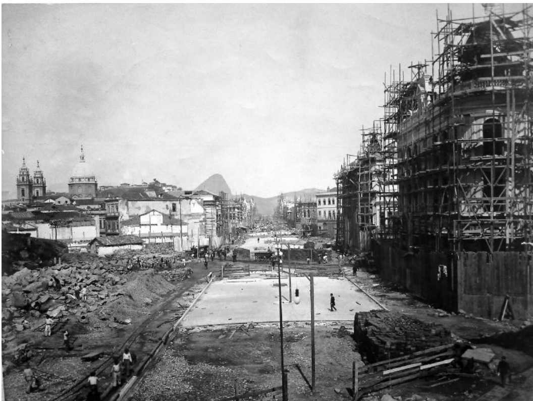
Avenida Central, 1905.

Em uma crônica de dezembro de 1903, portanto antes da inauguração, o cronista vislumbrava: