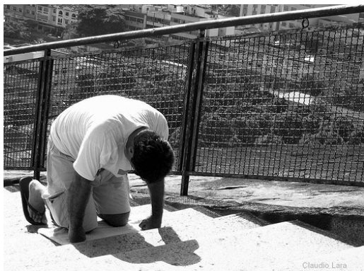
Fiel subindo de joelhos as escadarias do santuário, s/data.

Mesmo com a desaprovação da Igreja, até hoje ainda vemos, durante os festejos, devotos subindo de joelhos os degraus da famosa escadaria, como pagamento de promessas.