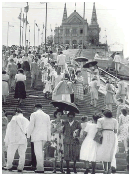
Festa da Penha, 1947. Disponível em: http://www.omelhordobairro.com.br/riodejaneiro-penha/page11947.htm

A festa em homenagem a Nossa Senhora da Penha acontece no mês de outubro.