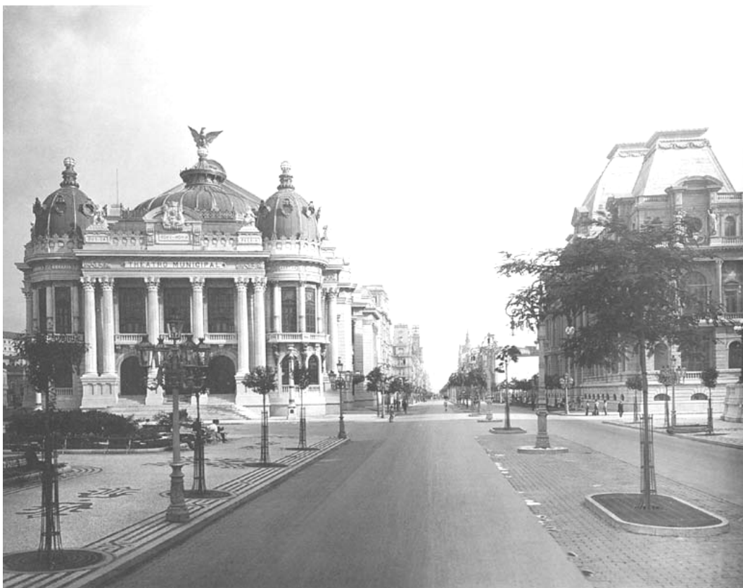
Avenida Central e Teatro Municipal. 1910. 1910.