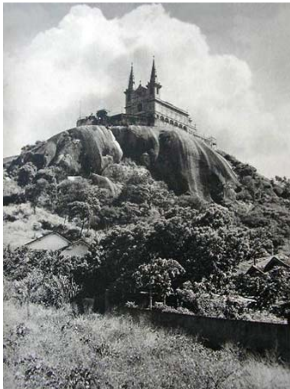
Igreja da Penha, década de 1930, foto: Peter Fuss. Créditos: Internet, escaneado por Milton Teixeira do original FUSS, Peter. Brasil - Orbis Terrarum . Berlim: Atlantis Verlag, 1937. Disponível em: http://www.vivercidades.org.br/publique_222/web/cgi/cgilua.exe/sys/start.htm?inoid=1415&sid=25 http://www.vivercidades.org.br/publique_222/web/cgi/cgilua.exe/sys/start.htm?inoid=1415&sid=25

A festa em homenagem a Nossa Senhora da Penha acontece no mês de outubro.