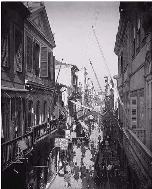
Rua do Ouvidor. Foto: Marc Ferrez. 1890.

Disponível em: http://www.jblog.com.br/rioantigo.php?blogid=109&archive=2009-08