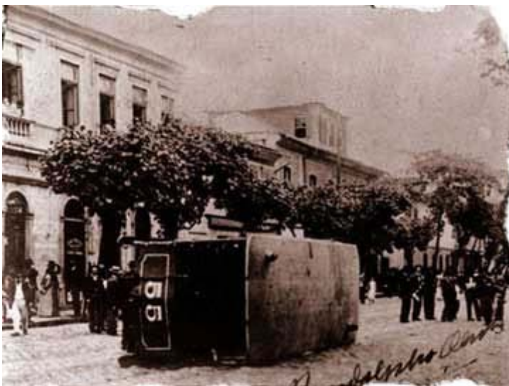
Bonde tombado pelo povo durante as manifestações populares no Rio de Janeiro, novembro/1904.

Em uma defesa contundente das medidas governamentais — causa inicial da revolta —, o cronista se pergunta o porquê de tanta fúria: