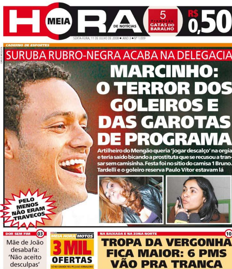
Figura 2: Capa da edição de 11 de julho de 2008

O jogador de futebol Marcinho havia, segundo o jornal, participado de uma orgia e não pretendia usar proteção sexual com as prostitutas, tendo agredido uma das mulheres. Pode se referir, contudo, no balão que recortamos para a SD39, ao comportamento do jogador Ronaldinho, que fora parar nos meios de comunicação tempos antes por supostamente ter se envolvido com transexuais que se prostituíam. Ameniza-se, com a expressão “pelo menos”, a agressão de Marcinho, personagem da manchete: embora ele tenha participado da orgia e tenha ido parar na delegacia por comportamento violento, pelo menos não havia tido parte em nenhuma relação homossexual. Em toda capa do Meia Hora , vai-se formando a imagem de um leitor e também a imagem de seus “valores” culturais, de suas discriminações: dos sentidos que se opõem a outras formações discursivas e ideológicas. Aqui entra em jogo a discriminação sexual. A homossexualidade seria, para as massas populares imaginadas na instituição jornalística, mais condenável que a agressão física.