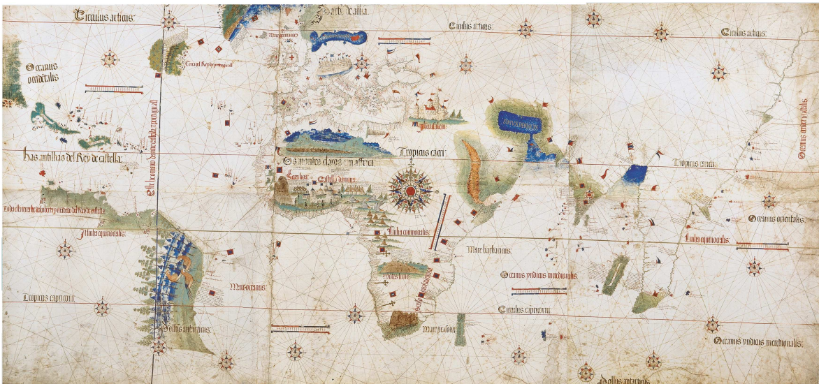
Fig. 4 Planisfério de Cantino (escola portuguesa), anônimo (1502)