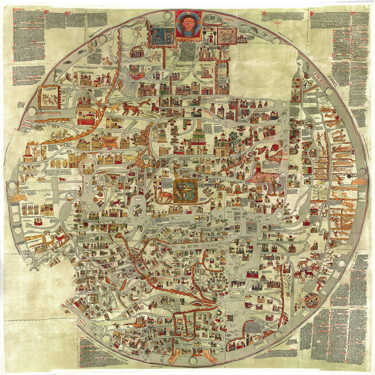
Fig. 2 Mapa-múndi de Ebstorf (meados do século XIII)