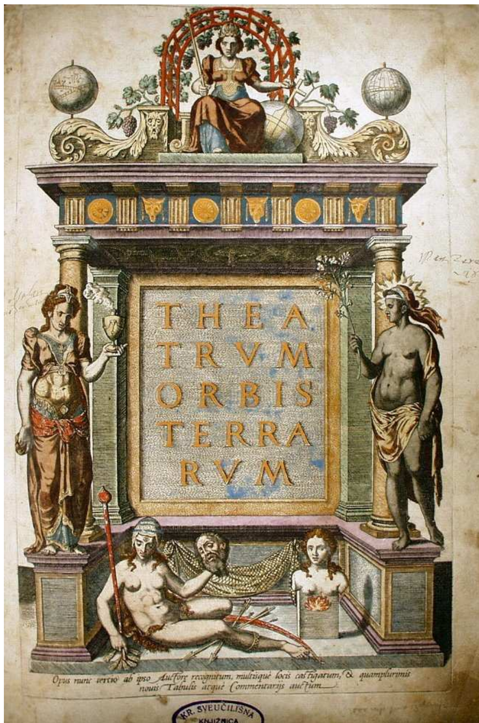
Fig. 1 Theatrum Orbis Terrarum , de Abraham Ortelius (1570).