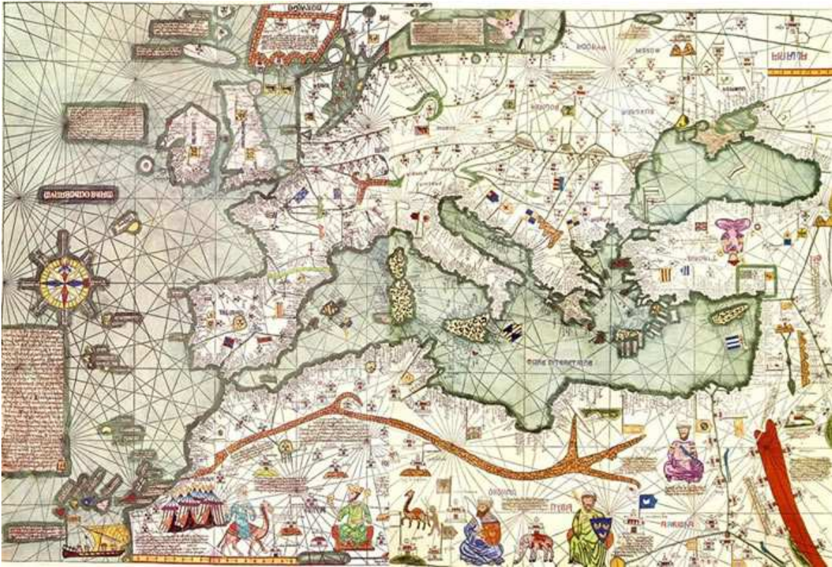
Fig. 3 Atlas Cataão, de Abraão Cresques (1375)