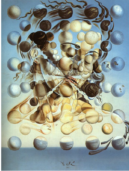
Figura 02 – Galatea de las esferas, 1952.

Os quadros produzidos por Salvador Dalí por meio do seu método são capazes de produzir no expectador uma dupla interpretação. As obras mais famosas produzidas por Dalí, provavelmente as melhores, foram realizadas nas décadas de 20 e 30 utilizando o seu método que fora batizado por ele como paranoico-crítico. O método envolvia várias formas que eram capazes de produzir associações irracionais, envolvendo imagens que variavam conforme o olhar do expectador. Assim, com a utilização desta técnica, Dalí era capaz de fazer com que um aglomerado de objetos fosse transformado num rosto de uma mulher.