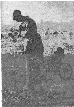
Figura 03 – fragmento do quadro L'angelus .

Dalí relaciona o comportamento de alguns insetos e aracnídeos, cujas cópulas terminam com a fêmea devorando o macho, com o que procura exprimir o quadro, L'angelus , de Millet. A relação do canibalismo dos insetos, nas hipóteses de Dalí, com a posição dos personagens da tela faz alusão, ao comparar a mulher do quadro com a fêmea do louva-deus, à posição da fêmea devoradora e canibal, expressão do desejo humano.