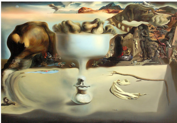
Figura 01 – Aparição de um rosto e frutífera numa praia, 1938.