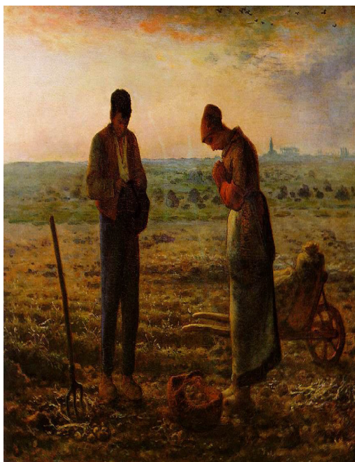
Figura 05 – Quadro, L'angelus , de Jean François Millet (1857-59).