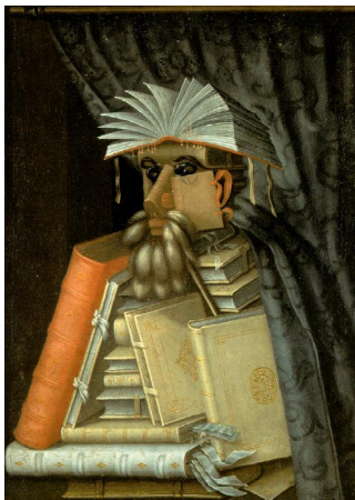
Figura 05 – O bibliotecário de Giuseppe Arcimboldo.