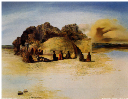
Figura 06 – Paranoic Visage de Salvador Dalí, 1935.

Tanto o quadro, O bibliotecário , de Arcimboldo como, Paranoic visage , de Dalí 24 são trabalhos que são capazes de produzir dupla interpretação. No quadro de Arcimboldo podemos perceber um amontoado de livros ou também a figura de uma pessoa, que no caso seria o bibliotecário. No quadro de Dalí podemos verificar na posição horizontal um grupo de pessoas em frente a uma cabana, mas se invertemos a imagem e olharmos na vertical podemos constatar a presença de um rosto. Esse rosto seria o que Dalí menciona como rosto paranóico que surge apenas por meio do exercício da visão.