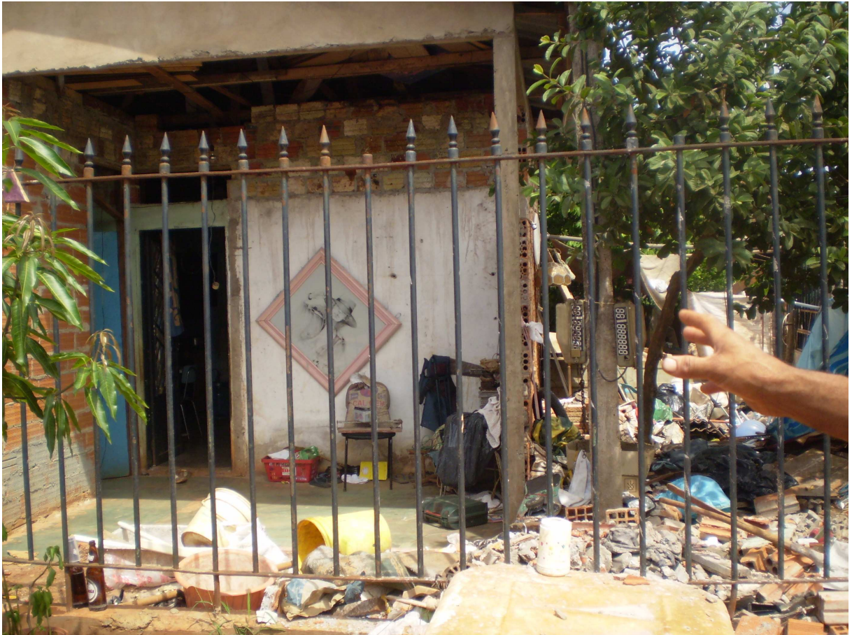
IMAGEM 3 – Residência de catador não cooperado. 03 de março de 2009.

Na Imagem 3 é possível visualizar parte da casa de Arlindo, que está sendo construída por ele mesmo: