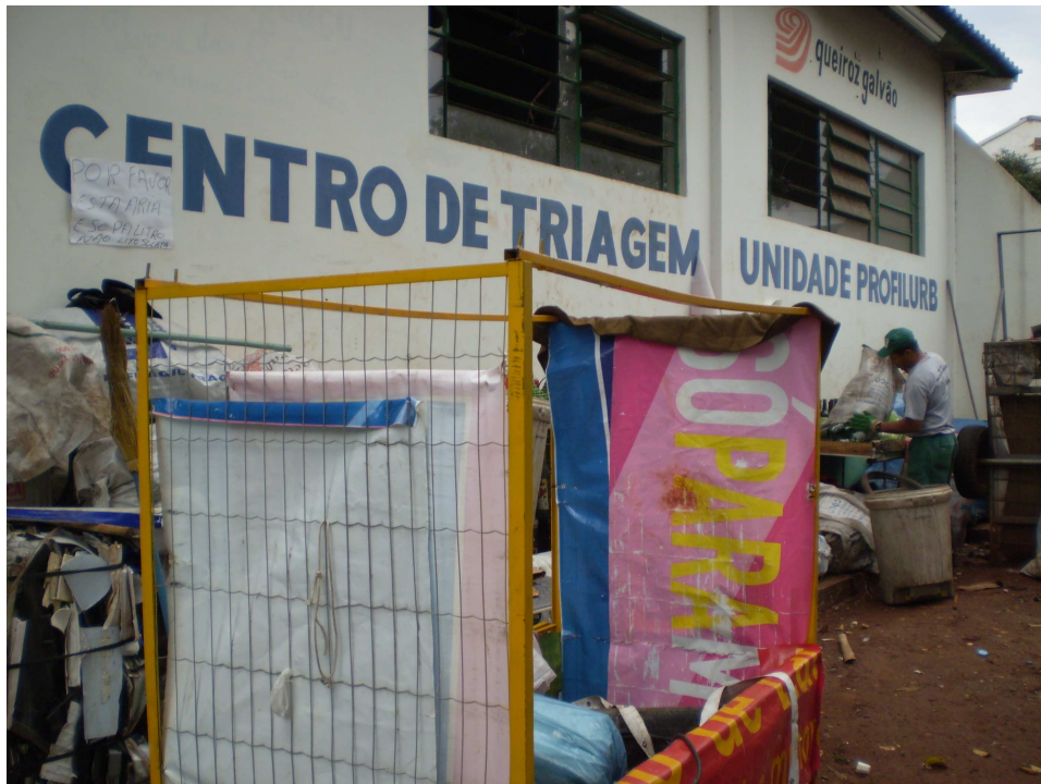
IMAGEM 4 – Centro de Triagem Profilurb II. Fonte: Fotografado por Sônia Pelisser, 23 de julho de 2008.