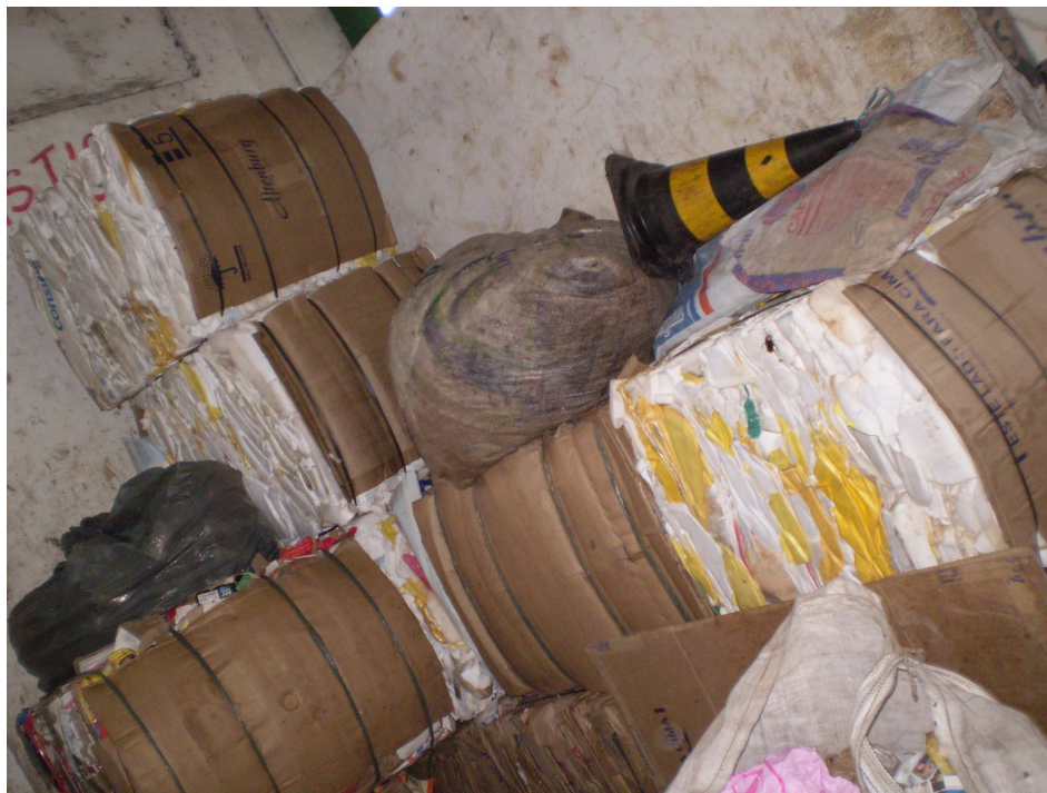
IMAGEM 5 – Centro de Triagem Profilurb II – Armazenamento de materiais para venda (interior do barracão). Fonte: Fotografado por Sônia Pelisser, 23 de julho de 2008.

Isto demonstra a percepção deste coordenador, assim como foi relatado por outros catadores, sobre as crises anuais que afetam o setor, sobretudo, devido à queda do valor dos materiais recicláveis nestes contextos de crise.