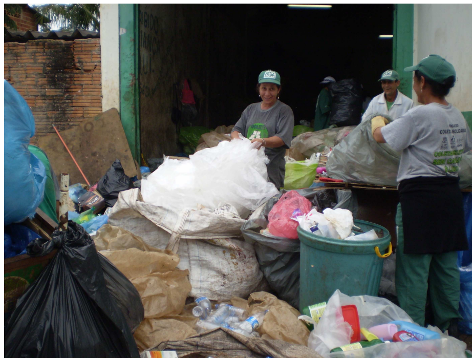
IMAGEM 6 – Centro de Triagem Profilurb II – Seleção de materiais coletados. Fonte: Fotografado por Sônia Pelisser. 23 de julho de 2008.

materiais ao final do ano são relatadas pela maioria dos catadores, fator intensificado, segundo eles, a partir do acirramento da crise do capitalismo eclodida em 2008. Pode-se visualizar na Imagem 6 mulheres efetuando o trabalho de seleção dos materiais recolhidos: