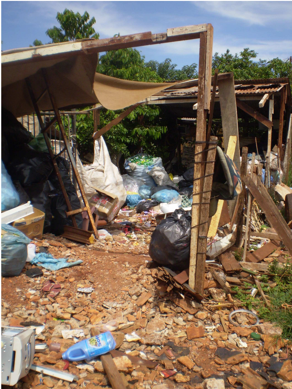
IMAGEM 7 – Espaço ao lado da casa de catador não cooperado, utilizado para seleção e eventual armazenamento de materiais.

Na Imagem 7 é possível perceber as diferenças: