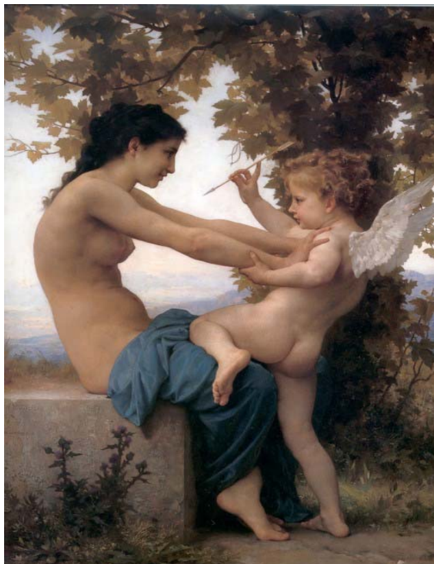
Fig. 3 - Jovem defendendo-se de Eros Bouguereau, 1905.

desejo, ela rejeita essa possibilidade de um novo amor, ao impor as mãos sobre os ombros de Eros, afastando-o de si.