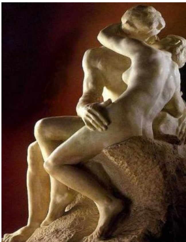
Fig. 8 – O Beijo 8 Auguste Rodin, 1886.

Na arquitetura, os engenheiros e arquitetos, dentro desse novo contexto, procuram adequar as suas obras às novas necessidades urbanas, frutos do desenvolvimento industrial. Os palácios e templos imponentes são substituídos por casas, fábricas, armazéns, estações ferroviárias, lojas, escolas, bibliotecas, hospitais. Com o expressivo avanço da técnica contemporânea, utilizando materiais até então inexplorados, como o ferro, o vidro, o cimento e o concreto armado, os arquitetos estão diante de novas perspectivas. Os engenheiros mais importantes desse período são: Wilkinson que, em 1775, construiu a primeira estrutura metálica, ou seja, uma ponte de ferro sobre o rio Seven, na Inglaterra; Labrouste, em 1843 constrói uma cobertura com ferro e aço para o Salão da Biblioteca Santa Genoveva, em Paris; Em 1851, o inglês Paxton constrói com ferro e vidro o colossal Palácio de