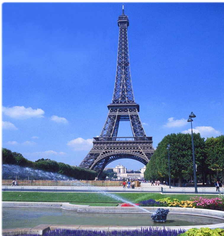
Fig. 6 – Torre Eiffel Gustave Eiffel, 1889.

Cristal . E Gustave Eiffel 9 (fig. 9), em 1889, ergue a monumental torre que levará seu nome e que se tornará um dos principais símbolos da cidade de Paris.