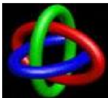
Fig.2 - Nó borromeano