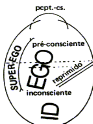
Fig. 1- Esquema do aparelho psíquico

Em 1953, o psicanalista francês, Jacques Lacan, percebendo que alguns discípulos estavam equivocados quanto à interpretação de muitos conceitos freudianos, propõe um retorno à obra do mestre, a fim de recuperar, entre outros, o conceito de inconsciente que, segundo ele, ficou relegado a um segundo plano. A partir dos escritos de Freud, Lacan amplia a teoria psicanalítica, estabelecendo uma estreita relação desta com a Linguística de Ferdinand de Saussure e a Antropologia de Claude Lévi Strauss, em que se apoia para formular o axioma o inconsciente é estruturado como uma linguagem (LACAN, 1998, p.25), “por meio do qual Lacan trouxe a psicanálise de volta a seu campo específico — o da linguagem —, do qual precisamente os analistas pós-freudianos haviam se afastado.” (JORGE, 2005, p.65). Para Lacan, portanto, são as leis da estrutura significante que regem o inconsciente. Sendo assim, o campo de ação da psicanálise situa-se na fala, onde o inconsciente se revela, através dos fenômenos que surgem nas lacunas das manifestações conscientes: o sonho, o lapso, o chiste, o ato falho, o esquecimento, denominados pelo psicanalista francês de formações do inconsciente , e os sintomas.