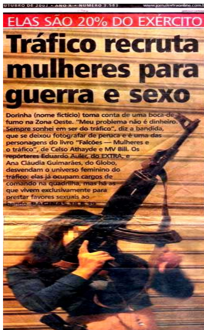
Jornal Extra, 28 de Outubro de 2007.

O capítulo de estréia foi dedicado a apresentação do tema de um modo geral. O Jornal Extra do dia 28 de outubro de 2007 trazia a seguinte manchete em sua primeira página: