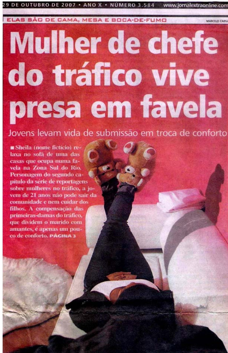
Jornal Extra. 29 de outubro de 2009.

No segundo dia da série mais uma manchete ocupava boa parte da capa.