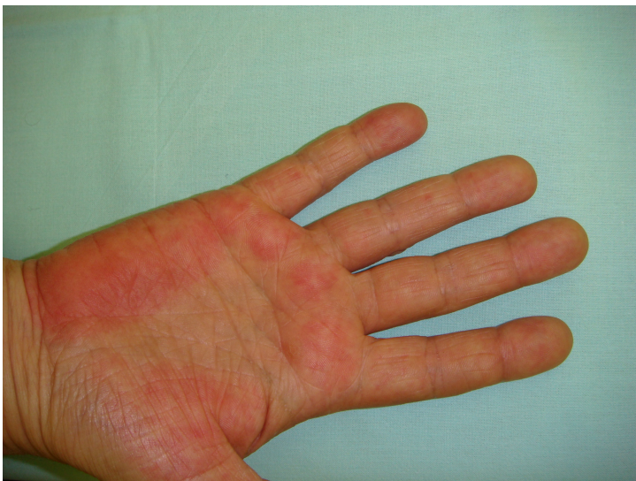
Figura 7. Eritema palmar em paciente com insuficiência hepática crônica.

eritema palmar que não são específicos, podendo ocorrer também na artrite reumatóide e em outras doenças internas. 163 Pode ser de aspecto moteado ou homogêneo, ocorre principalmente na região tenar das palmas e é muito freqüente nos pacientes com insuficiência hepática crônica (Figura 7). 159