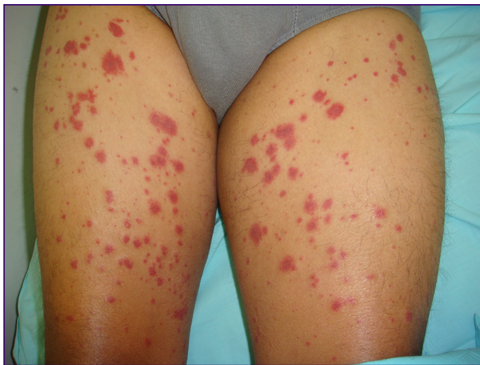
Figura 1. Púrpura palpável em um paciente com CM.

As lesões cutâneas (Figura 1) são as manifestações clínicas mais comuns da CM. 39,42,43 Púrpura ortostática e palpável é geralmente intermitente, com dimensões e extensões variando de petéquias isoladas a lesões purpúricas difusas, geralmente complicadas por úlceras nas pernas e nas proeminências maleolares. Na maioria dos pacientes, os repetidos episódios de púrpura evoluem para áreas de hiperpigmentação. Estas alterações são consequência direta da vasculite com possíveis cofatores como insuficiência venosa crônica, estresse físico, repouso prolongado e baixas temperaturas. 39 A púrpura palpável, isto é, com vasculite leucocitoclásica ocorre em mais de 89% dos pacientes com CM e HCV-positivos. 41