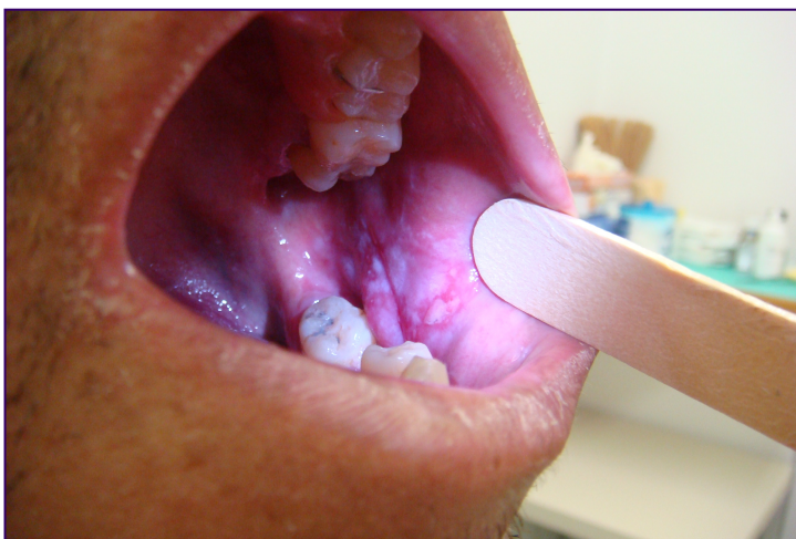
Figura 5. Placas esbranquiçadas e de aspecto rendilhado de LP oral.

A prevalência de LP é em torno de 1 a 2% na população geral. 69