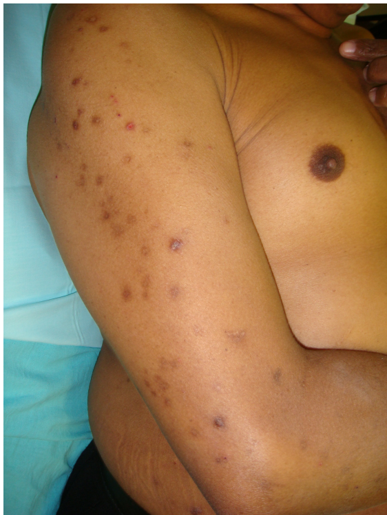
Figura 6. Prurigo provavelmente relacionado ao HCV.

Com relação à associação de urticária e a infecção pelo HCV, os achados são mais controversos. Em 1996, Kanazawa e colaboradores 150 publicaram um estudo caso-controle afirmando que o HCV poderia ser uma causa significativa de urticária. Neste estudo, 24% dos 79 pacientes com urticária eram positivos para o HCV. Mais recentemente, dois estudos contradisseram este achado. Cribier et al , 151 na França, área de alta prevalência de HCV, avaliaram 110 pacientes com urticária e acharam taxas de infecção pelo HCV similares à população geral. No Irã, área de baixa prevalência do HCV, também não há envolvimento deste vírus em 53 pacientes com urticária avaliados. 152