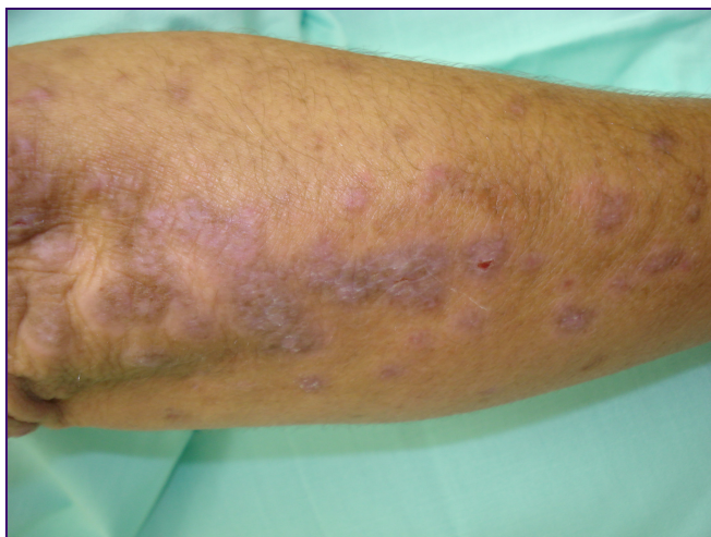
Figura 3. Pápulas violáceas e poligonais características de LP.

O líquen plano (LP) é uma doença inflamatória de pele e mucosas e caracteriza-se pela presença de pápulas poligonais, eritemato-purpúricas, extremamente pruriginosas e com padrão reticulado com finas linhas esbranquiçadas chamadas de estrias de Wickhan (Figura 3 e 4). Comumente acomete superfícies flexoras dos antebraços e punhos, dorso das mãos, face anterior das pernas, área pré-sacra e pescoço. O envolvimento da mucosa oral e genital é comum e, nestes sítios, apresenta-se como pápulas esbranquiçadas e reticuladas que podem evoluir com erosões e ulcerações dolorosas (Figura 5). 1 Tanto na pele, quanto nas mucosas, as lesões podem ser hipertróficas. O acometimento dermatológico pode também comprometer unhas, couro cabeludo, face e áreas não-mucosas das genitálias. O acometimento mucoso pode ocorrer também no nariz, garganta, esôfago, estômago e trato genital. 69