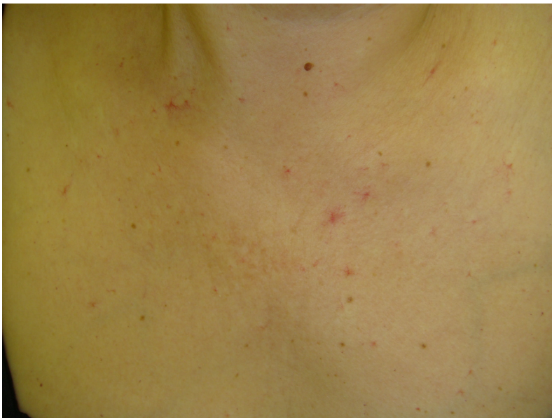
Figura 8. Múltiplos hemangiomas aracneiformes no tórax anterior de uma paciente com insuficiência hepática crônica.