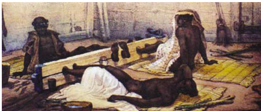
JEAN-BAPTISTE DEBRET. Negros no Tronco, c. 1834. Litogravura, Estampa 92, Prancha 45. DEBRET, 1989 [1834].