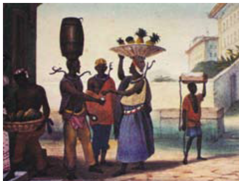
JEAN-BAPTISTE DEBRET. O Colar de Ferro (castigo dos fugitivos), c. 1834. Litogravura, Estampa 89, Prancha 42. DEBRET, 1989 [1834].