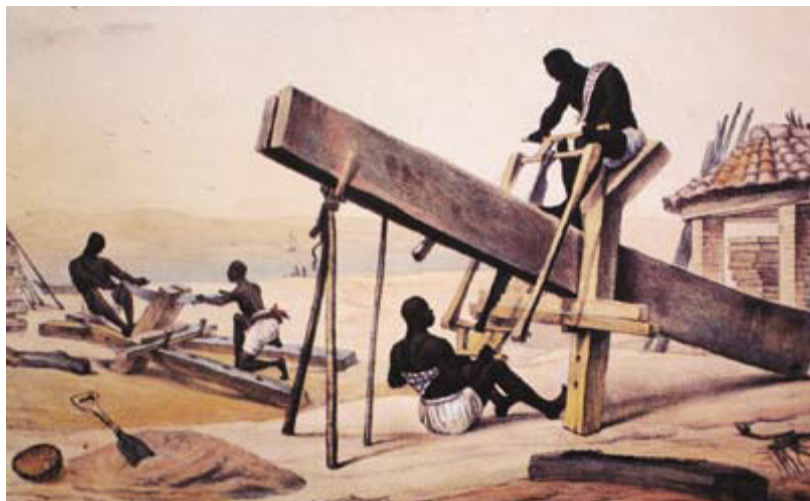
JJEAN-BAPTISTA DEBRET. Negros serradores de tábuas, c. 1834. Litogravura, Estampa 66, Prancha 18. DEBRET, 1989 [1834].

Os traços eurocêntricos da obra de Debret, ao retratar os africanos escravizados em suas diferentes configurações, podem ser analisados também em