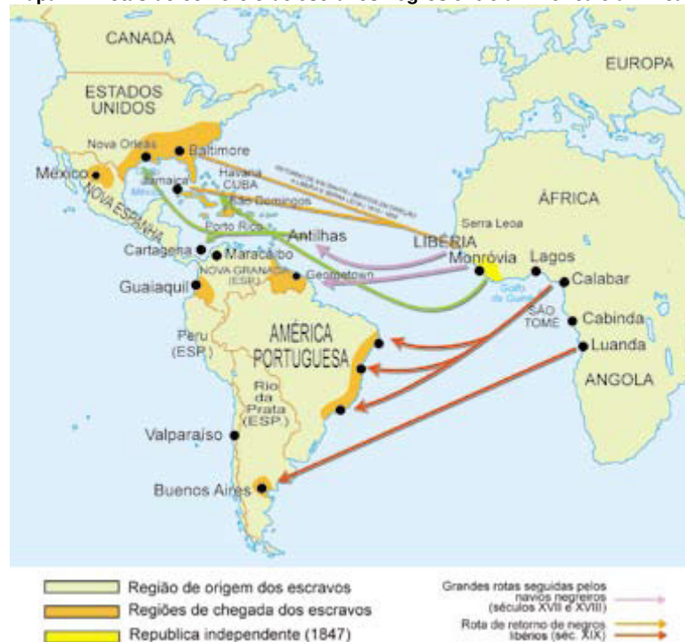
Mapa 1 – Rotas do comércio de escravos negros entre a América e a África

Nesta pesquisa consideramos que este mapa está associado ao discurso histórico nacionalista acrítico: o Brasil é o mesmo, ontem, hoje e sempre. Pois além dos equívocos na técnica por não apresentar escala, fonte, rosa dos ventos, indicação do norte, a representação da América Portuguesa é anacrônica incluindo inclusive o Acre. Ponderamos que, em relação à didática, este mapa está inserido no texto como um recurso que se dirige aos sentidos e, carrega algumas condições formuladas por Rüsen (1997), buscando instigar os alunos para além da ilustração, principalmente ao apresentar uma rota de retorno de escravos libertos no século