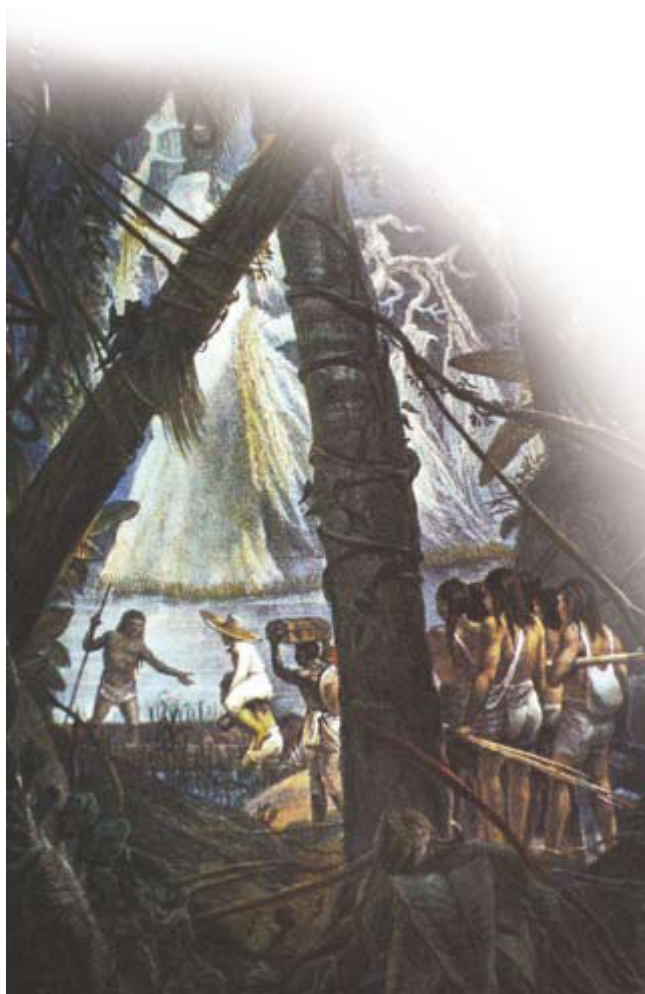
JEAN-BAPTISTE DEBRET. Índios Guaianases, c. 1834. Litogravura, Estampa 15, Prancha 13. DEBRET, 1989 [1834]. (PARANÁ(g), 2006, p. 76)