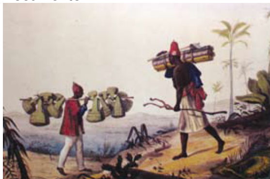
JEAN-BAPTISTE DEBRET. Vendedor de palmitos – Vendedor de samburás, c. 1834. Litogravura, Estampa 65, Prancha 17. DEBRET, 1989 [1834].