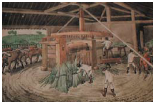
HERCULE FLORENCE, Engenho de Cana - São Carlos, 1840, aquarela, c.i.d. 21 x 31,5 cm.