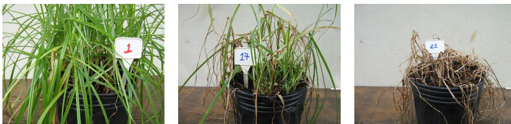
Figura 02 – Aspectos da plantas de Cyperus rotundus nos tratamentos (i) sem aplicação do glifosato, (ii) sem aplicação do fitoregulador e (iii) com aplicação do fitoregulador dois dias antes da aplicação do herbicida.

Na Tabela 7 estão apresentados os resultados das análises de variância dos dados referentes ao número e biomassa seca de tubérculos de tiririca por vaso e teste da viabilidade dos mesmos pelo teste do Tetrazólio. Apenas foram verificados efeitos de doses do glifosato, sem qualquer influência significativa da aplicação do ácido giberélico em qualquer época.