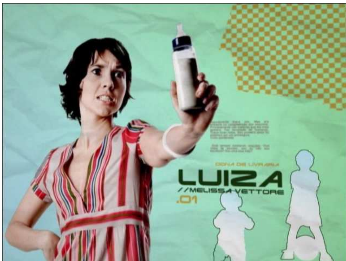
Figura 4: Vinheta de abertura do seriado Mothern .

de uma atriz pensativa, que remete à proposta do blog como espaço de se pensar a maternidade e a última personagem gritando, mostrando que ser mothern também é viver à beira de um ataque de nervos.