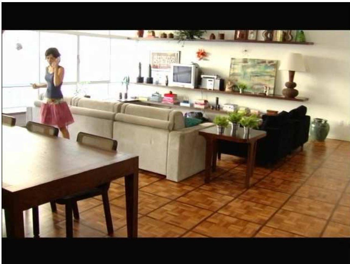
Figura 6: Cenário de residência de episódio da primeira temporada.

Os espaços são amplos, sempre limpos e bem divididos, dando dimensões de cenário para o ambiente. Este padrão está presente em todos os ambientes apresentados na trama. Nota-se uma estetização da vida cotidiana, herdada em parte das telenovelas da Rede Globo e da estética dos filmes publicitários dos anos noventa. Neste ponto, a série se diferencia substancialmente de Sex and the City , com seus ambientes mais “ruidosos” que buscam o efeito de real, com cenários que mostram objetos mais desalinhados, casas de parede descascadas, com roupas espalhadas, copos sujos sobre a pia e outras características que simulam o cotidiano em progressão.