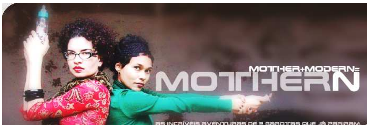
Figura 1: Layout do template Mothern .

A produção fotográfica também revela uma dose de esmero e um cuidado com o resultado final. O trabalho é da fotógrafa Márcia Chernizon com a produção das próprias criadoras. Laura e Juliana aparecem em poses que imitam as personagens do seriado “As Panteras”. Nesta série americana, que estreou em 1976, nos Estados Unidos, com o nome de Charlie’s Angels e rapidamente ganhou o restante do mundo, três jovens, bonitas e inteligentes, desvendavam crimes de maneira hábil e se destacavam pelo manejo de armas e sua astúcia em elucidar os casos. Em pouco tempo, As Panteras já estampavam capas de revista, pôsteres, comerciais de TV, além de cederem suas imagens para brinquedos, itens de beleza, camisetas e muitos outros produtos de marketing, bem como acontece no universo mothern .