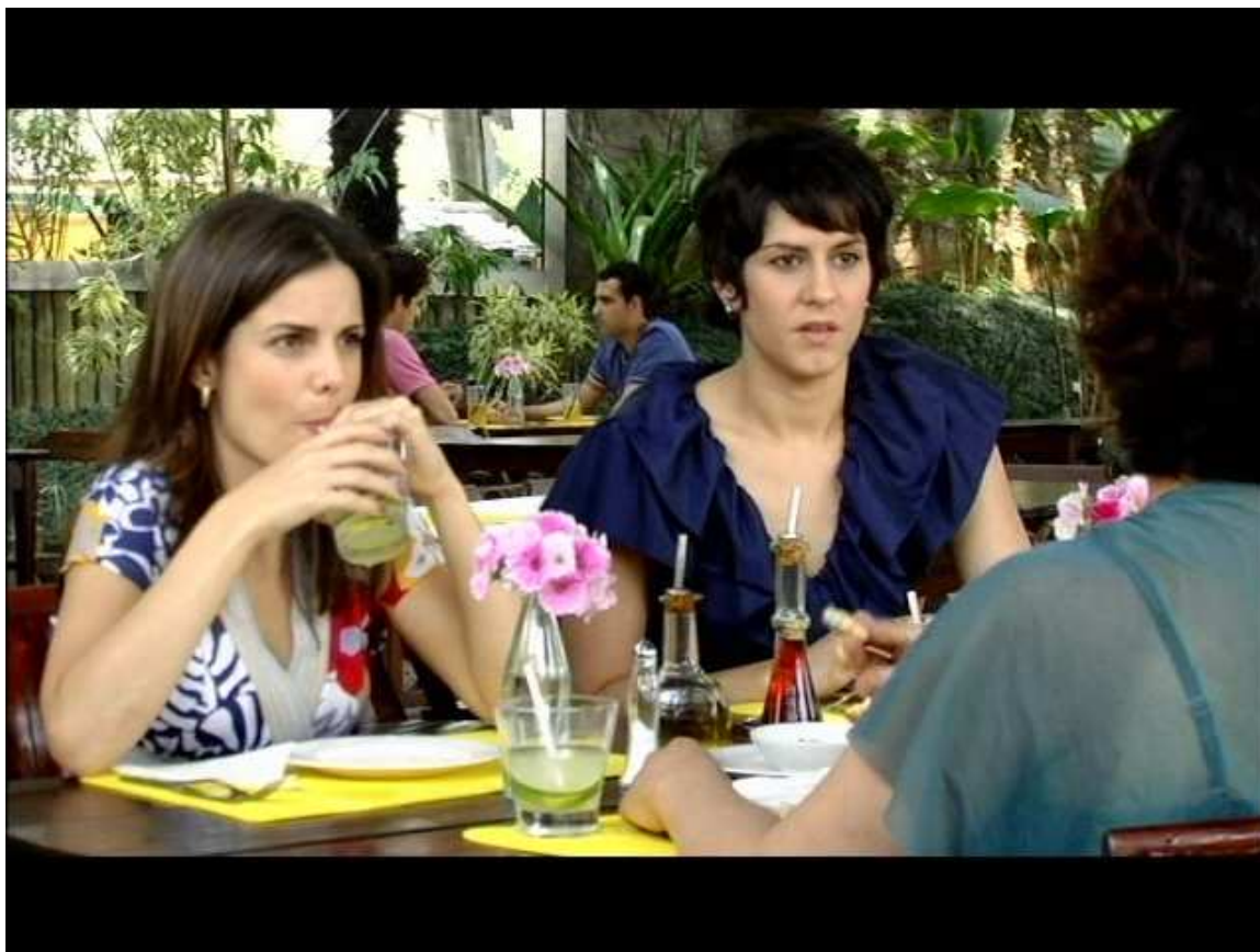
Figura 7: Encontro das moderns em restaurante.

Os ambientes de trabalho das quatro personagens é outro ponto de destaque da série. Foram escolhidas quatro profissões modernas: dona de livraria, dona de restaurante, publicitária e arquiteta. Nos quatro ambientes, modernos e sofisticados, elas desempenham suas tarefas do dia-a-dia profissional. Nota-se uma valorização deste ser modern , mulher que apesar de ter filhos, continua trabalhando fora, indo a cinemas, bares e se divertindo.