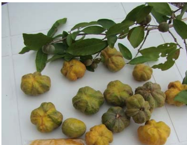
Figura 4. Frutos de Laranjinha de Pacu ( Pouteira glomerata (Miq.) Radlk).

ribeirinha. É um arbusto ou árvore, ramificada até o solo, de 1-8 m de altura. Floresce de setembro a dezembro e frutifica de janeiro a agosto. Os frutos são comestíveis, utilizado como alimento de peixe (isca) e no preparo de doces e sucos. (POTT e POTT, 1994). O fruto da laranjinha de pacu, espécie Pouteira glomerata (Miq.) Radlk, está apresentado na Figura 4.