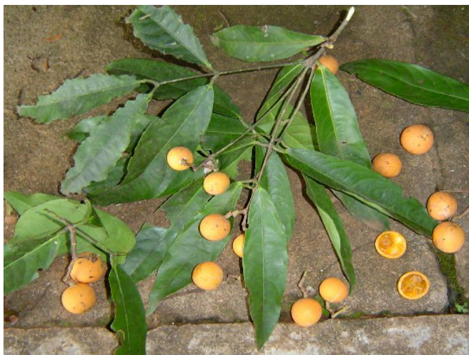
Figura 6. Frutos de Saputá ( Salacia elliptica G. Don.).