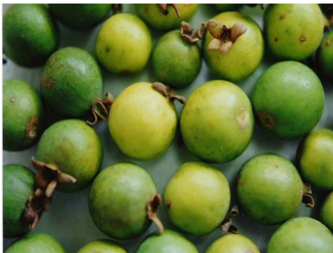
Figura 5. Frutos de Araçá ( Psidium guineense SW.).

no preparo de geléias, suco, doces, sorvete, licor (POTT e POTT, 1994). O fruto do araçá, espécie Psidium guineense SW., está representado na Figura 5.