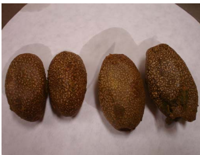
Figura 7. Frutos de Pateiro ( Couepia uiti ).

O pateiro ocorre de forma abundante em campos arenosos de inundação fluvial, canjiqueiral, mata ciliar de corixos e rios menores. É amplamente distribuído na região amazônica, do Piauí a Bahia, em savanas, cerrados, areias e rochas ribeirinhas no Brasil Central e Nordeste, e Paraguai. A árvore do pateiro apresenta 3-6m de altura, possuindo copa larga e baixa. Floresce de agosto a novembro e os frutos, muito semelhantes ao abacate, são utilizados para fazer doce (POTT e POTT, 1994). O fruto do pateiro espécie Couepia uiti , está apresentado na Figura 7.