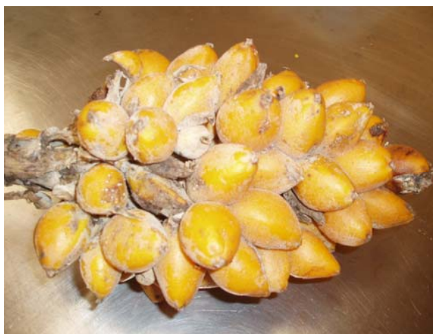
Figura 2. Frutos de Caraguatá ( Bromelia balansae Mez.) em cacho.

O caraguatá, também conhecido como gravatá e bananinha do mato, é um fruto da família Bromeliaceae, que frutifica em cachos, possuindo folhas duras com espinhos nas margens, atingindo de 40 a 90 cm de altura e apresentando flores violáceas em racemo. Possui casca fina, áspera e amarelada, e polpa branca constituída de uma matriz fibrosa. Os frutos variam em peso e tamanho, medindo de 3 a 5 cm de comprimento por 2 a 4 cm de diâmetro, e pesando entre 7,0 e 20,0 g. Junto com a polpa apresenta sementes pequenas, pretas e leves, sendo a média de 4 a 10 sementes por fruto. A polpa pode ser consumida in natura ou na forma de doces e xaropes (SILVA et al. , 2001). Na medicina popular atribui-se ao xarope poder expectorante, sendo este utilizado contra tosse (POTT e POTT, 1994). O fruto do caraguatá, espécie Bromelia balansae Mez., está apresentado na Figura 2.