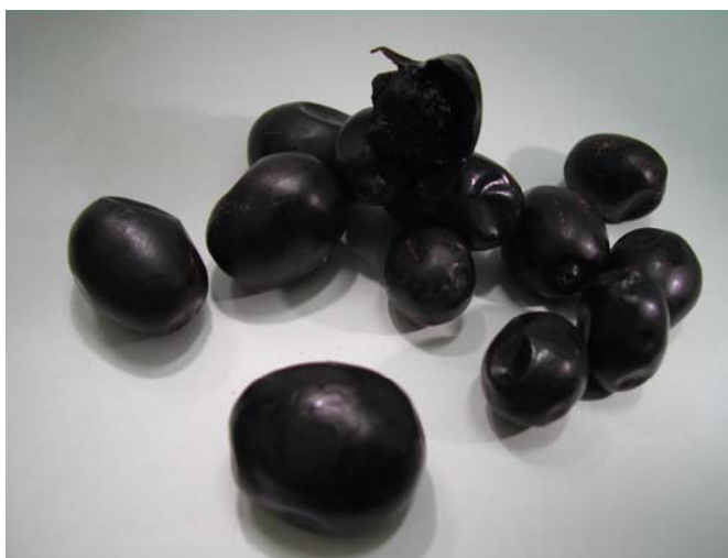
Figura 3. Frutos de Tarumã ( Vytex cymosa Bert).

O tarumã está presente desde a região Amazônica até Brasil Central, alcançando Mato Grosso do Sul e São Paulo. Também freqüente nas várzeas pantaneiras. Possui árvore alta, medindo de 10 a 20 metros de altura, apresenta inflorescência cimosa de cor lilás, muito usada para ornamentação. Os frutos têm cor roxa quando maduros (entre dezembro e fevereiro), com uma semente interna e polpa mucilaginosa de odor característico, são redondos com diâmetro geralmente de 2 cm e peso variando entre 5,0 e 9,0 g e podem ser consumidos in natura ou na forma de geléias e licores (POTT e POTT, 1994; LORENZI, 2002). Ao óleo essencial da espécie Vytex cymosa Bert. está associada à atividade antimicrobiana (FONSECA et al. , 2006). O fruto do tarumã, espécie Vytex cymosa Bert, está representado na Figura 3.